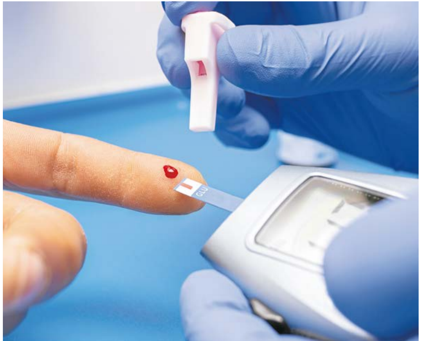
La diabetes es una enfermedad crónica que se origina porque el páncreas no sintetiza la cantidad de insulina que el cuerpo necesita, la elabora de una calidad inferior o no es capaz de utilizarla con eficacia.

"En la actualidad, la diabetes es una de las principales causas de fallecimiento en personas entre los 30 y los 70 años, y favo-