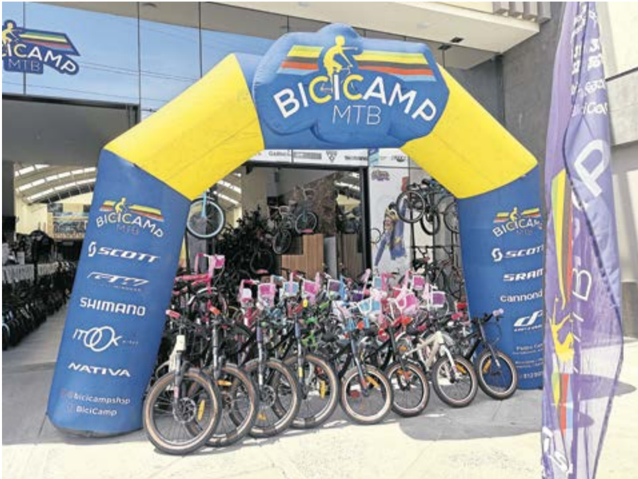
BICICAMP extiende una invitación a celebrar la Navidad compartiendo movimiento, salud y pedal.