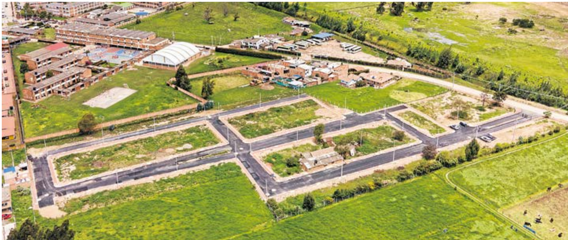
La urbanización no es un conjunto cerrado, y los compradores pueden diseñar su vivienda según sus preferencias, siempre que respeten los lineamientos de fachada definidos en la licencia, la construcción de la casa es para dos piso con altillo.