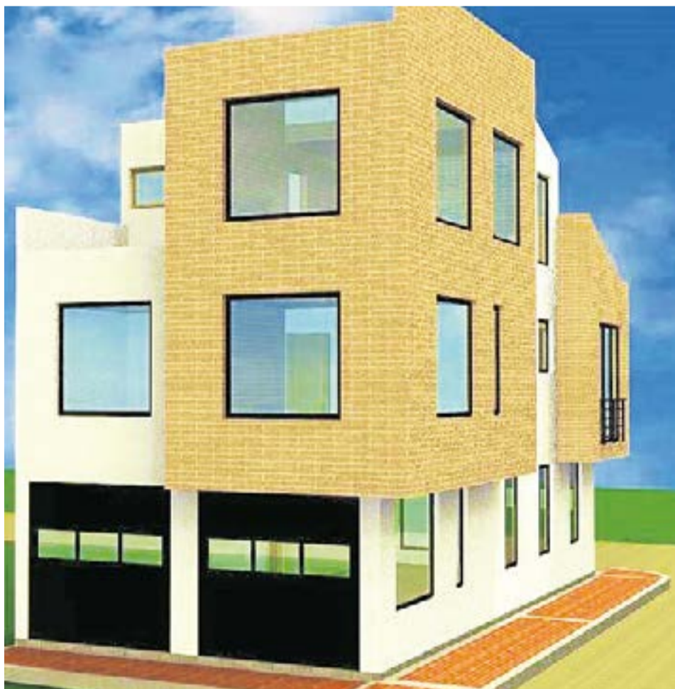
Los interesados pueden obtener más información a través de los números: 320-8301273, 310-3340865, 310-3340782 2303809”.

trucción, lo que demuestra que la urbanización está lista para recibir a sus nuevos residentes”, indicaron.