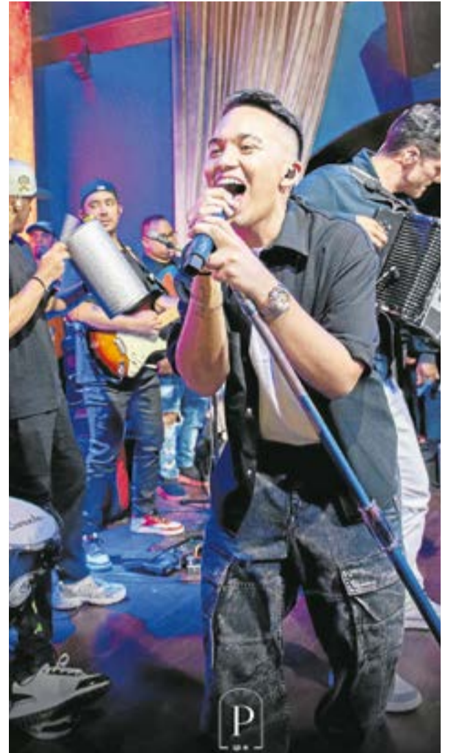
En el día mantiene un ambiente familiar; después de las 10:00 p.m., funciona para mayores de edad. Potosí dispone de espacios con capacidad entre 200 y 400 personas, según el tipo de evento. Allí realizan presentaciones con artistas en vivo. Fotos: Suministradas.