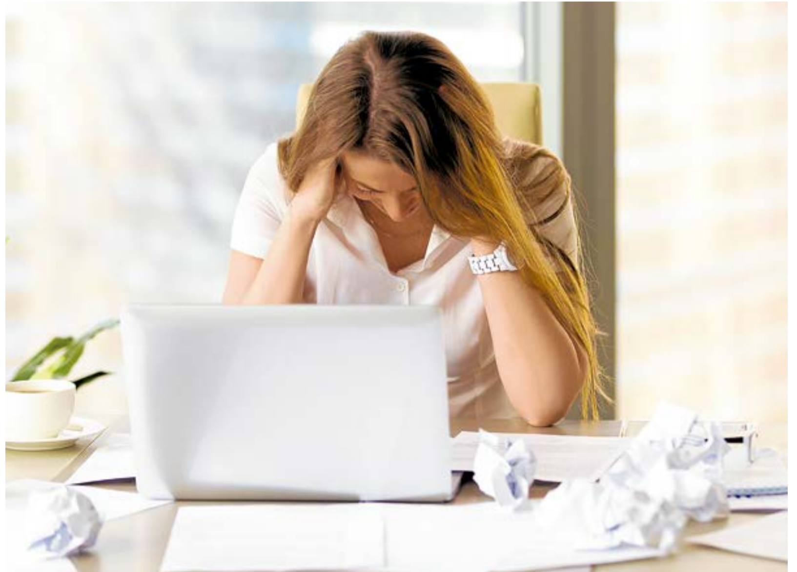
El estrés es un proceso natural que responde a la necesidad de adaptarnos al entorno; pero resulta perjudicial si es muy intenso o se prolonga en el tiempo. Por eso es importante saber cómo hacerle frente. A. Particular.

Cuando siente estrés, el cuerpo crea una hormona llamada cortisol, que ingresa en el flujo sanguíneo. Por breves periodos, el cortisol puede ayudar a regular muchas de las funciones naturales del cuerpo, incluso el sueño, peso, presión arterial y nivel de azúcar en sangre. Sin embargo, cuando se sufre estrés a largo plazo, los niveles de cortisol permanecen elevados. Esto puede