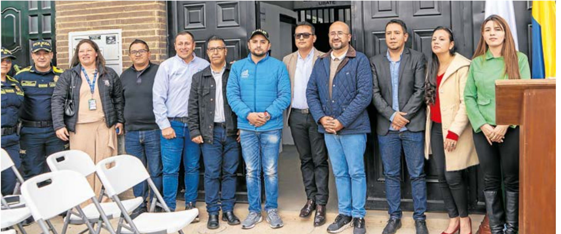
Con tres celdas de 4x4 metros y capacidad simultánea para 120 personas, el municipio implementa una estrategia de atención temporal enfocada en prevención, control institucional y articulación con la Policía Nacional.