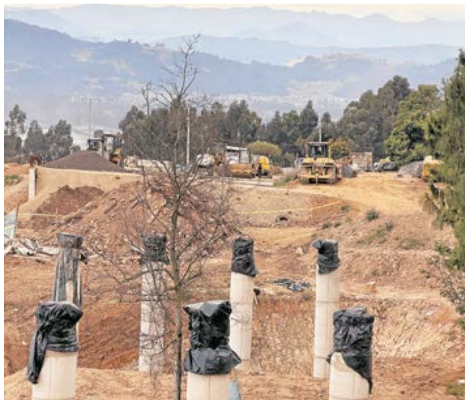
La decisión permite avanzar en la construcción de la doble calzada desde el peaje Casablanca, en un tramo de 7,382 kilómetros.

Entre las obras aprobadas se encuentran tres retornos vehiculares tipo corbatín en los sectores Casablanca, La Virgen y La Ruidosa; un puente vehicular; cinco pontones para el paso del agua; y un puente peatonal en el sector La Ruidosa.