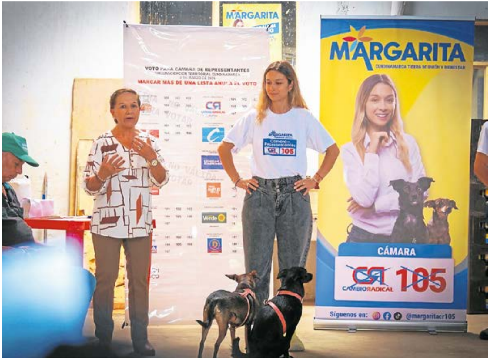
Su plataforma política incluye tres proyectos prioritarios: presupuesto para bienestar animal, apoyo a fundaciones y rescatistas, y una ley de asistencia técnica y productividad para pequeños productores.

En cinco meses de campaña ha visitado, según indica, más de 70 municipios, inspecciones y veredas. El