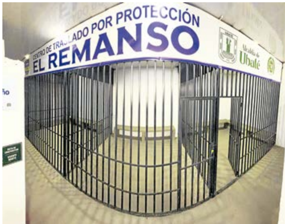
Durante el primer año se medirán indicadores como número de traslados, cumplimiento del límite de 12 horas.

El centro tiene capacidad para 120 personas, operará bajo los lineamientos de la Ley 1801 de 2016 y contará con presencia policial permanente y un equipo interdisciplinario financiado con un presupuesto anual de $231 millones.