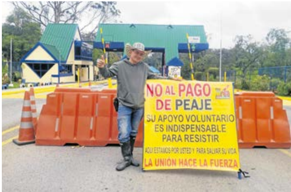
La comunidad del Centro Poblado de Garavito del municipio de Saboyá, Boyacá, se mantendrá en protesta en el peaje del municipio.

La población solamente se retirará del lugar hasta que el Inviás y el Gobierno Nacional se sienta a dialogar con ellos y lleguen a un acuerdo y este se cumpla.