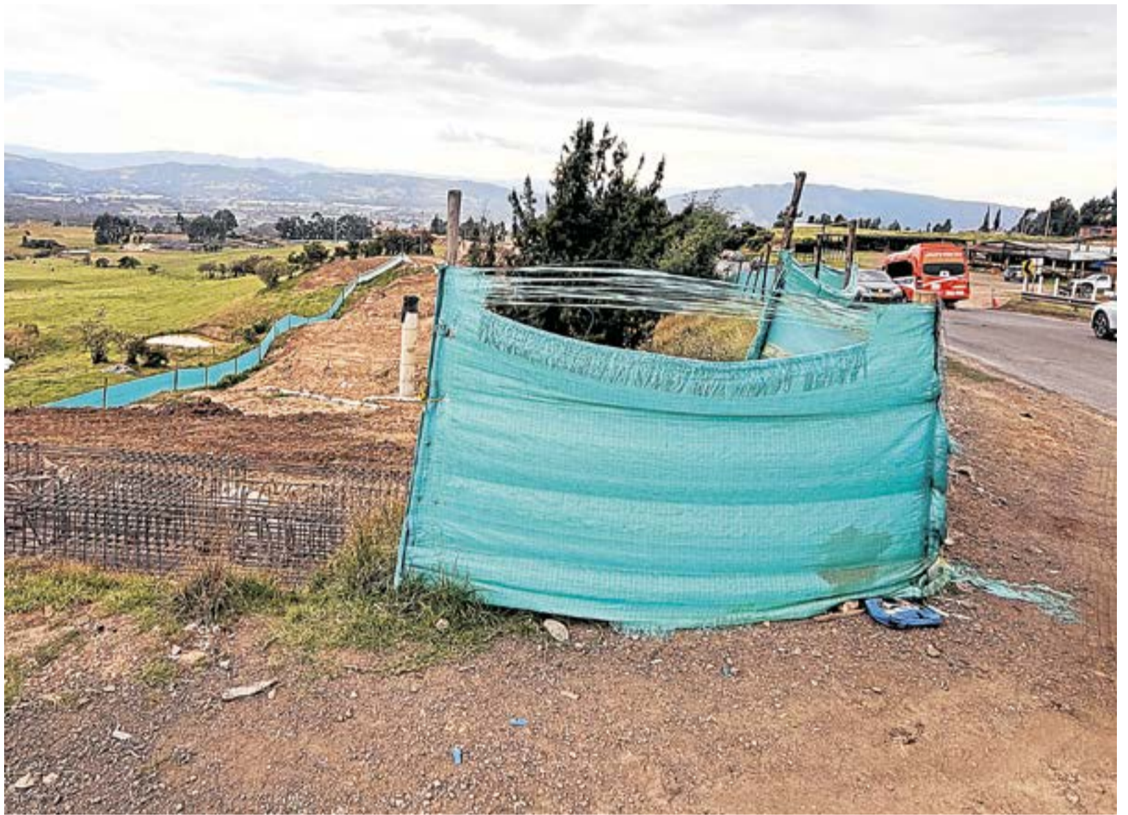
También se incluye la adecuación de accesos a predios privados y vías veredales, así como la construcción e intervención de obras hidráulicas como alcantarillas, box culvert, cunetas y canales para el manejo de aguas lluvias.

Según la ANLA, desde agosto de 2022 la Subdirección de Evaluación de Licencias Ambientales ha emitido 497 decisiones de licenciamiento, de las cuales 143 corresponden a modificaciones de proyectos licenciados, como el de la segunda calzada Casablanca - Ubaté.