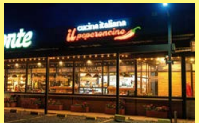
Ubicado en la vía Ubaté – Bogotá, Il Peperoncino celebra su primer año.

Con motivo de su primer aniversario, Il Peperoncino presenta el Pasticcio, un plato tradicional al horno preparado al estilo casero, que reúne una combinación de sabores representativos de la cocina italiana. Esta preparación hace parte del menú especial diseñado para acompañar la celebración y resaltar las técnicas y productos que identifican