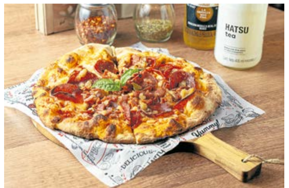
Cuore di Pizza hace parte de la oferta gastronómica de Il Peperoncino y atiende en la calle 6 #5-03.