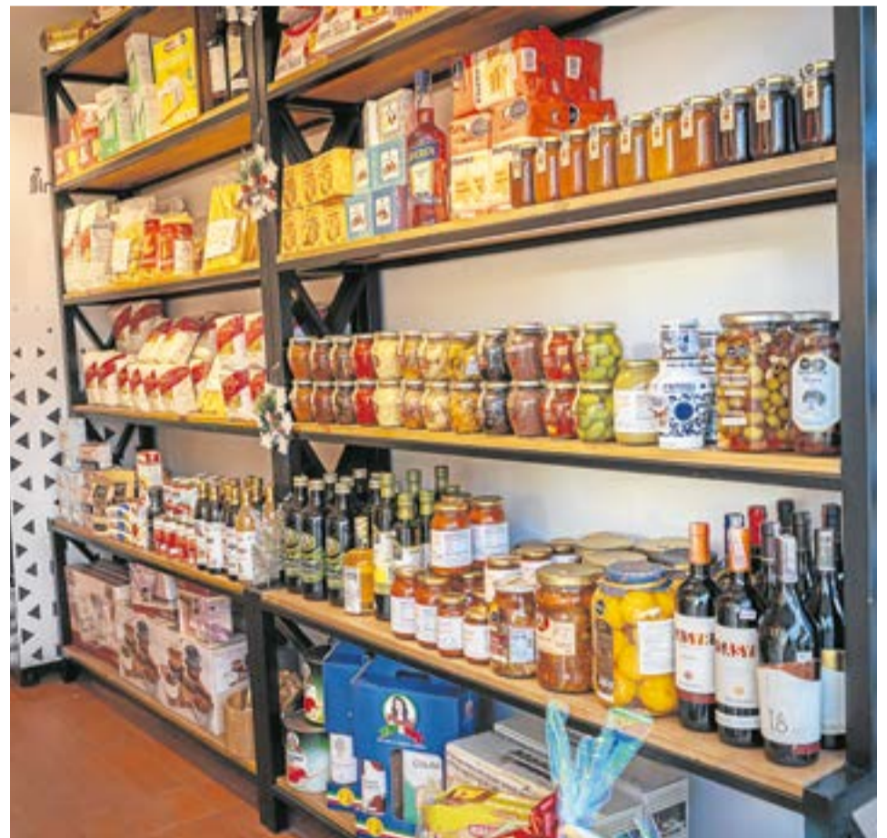
Casa Florio informó que su punto de venta en Ubaté está ubicado en la carrera 6 #6-86, Parque Principal, junto a Davivienda. La Villa-

se destacan la straciatella y la burrata, quesos frescos que se han convertido en los productos insignia de la marca y que han logrado posicionarse tanto en hogares como en cocinas especializadas.