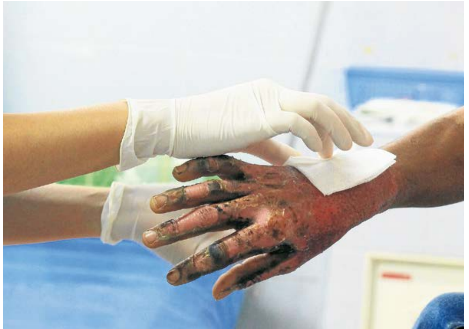
El Ministerio de Salud hace llamado a la prevención de accidentes en las fiestas decembrinas por el uso de la pólvora. Se hace énfasis en los niños, niñas y adolescentes, ya que históricamente son los más afectados. A.Part.

De acuerdo con el Instituto Nacional de Salud (INS), durante la temporada de vigilancia comprendida entre el 1 de diciembre de 2024 y el 31 de diciembre del mismo año, se reportaron más de mil personas lesionadas por pólvora en el territorio nacional, de las cuales una proporción significativa corresponde a niños, niñas y adolescentes. Las cifras preliminares indican un aumento frente a la temporada anterior, lo que mantiene la alerta de