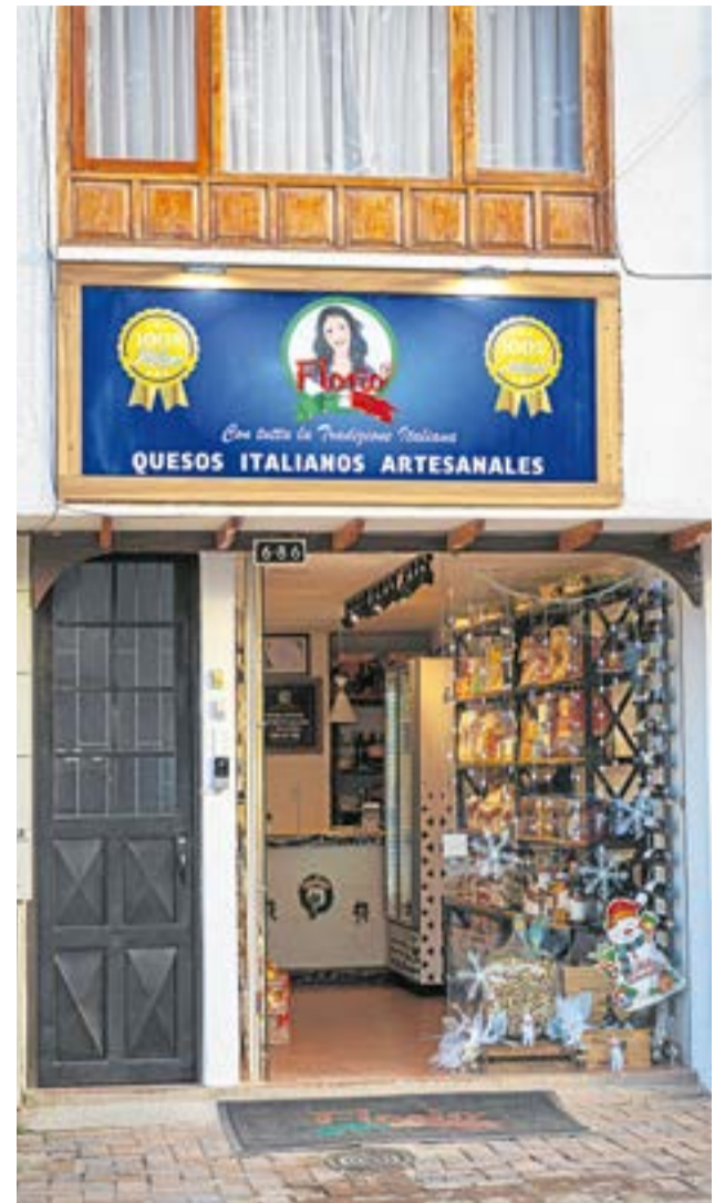
Casa Florio nació en Ubaté como una propuesta que une la tradición quesera italiana con la vocación lechera de la región. Su filosofía se basa en el respeto por la materia prima, el trabajo manual y los tiempos naturales de elaboración de cada producto. La Villa-