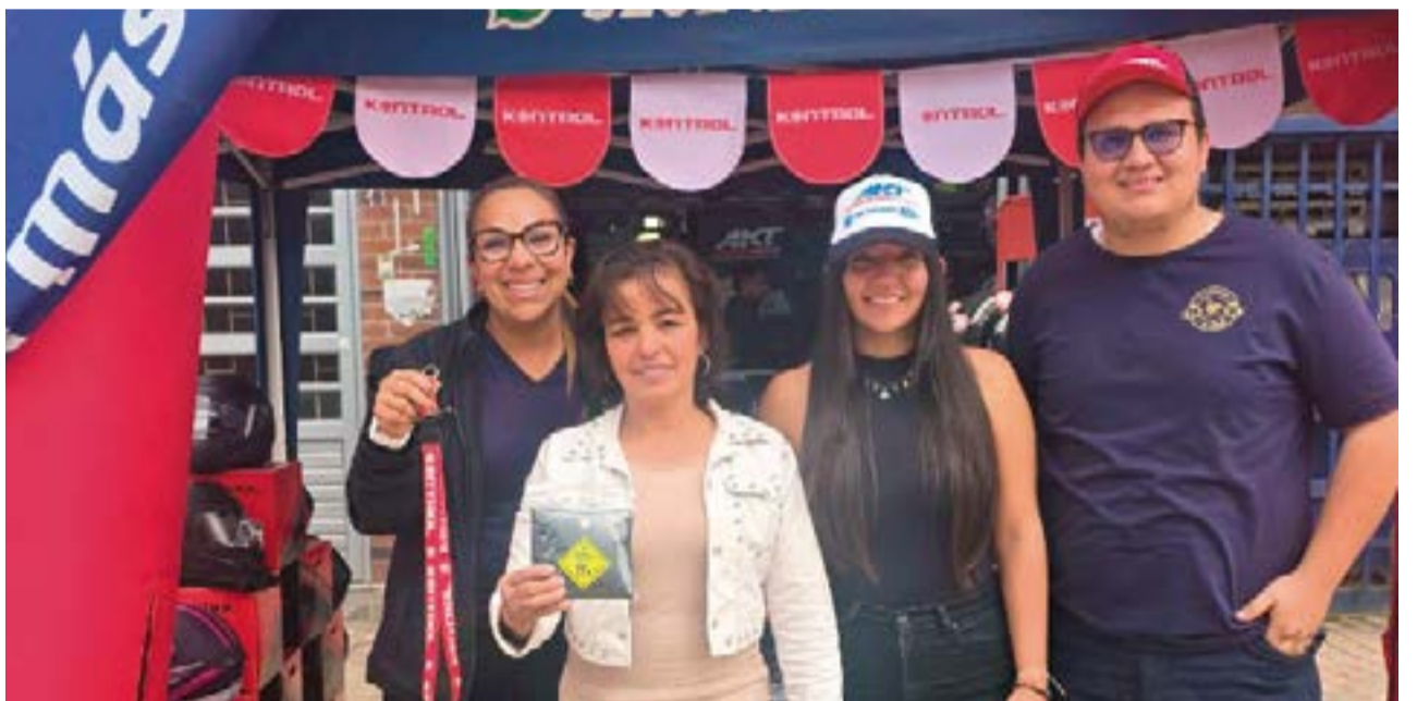
La sede de Ubaté se convirtió en el punto de encuentro de decenas de motociclistas entregaron el viejo casco. El uso del casco puede salvar la vida del conductor, y el pasajero.