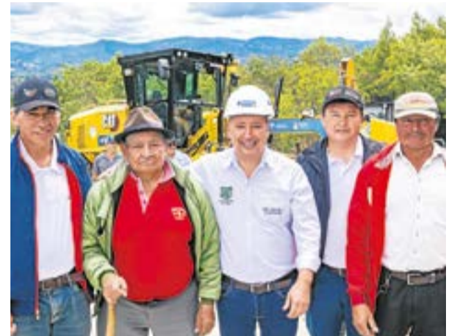
Maquinaria, movilidad rural y mejoramiento de servicios públicos integran el balance de gestión presentado por la Alcaldía de Fúquene, que además presentó la nueva retroexcavadora, adquirida para mantenimiento vial y atención de emergencias rurales. A. Particular.