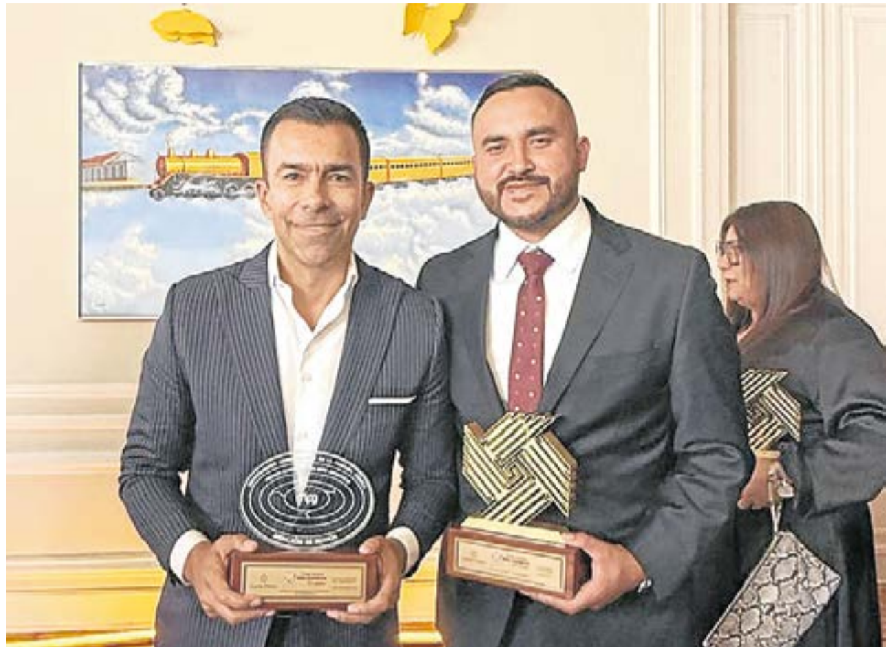
El reconocimiento, entregado por el Departamento Administrativo de la Función Pública, marca un hecho sin precedentes para este municipio de Sabana Centro, al posicionarlo entre las administraciones más destacadas de Colombia.