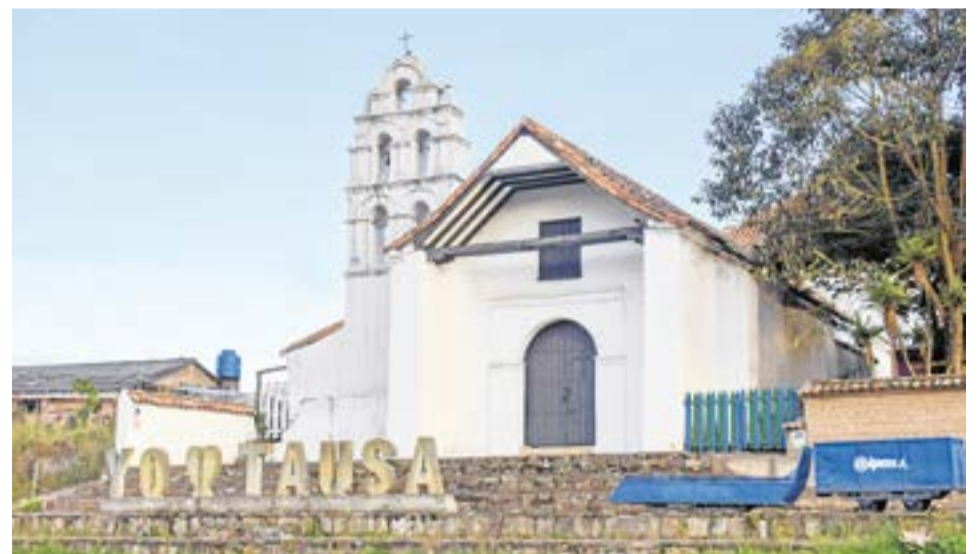
De acuerdo con la Alcaldía, este logro refleja el trabajo articulado de funcionarios, líderes comunitarios y ciudadanos.

completa 18 placas huella en dos años. Según la Administración, estos trabajos buscan "fortalecer la movilidad rural" y mejorar el tránsito hacia zonas productivas y residenciales.