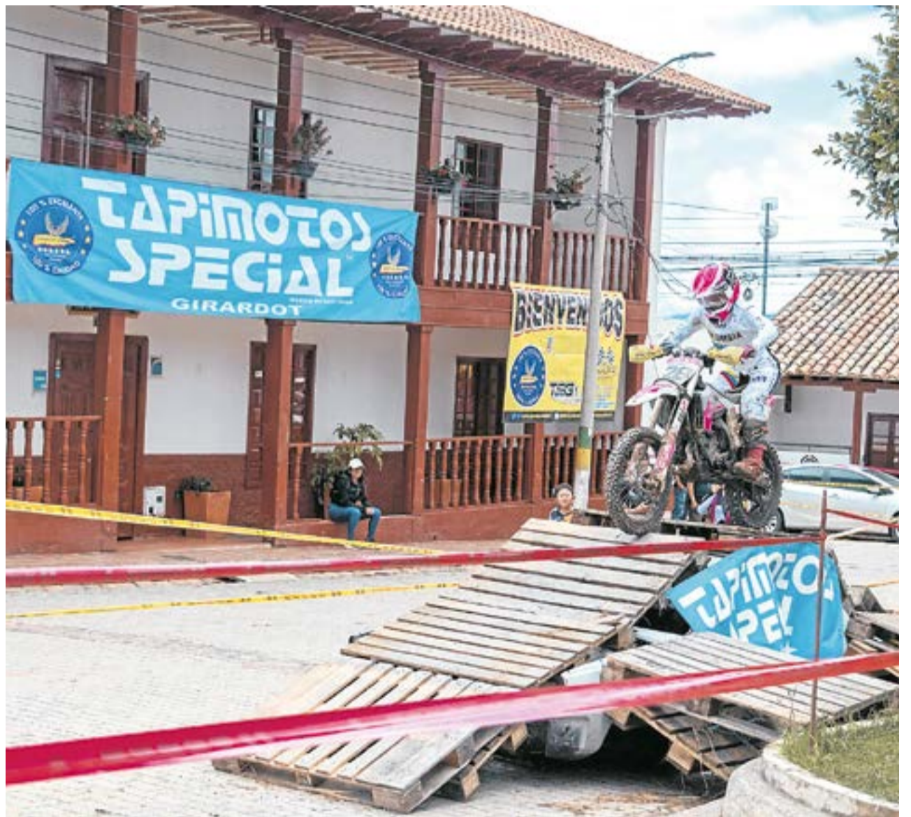
El municipio también acogió la quinta válida del Campeonato Enduro Andino 2025, que reunió a más de 200 pilotos.

Fúquene fue sede de varios encuentros deportivos, recreativos y culturales que convocaron a habitantes de la provincia de Ubaté y visitantes de varios departamentos.