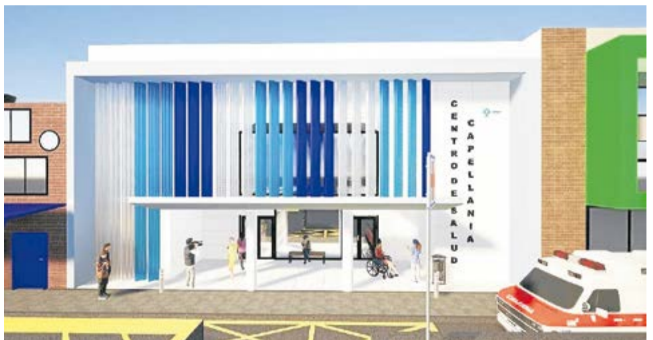
Imagen de referencia del diseño del Puesto de Salud de Capellanía, obra adelantada por la Alcaldía y la Secretaría de Planeación.

El municipio confirmó el inicio de la construcción del nuevo Puesto de Salud de Capellanía, obra liderada por la Alcaldía y la Secretaría de Planeación.