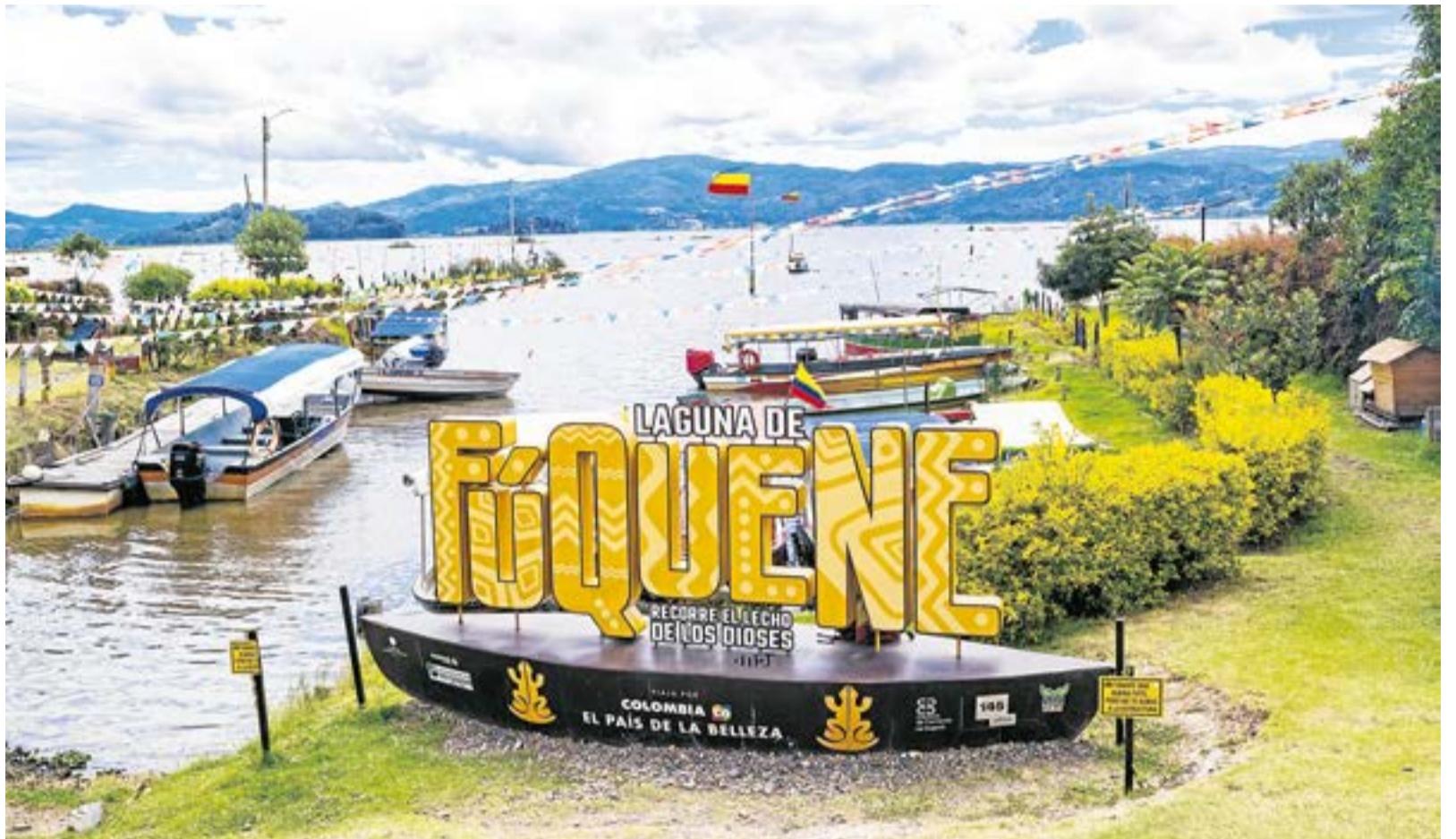
Las jornadas deportivas se complementaron con el segundo Festival Náutico de la Laguna de Fúquene, espacio en el que se realizaron actividades con veleros, kayaks, lanchas y motos acuáticas.