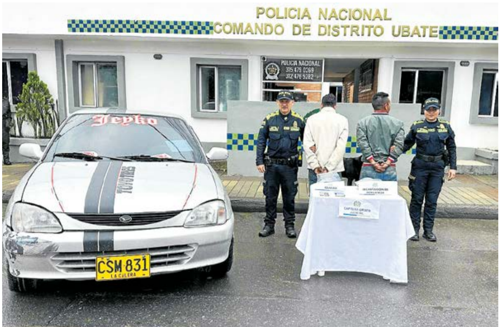
Los capturados fueron ubicados en el barrio San José cuando se movilizaban en el vehículo vinculado al caso; en el proceso se incautaron celulares, prendas de vestir y otros elementos probatorios.

Los capturados fueron ubicados en el barrio San José cuando se movilizaban en el vehículo vinculado al caso; en el proceso se incautaron celulares, prendas de vestir y otros elementos probatorios.