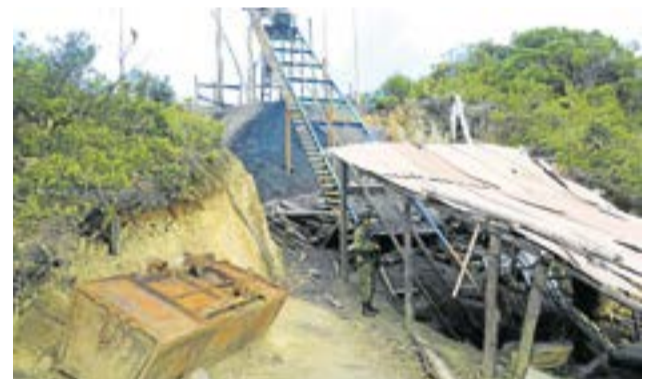
Hay debate por la lucha contra la minería ilegal y la legalización de pequeños mineros.

Sin embargo, tras conocerse el operativo, también surgieron reacciones de inconformidad entre algunos sectores vinculados a la minería, quienes cuestionaron