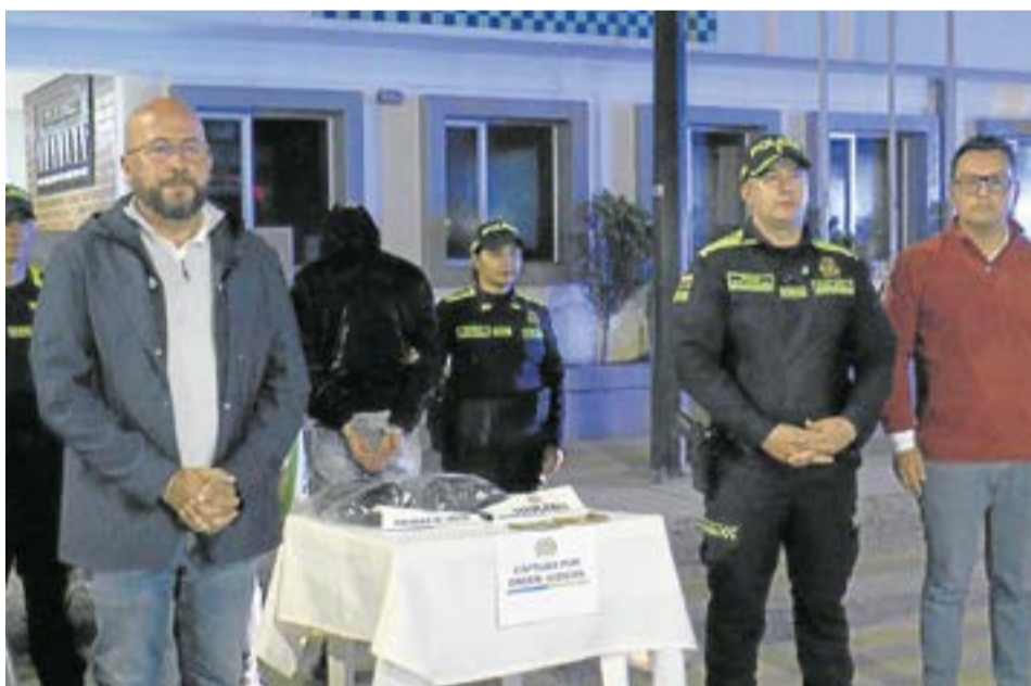
Un juez de control de garantías dictó medida de aseguramiento intramural contra los capturados, luego de las audiencias. A. Particular.