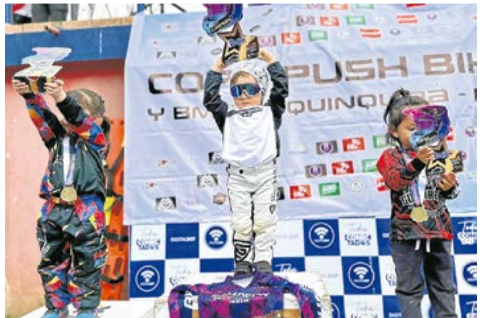
Ante la falta de opciones deportivas para su edad, su familia encontró en el PushBike BMX una alternativa que hoy le permite competir y proyectarse en nuevos eventos.

Su impacto digital incluso ha trascendido fronteras. El pasado 21 de abril, diversos medios nacionales e internacionales como El Heraldo de México, Radio Forever de Ecuador y otros