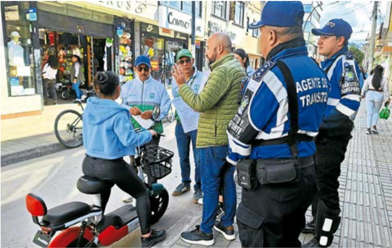
Recorridos de control evidencian fallas en el comportamiento de los conductores, lo que podría derivar en medidas más estrictas por parte de las autoridades.

Las autoridades recordaron que el uso del casco de seguridad es obligatorio, así como la circulación por los espacios permitidos y el respeto por las normas y señales de tránsito.