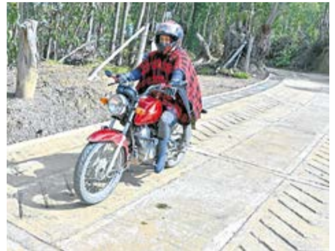
Con proyectos en ejecución y recursos asegurados, la Gobernación avanza en una intervención integral en Sutatausa que abarca desde la construcción de un megacolegio hasta obras de alcantarillado y atención médica permanente.