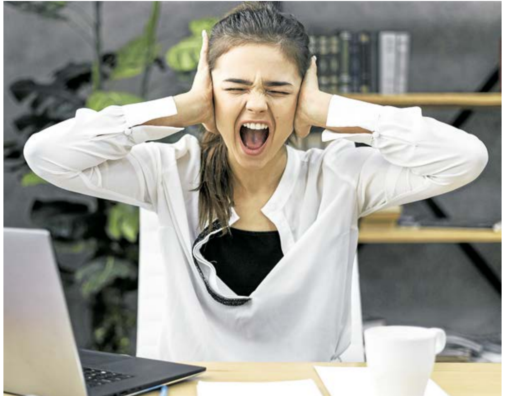
Mantener hábitos saludables y controlar el estrés se convierte en una prioridad para prevenir enfermedades cardiovasculares en medio de un contexto de incertidumbre.

En Colombia, el panorama no es ajeno a esta realidad. Según el Ministerio de Salud y Protección Social, los trastornos asociados a la ansiedad y el estrés han aumentado en los últimos años, especialmente tras la pandemia. A su vez, la Asoc-