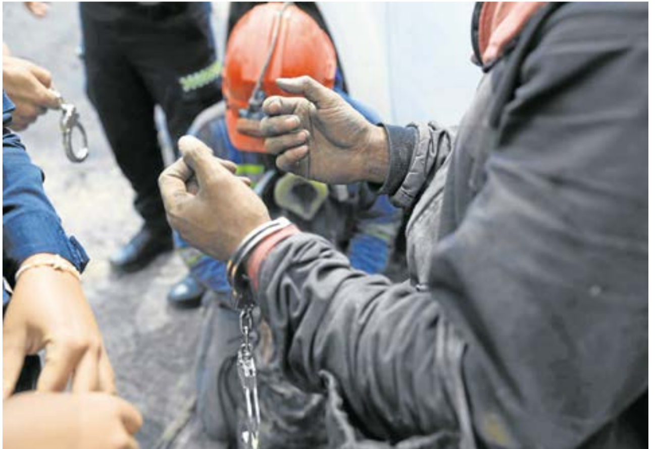
Surgieron reacciones de inconformidad entre algunos sectores vinculados a la minería, quienes cuestionaron que las capturas recaigan sobre los trabajadores. CAR Cundinamarca.

Las autoridades documentaron daños a la flora de la zona por la destrucción de cobertura vegetal, donde anteriormente habría especies como tuno esmeraldo, uva camarona, chilca, hayuelo, cucharo, fraile-jones y angelitos, entre otras.