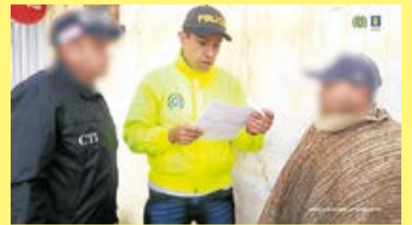
El hombre fue capturado en San Miguel de Sema (Boyacá) por el CTI

Por solicitud de la Fiscalía General de la Nación, un juez de control de garantías impuso medida de aseguramiento en centro carcelario contra un hombre que, presuntamente, agredió sexualmente a su hija, entre 2013 y 2025, en Simijaca, Cundinamarca.