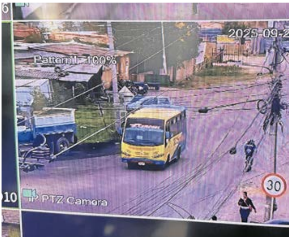
El sistema también incluye equipos en veredas, como parte del plan para ampliar la cobertura a la zona rural.

En la zona rural, veredas como Agua Colorada, Palogordo y Guatancuy también cuentan con cámaras, que complementan la red instalada en sectores urbanos como Villa Rosita, Estanzuela y El Portal.