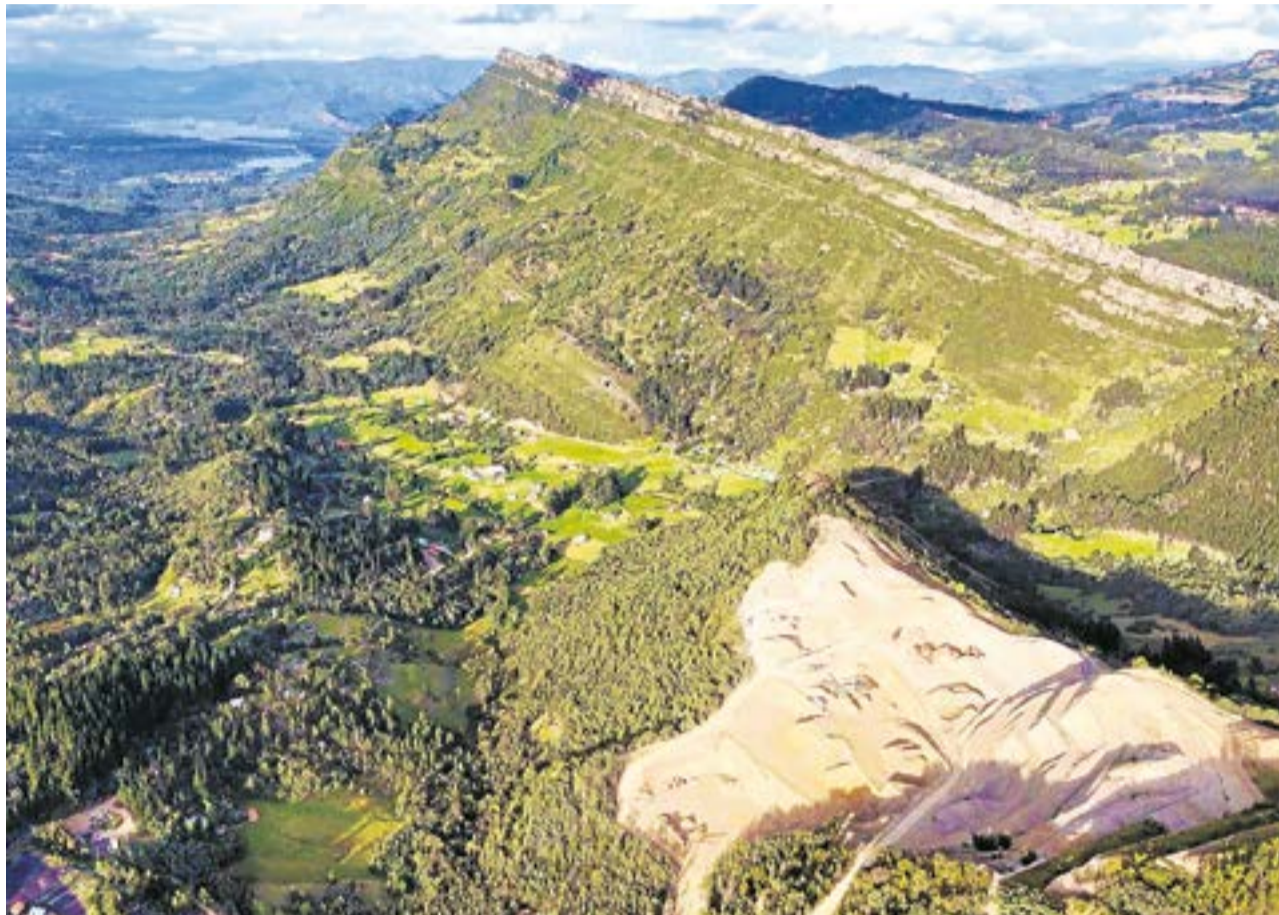
La Alcaldía de Sutatausa manifestó desacuerdo con nuevos títulos de minería a cielo abierto y la comunidad convocó a movilización el mismo día de la audiencia.

Cuatro propuestas de concesión minera, tres ordinarias y una diferencial, serán presentadas en audiencia pública en Sutatausa; organizaciones ciudadanas alertan que el proceso ya está avanzado y la administración municipal insiste en priorizar el agua y la comunidad.