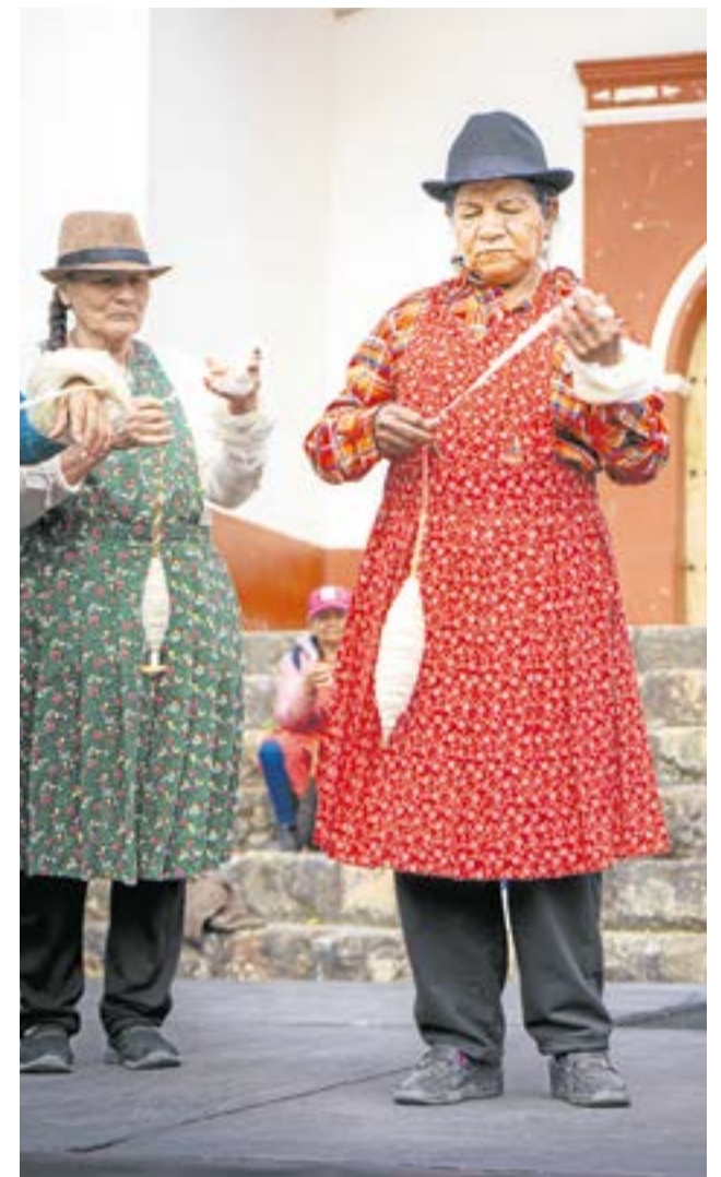
Concursos de hilanderos y esquiladores, pasarelas de diseño empírico, talleres de cerámica y cestería, así como homenajes a guardianas del tejido, marcaron la agenda del festival que fortalece la identidad cultural y la economía creativa de Cundinamarca. La Villa