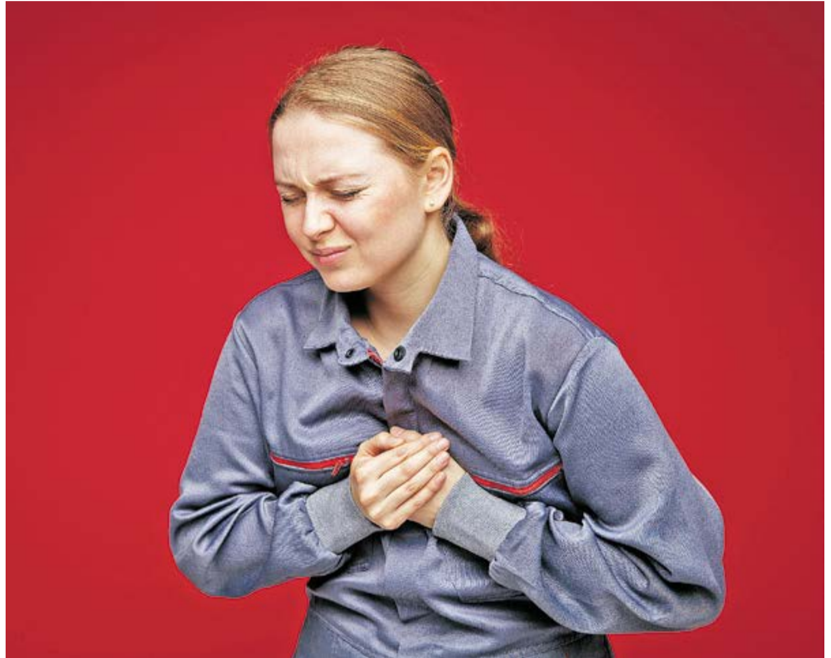
El corazón es el órgano central de la circulación de la sangre, y su función es vital en la vida de todo ser humano, de ahí la importancia de mantenerlo sano. Un diagnóstico a tiempo salva muchas vidas.

Los especialistas resaltan que el país debe trabajar en la prevención y el diag-