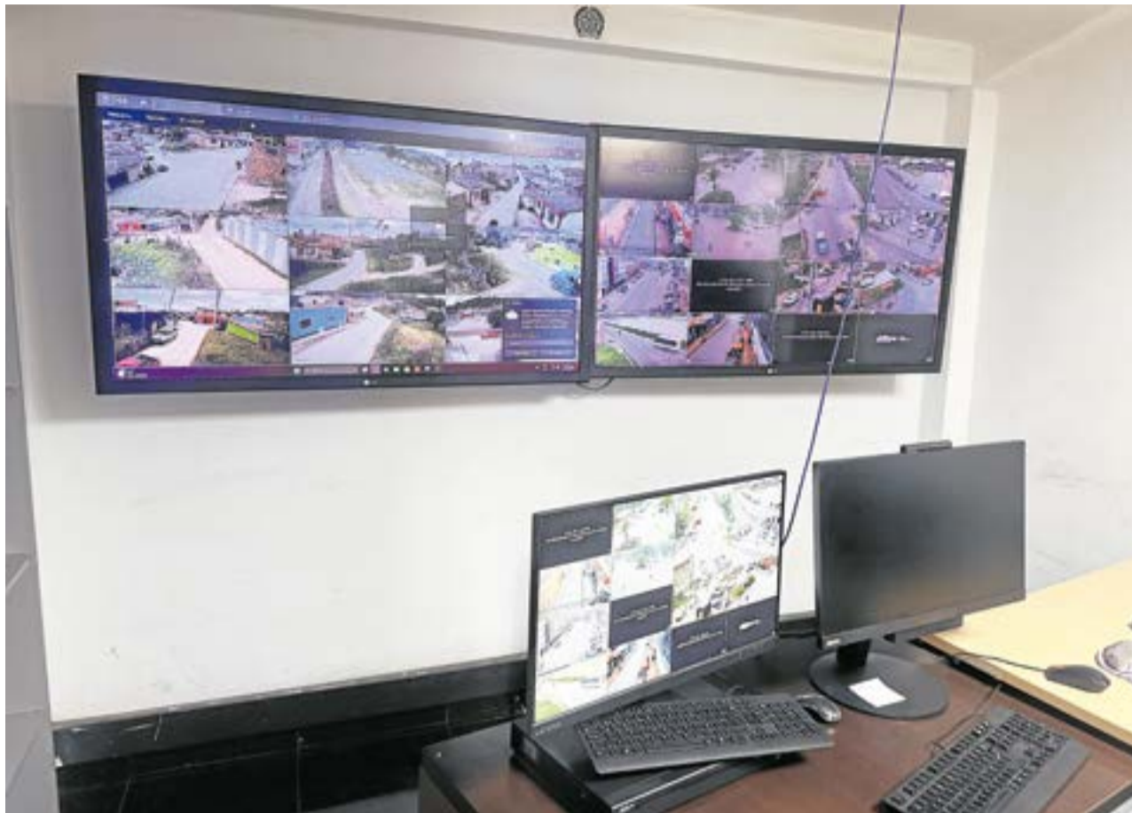
Los nuevos equipos de seguridad buscan ampliar la cobertura en sectores comerciales, barrios tradicionales y accesos al municipio, fortaleciendo el monitoreo en tiempo real.

El programa Centinela 24/7 ya cuenta con más de 200 cámaras instaladas en barrios como San Ignacio, Santa Bárbara, Calderitas y sectores del centro de Ubaté, además de veredas como Las Brisas y Chircales.