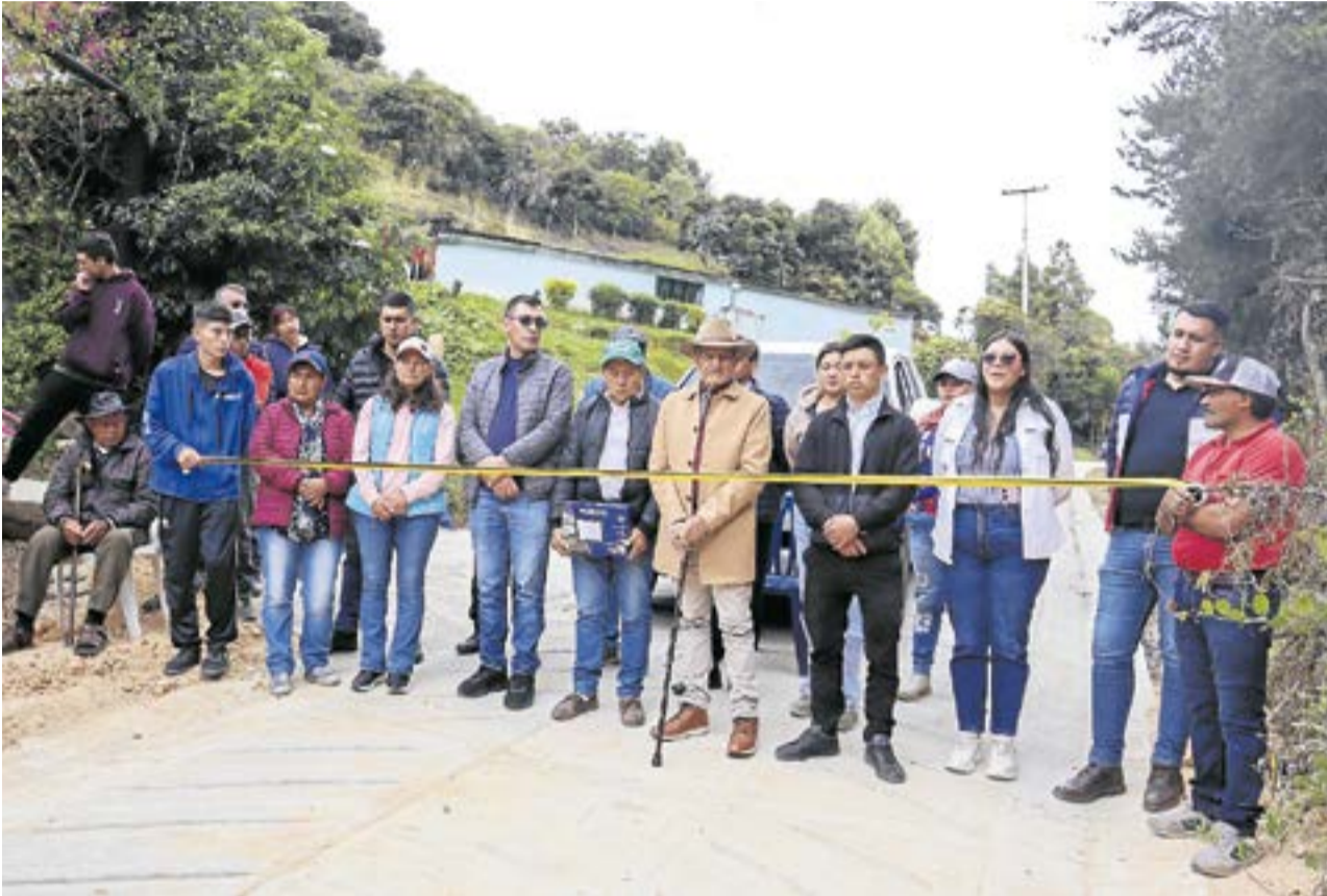
La estrategia de la Alcaldía de Guachetá incluye supervisión técnica y participación de las comunidades en la construcción, con el fin de asegurar sostenibilidad y cobertura.

De las 18 placas huella previstas para este año en Guachetá, ya se entregaron cuatro en las veredas Ticha, Guachetá Alto, La Puntica y Ranchería, en el marco del programa "Vías del Progreso".