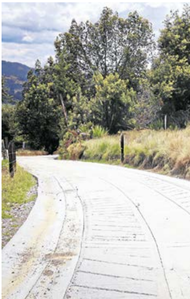
De las 18 placas huella previstas para este año en Guachetá, ya se entregaron cuatro.

El programa "Vías del Progreso" contempla 18 placas huella en 2025, de las cuales ya se han entregado cuatro en sectores priorizados por su importancia productiva y comunitaria.