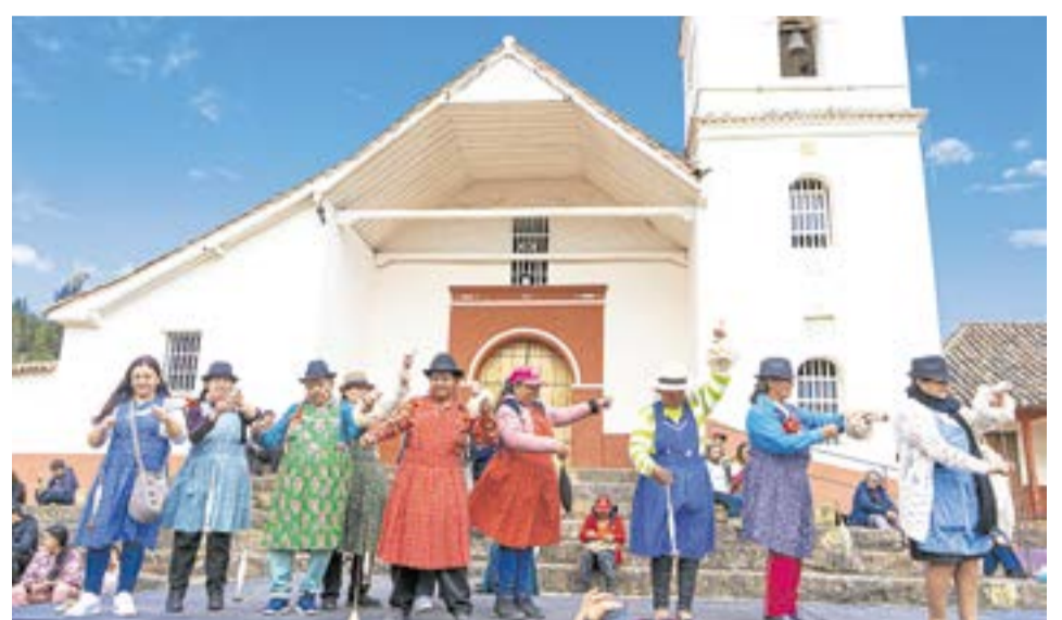
Durante dos días, el municipio fue escenario de talleres, pasarelas, concursos y homenajes que exaltaron los oficios artesanales. A.Pr.

más que tradición; es identidad, economía y comunidad. Gracias a los artesanos, artistas, entidades y habitantes por hacer posible este