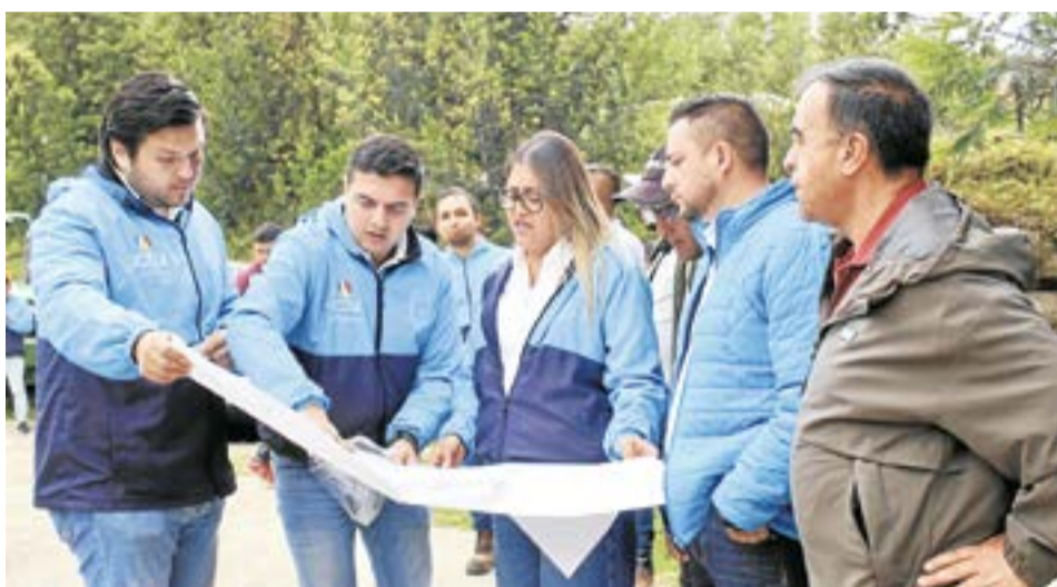
El proyecto del colegio beneficiará a más de 600 estudiantes del municipio de Sutatausa y cercanías.

de captación de aguas lluvias, compostaje y estrategias de ahorro de agua y energía.