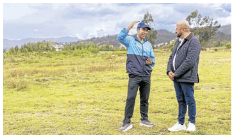
Gobernador Rey y el alcalde Richard Bernal recorrieron el lote donde se desarrollará el proyecto habitacional "Verde Esperanza".