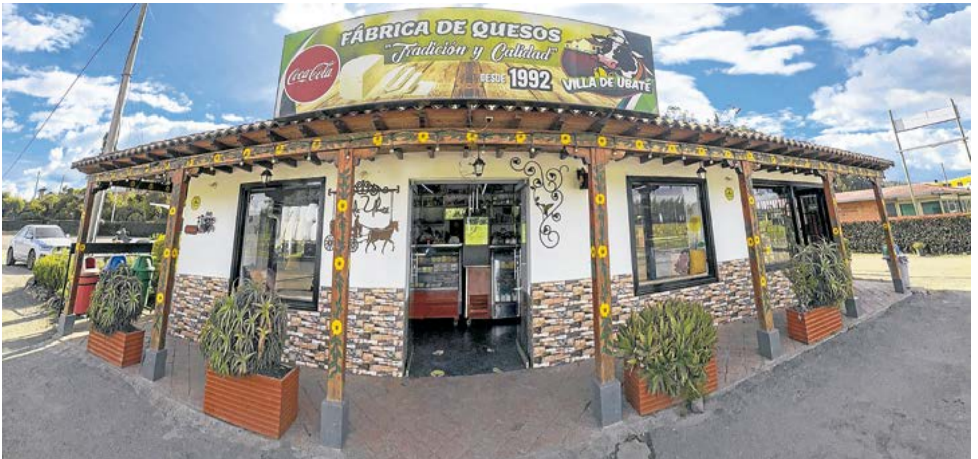
Lácteos La Vaca de Don Pedro informaron que el inconveniente con el registro sanitario vencido se presentó por el uso accidental de envases en cuarentena y aseguraron que se mantienen los estándares de calidad y legalidad en la planta de Ubaté.