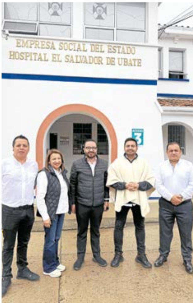
La nueva dotación hospitalaria fortalece los servicios de salud en la provincia. A. Part.

Autoridades nacionales, departamentales y locales presentaron la nueva dotación hospitalaria en Ubaté, una gestión que busca mejorar la atención médica y avanzar hacia la construcción de un hospital de tercer nivel en la provincia.