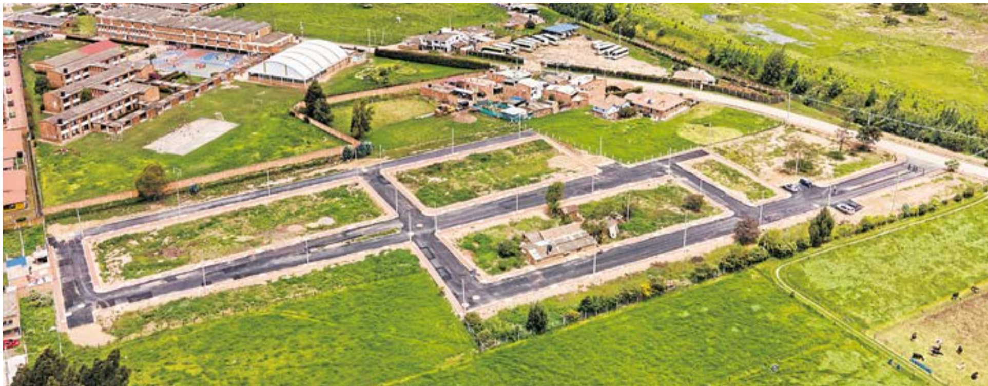
La urbanización no es un conjunto cerrado, y los compradores pueden diseñar su vivienda según sus preferencias, siempre que respeten los lineamientos de fachada definidos en la licencia, la construcción de la casa es para dos piso con altillo.