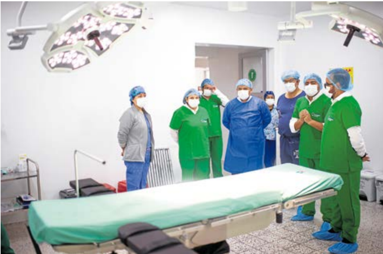
El Hospital recibió dotación para las salas de cirugía y equipos de anestesia gracias a la gestión articulada entre congresistas, autoridades locales y la gerencia del centro asistencial.