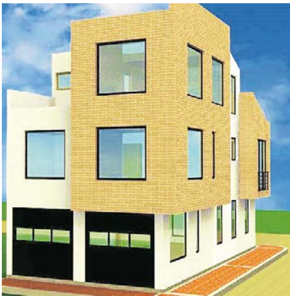
Los interesados pueden obtener más información a través de los números: 320-8301273, 310-3340865, 310-3340782 2303809”.

trucción, lo que demuestra que la urbanización está lista para recibir a sus nuevos residentes”, indicaron. Y agregan: “Con serie-