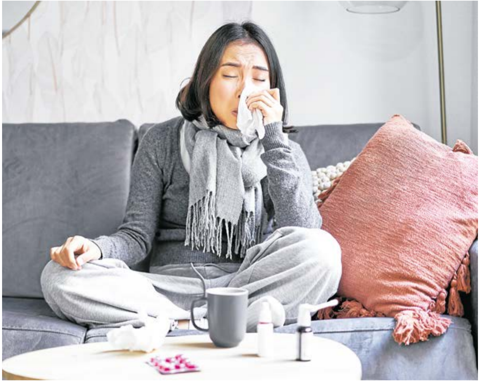
El padecimiento se caracteriza por ser de fácil propagación, ya que se transmite a través de los fluidos que se expulsan al toser, estornudar y hablar, los cuales quedan en el aire o en objetos con los que se tenga contacto.

El virus de la influenza conlleva a complicaciones respiratorias como neumonía y bronquitis, entre otras.