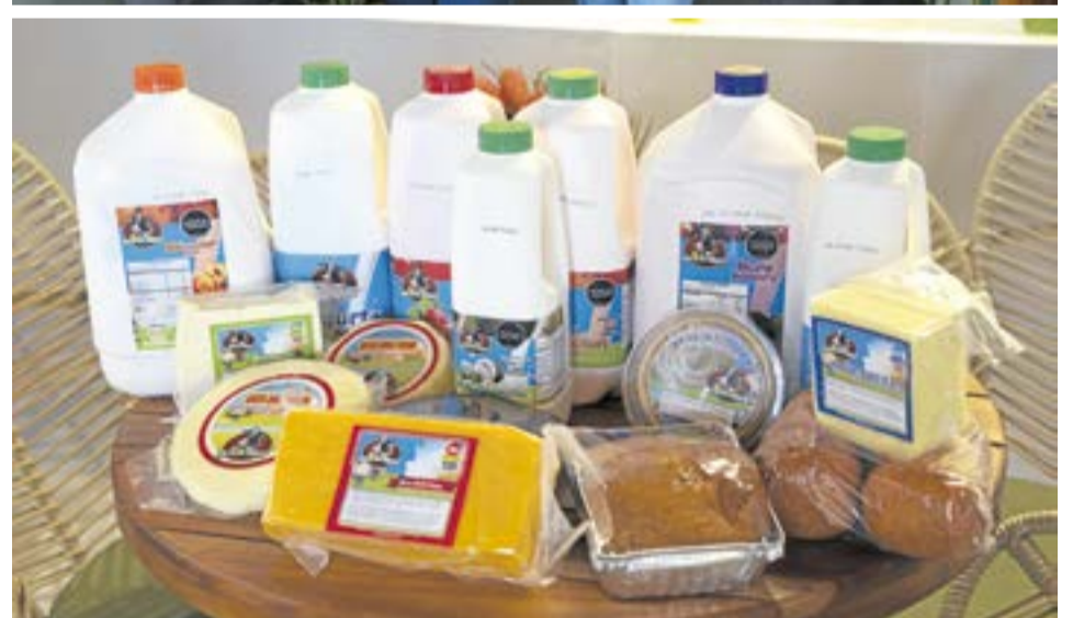
Lácteos La Vaca de Don Pedro aclaró que el incidente fue detectado y corregido, que su registro sanitario se encuentra vigente.

ses ha sido increíble. Nos llena de alegría y fortaleza su respaldo y cariño, porque reconocen nuestra trayectoria familiar, la calidad de nuestros productos y el servicio que ofrecemos", expresaron, al referirse a la campaña espontánea en redes sociales bajo la consigna: "En Ubaté apoyamos lo nuestro".