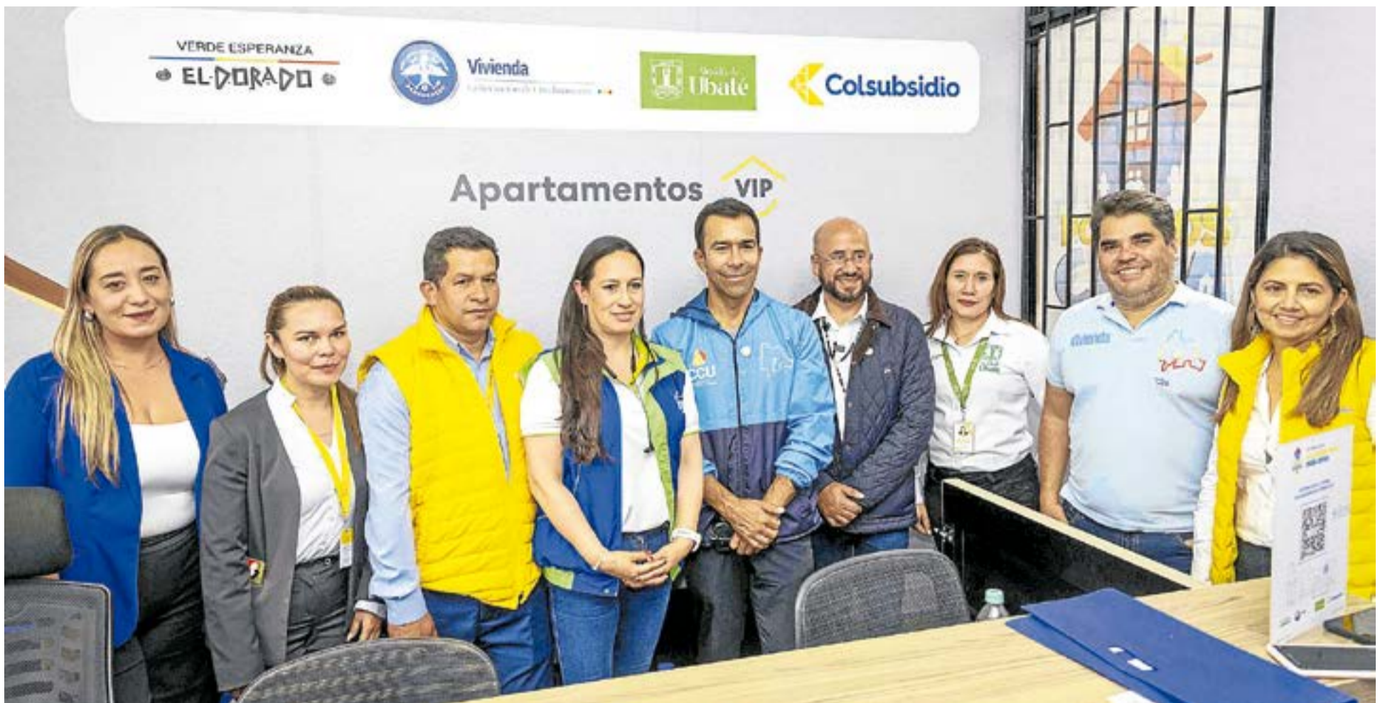
Autoridades departamentales y municipales se reunieron con ciudadanos interesados en el proyecto de vivienda, durante la visita a la sala de ventas y al predio destinado a la construcción.