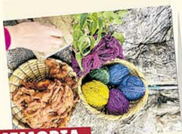
MEMORIA DEL TEJIDO