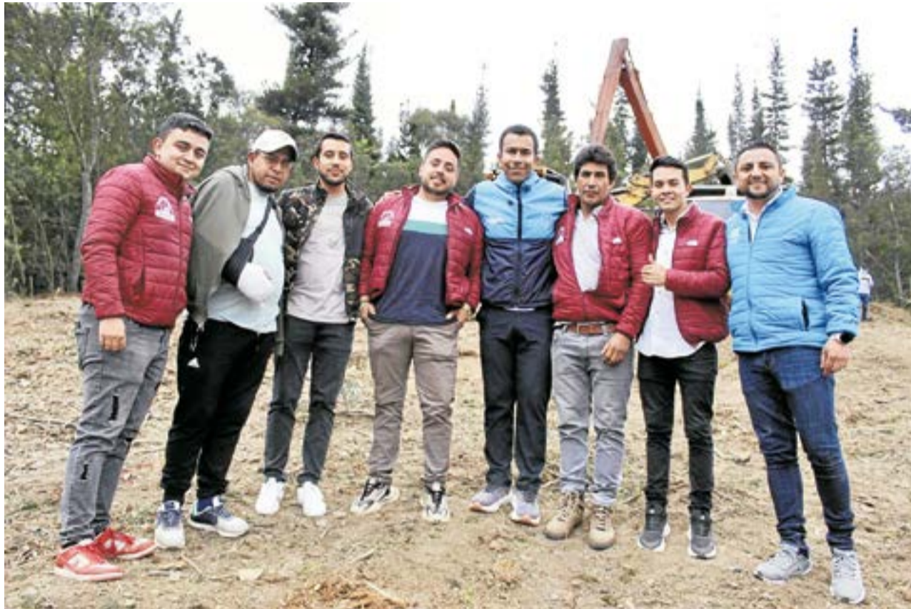
Acto de inicio de la adecuación del terreno para la construcción del nuevo colegio departamental en Sutatausa, con la presencia del alcalde, concejales y el gobernador.