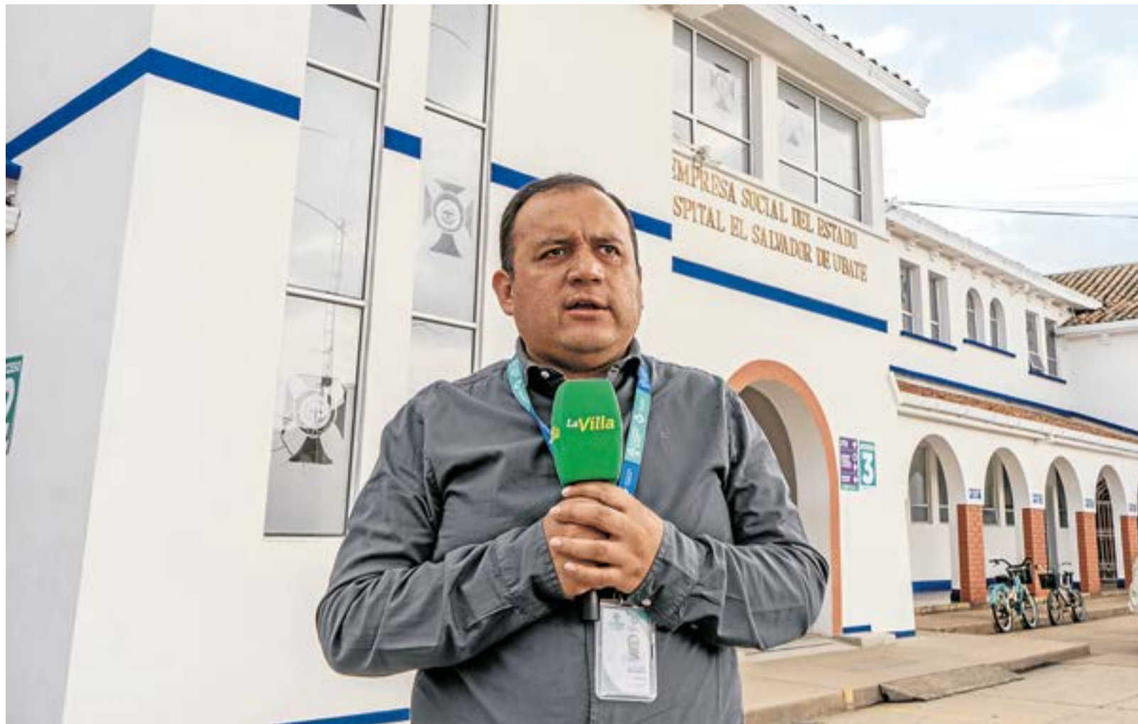
Persisten desafíos en la percepción del servicio, la optimización de la atención al usuario. Además, la sostenibilidad financiera sigue siendo un reto en medio de la crisis del sector salud, con pagos tardíos por parte de las EPS.

A pesar de los avances, el reto de mejorar la calidad del servicio sigue latente. "Siempre que haya seres humanos atendiendo a otros seres humanos, habrá cosas por mejorar", concluyó Niño. "Nuestro desafío es humanizar la atención y fortalecer la calidad del servicio".