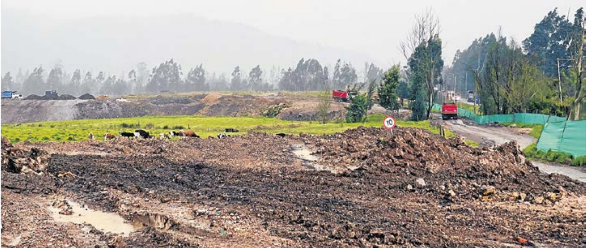
Dentro de la solicitud de adecuación y restauración del suelo con fines agrícolas, el solicitante debe presentar ante la Corporación un plan de manejo ambiental y el informe técnico evidencia que no se está cumpliendo a cabalidad con el requisito.