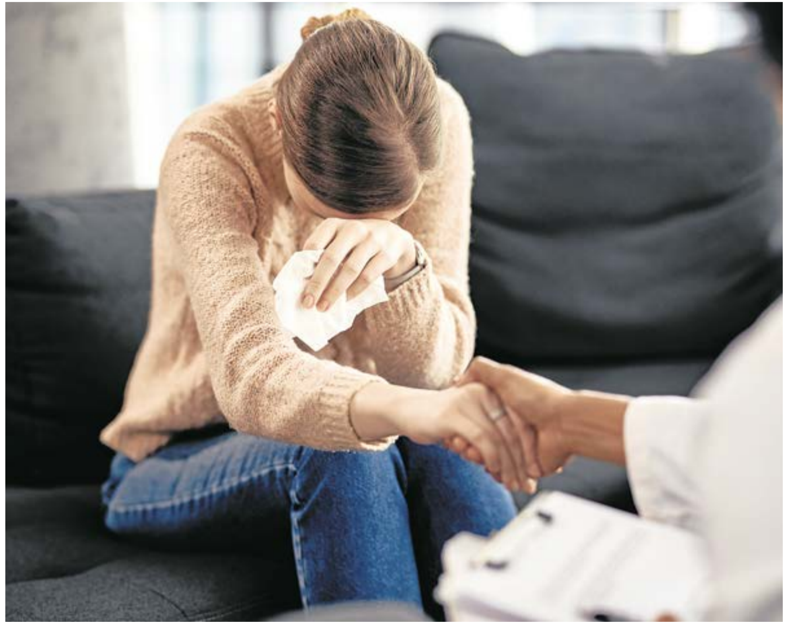
Otros síntomas son el aislamiento social, conflictos frecuentes en las relaciones interpersonales, sentimientos de desesperanza, dolores físicos sin causa aparente y pensamientos persistentes de preocupación o miedo. A.Part.

También se han identificado otros síntomas como el aislamiento social, conflictos frecuentes en las relaciones interpersonales, sentimientos de desesperanza, dolores físicos sin causa aparente, aumento en el consumo de sustancias