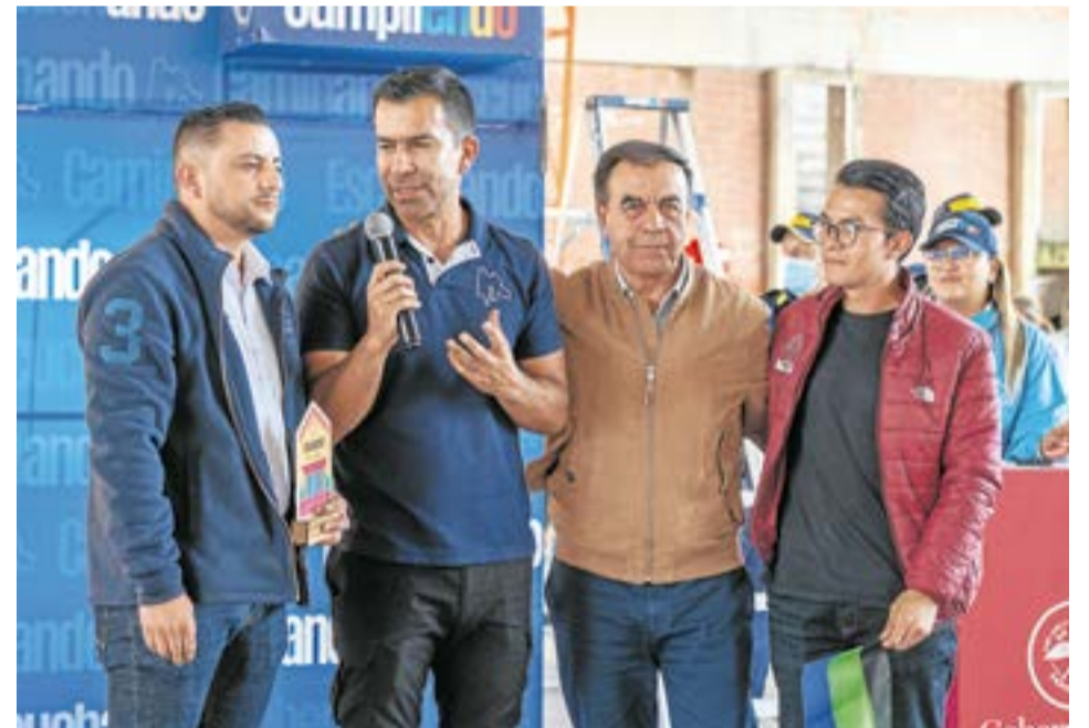
El gobernador Jorge Emilio Rey Ángel confirmó el inicio del proceso licitatorio para el nuevo colegio de Sutatausa.

La educación en Sutatausa es una de las priorida-