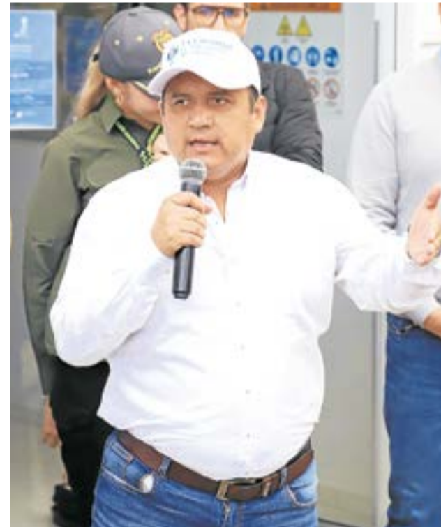
A pesar de los avances, el reto de mejorar la calidad del servicio sigue latente.