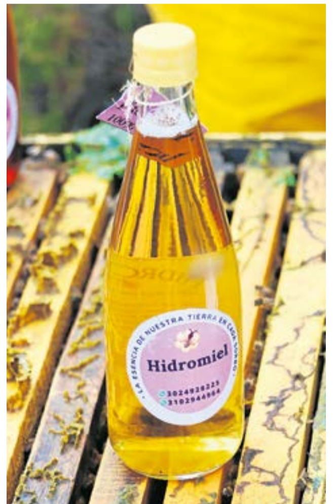
Se busca fortalecer la economía y consolidar como referente en la producción de miel.