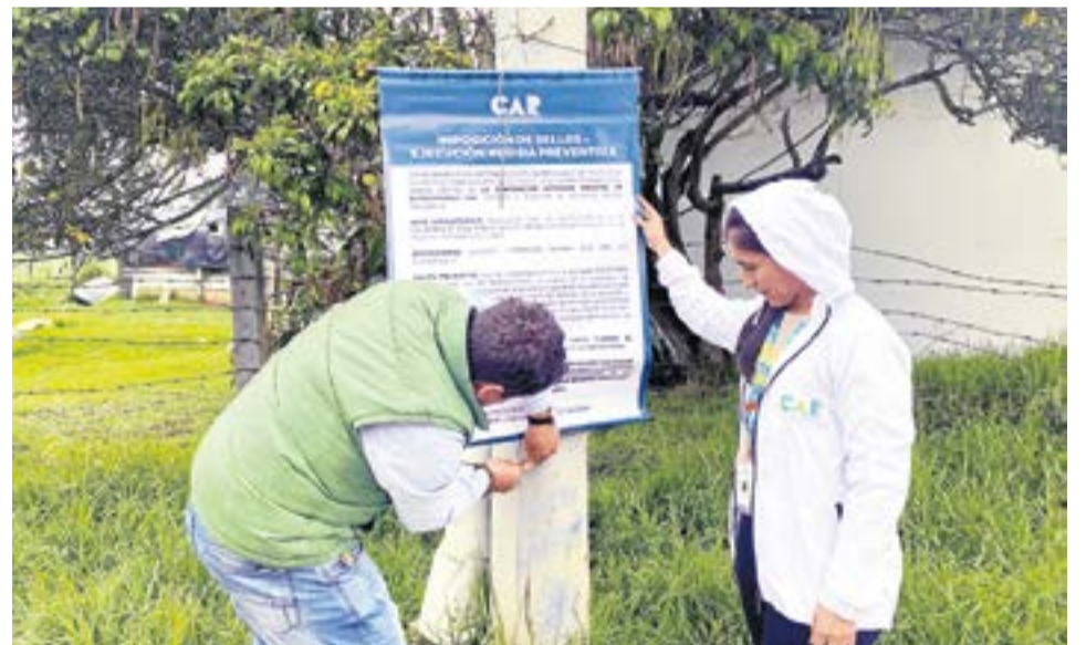
La medida suspende la actividad dado que el desarrollo de la misma afecta las condiciones físicas y químicas del suelo. CAR

“La medida tiene como objetivo suspender la actividad dado que el desarrollo de la misma afecta las condiciones físicas y químicas del suelo y podría generar procesos de degradación del recurso como la erosión y la compactación, además, es importante mencionar que el incumplimiento a la