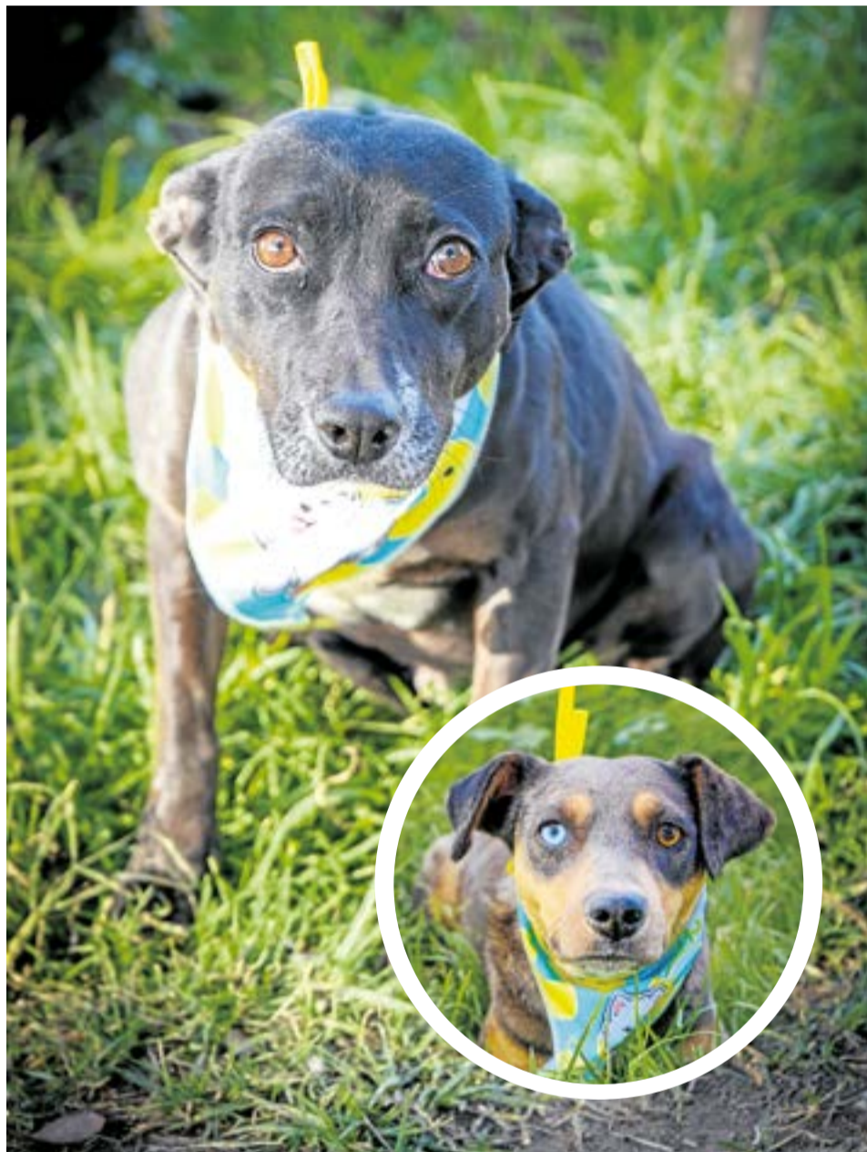
Negra tiene aproximadamente 3 años, presuntamente la violaban y es nerviosa con los humanos.

Susy fue abandonada cuando su familia se mudó, dejándola en la calle. Negrito fue recogido por la policía siendo un cachorro abandonado. Sasha fue rescatada cuando estaba en celo, perseguida por varios perros.