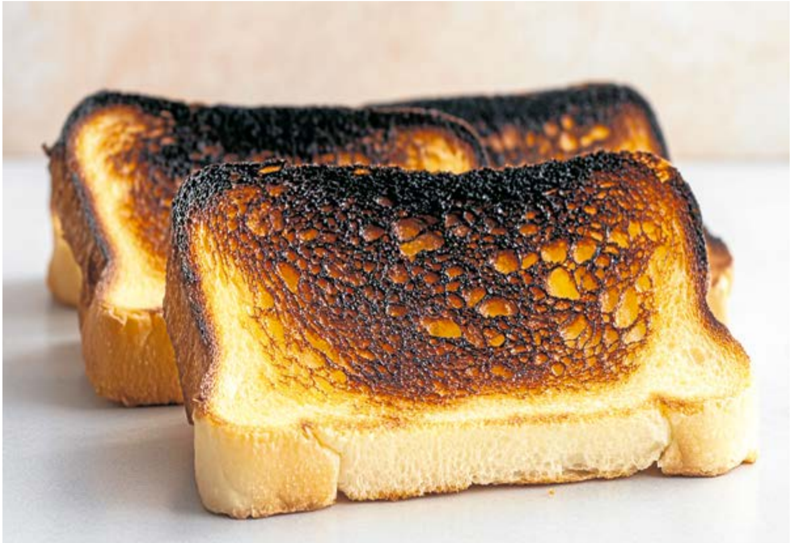
Los compuestos carcinógenos, la generación de acrilamida y la pérdida de nutrientes esenciales son algunos de los peligros asociados con esta práctica.

La presencia de compuestos químicos tóxicos como la acrilamida y la pérdida de nutrientes de estos alimentos son algunos de los efectos de la comida que se expone a una alta cocción.