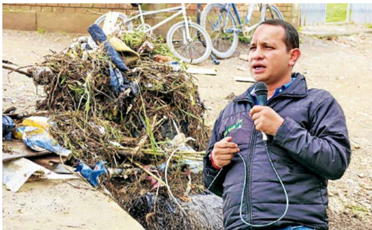
Las lluvias que azotaron a Ubaté pusieron a prueba la capacidad de respuesta y dejaron al descubierto una problemática que va más allá del clima: el mal manejo de residuos.

vención y mantenimiento se habían realizado antes de la emergencia, especialmente en puntos críticos como Villa Rosita?