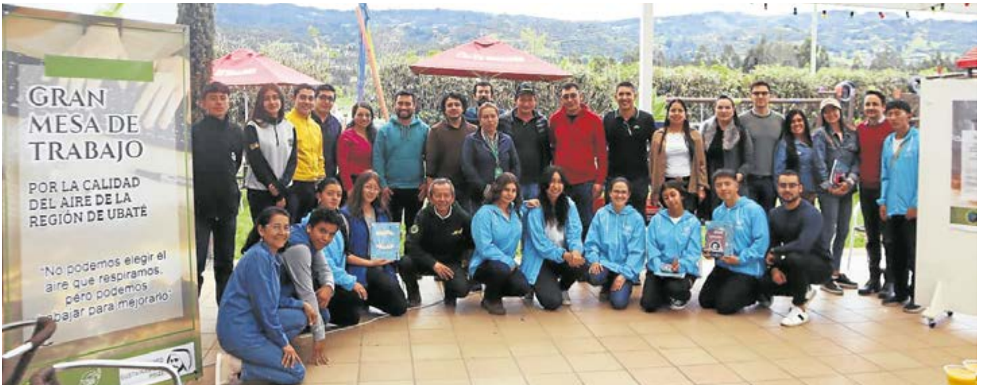
Con estaciones instaladas en ocho municipios, el ICAM celebra 35 años formando líderes ambientales a través de la Escuela del Aire Cuchavira, una iniciativa única en el país que convierte la educación rural en motor de ciencia, conciencia y transformación territorial.