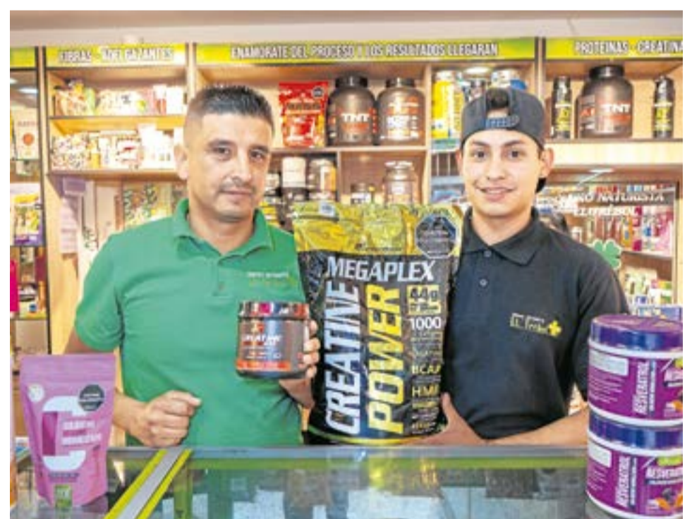
Para mayor información, los interesados pueden visitar los puntos de venta o comunicarse al número 311-5013899.

El Centro Naturista El Trébol sigue posicionándose como referente regional en productos naturales, con