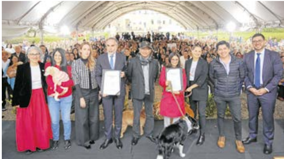
Ministerio de las TIC tiene la responsabilidad de investigar tecnologías que puedan sustituir a los perros en tareas de defensa. A.Part.

Esta ley actualizó el Estatuto Nacional de Protección de los Animales (Ley 84 de 1989) y reforzará las penas por maltrato animal. Desde 2016, en Colombia se han presentado más de 15.500 denuncias por maltrato, pero apenas el 1,4 % ha terminado en condenas.