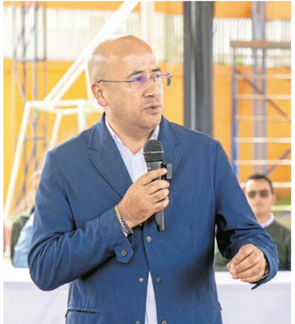
De acuerdo con el alcalde, el proceso se interrumpió por resoluciones que al parecer podrían incurrir en una "falsa motivación."

Los requisitos para aplicar se mantienen similares: los hogares deben vivir