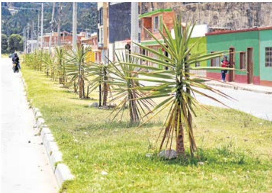
El director de Desarrollo Sustentable explicó que se busca "reducir la huella de carbono, mejorar el paisajismo. La Villa.

"El programa ha tenido un impacto visible en el paisaje urbano de Ubaté. Se han embellecido diversas zonas del municipio con la siembra de especies como pinos vela, eugenias y palmas, lo cual ha mejorado no solo el aspecto estético sino también la captura de dióxido de carbono (...)"