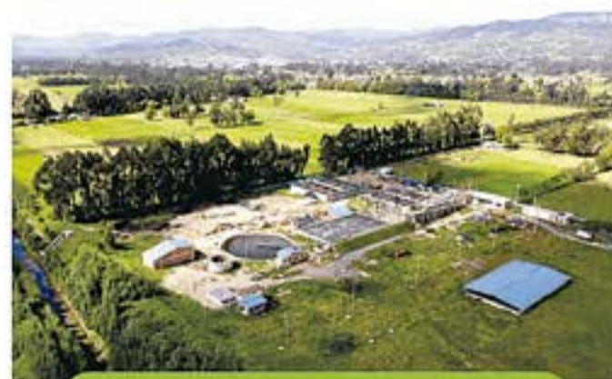
Fotografía de Referencia