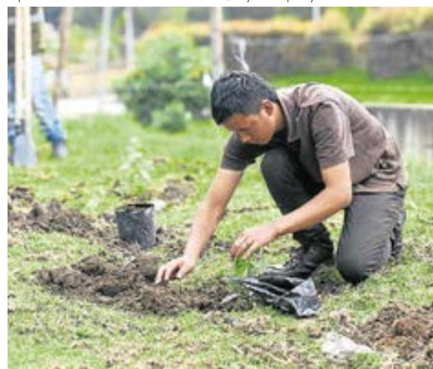
Se destacó la importancia de la modernización del vivero municipal.

bicar Ubaté S.A.S, Conducir, CDA Farallones de Sutatausa, Transportes Bricai S.A.S., Club Deportivo De Tiro Los Halcones, Tecnicoal Transportes Valbuena, Hospital El Salvador, Cootransvu y Flores Ubaté, entre otras, han apoyado con donaciones de insumos y el compromiso de mantener y cuidar las áreas intervenidas. "Esta colaboración ha sido fundamental, ya que el municipio no contaba con un presupuesto específico para el proyecto. Entre marzo y septiembre de 2024, se han sembrado 48 pinos vela, 400 eugenias, 32 palmas yuca y aproximada-