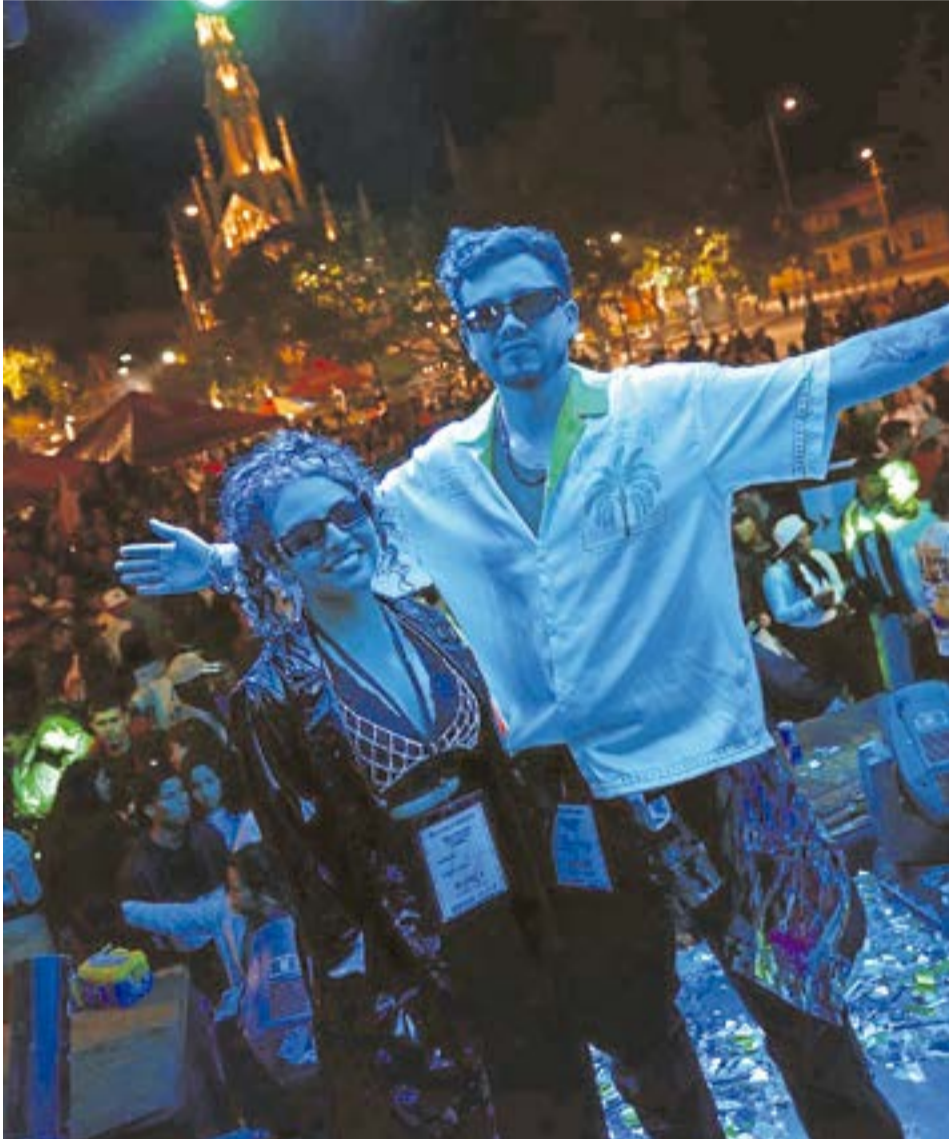
La entrada tiene un precio de $20.000 y puede adquirirse de manera virtual a través de Nequi o Daviplata: 313-413976. La Villa

año pasado, no solo por el calibre de los artistas, sino también por la infraestructura y la logística que han dispuesto para asegurar una experiencia de primer nivel. El evento se llevará a cabo en el Parque Principal de Ubaté, un espacio que será transformado para ofrecer un ambiente ideal donde la música y las luces se fusionarán para crear una atmósfera inolvidable.