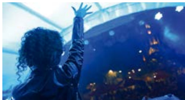
El evento se llevará a cabo el 28 de septiembre en el Parque Principal de Ubaté. A. Part.

Los organizadores del Energy Fest han prometido una edición que superará en gran medida la del año pasado, no solo por el calibre de los artistas, sino también por la infraestructura y la logística que han dispuesto para asegurar una experiencia de primer nivel.