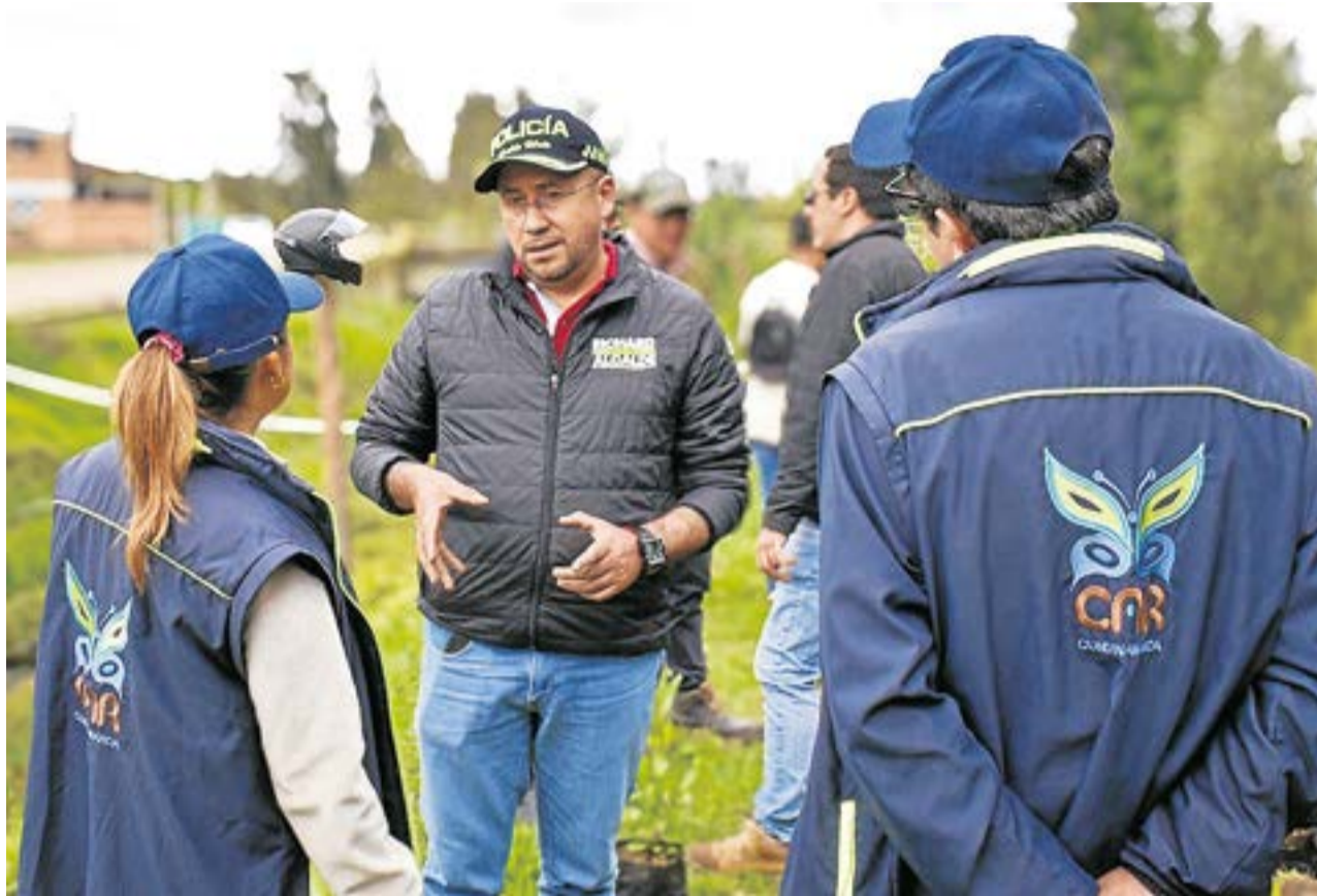
Uno de los aspectos más destacados del programa ha sido la activa colaboración del sector privado, fundamental debido a la falta de presupuesto inicial.

Uno de los factores clave para el éxito del programa ha sido la participación activa del sector privado. Empresas locales como Prefa-