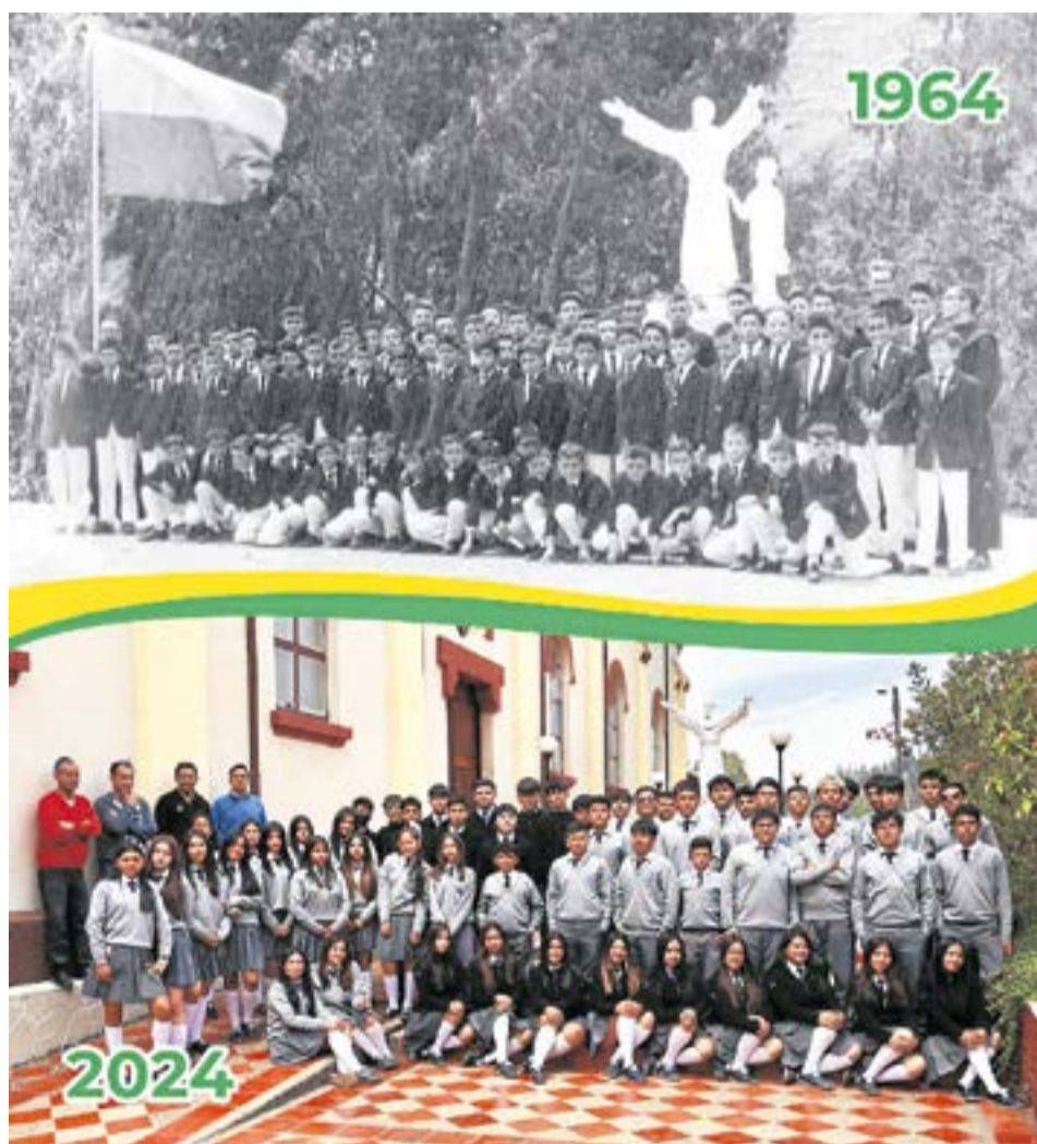
A lo largo de sus 60 años de historia, el colegio ha formado a numerosos profesionales que hoy son un orgullo para la institución.