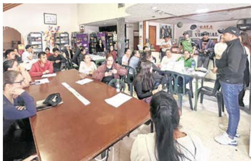
El apoyo financiero cubre una parte del costo del transporte para los que se trasladan a Ubaté, Chía, Cajicá, Zipaquirá o Bogotá.