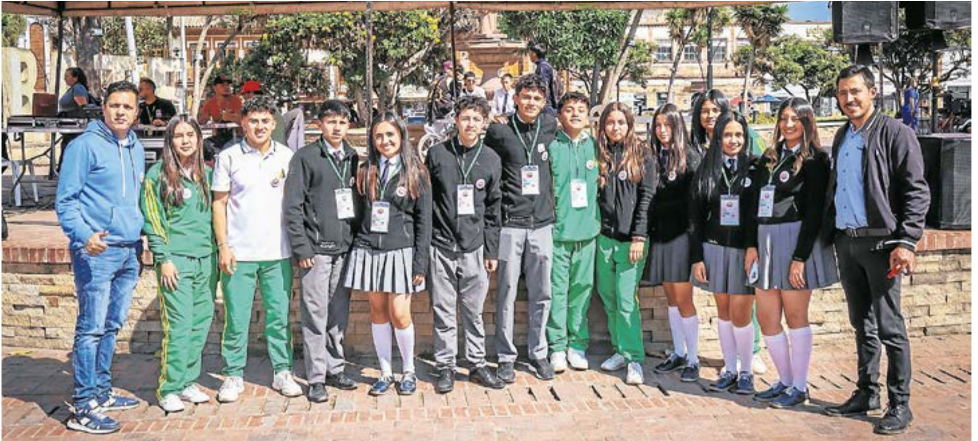
El deporte es otro pilar esencial. La institución busca proporcionar a los estudiantes espacios adecuados para poner en práctica sus habilidades físicas, incentivando su participación en escuelas de formación deportiva tanto en Ubaté como en Cundinamarca. A.Part.