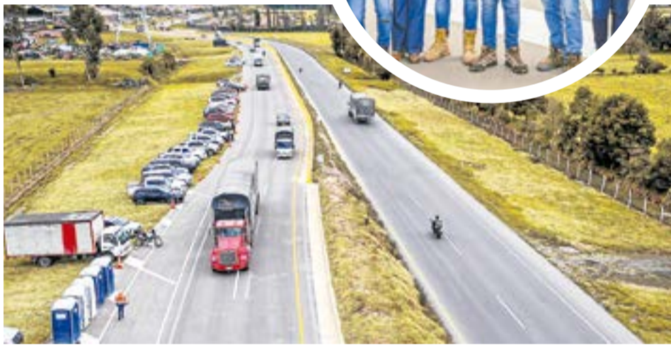
De acuerdo con el Invías, la variante beneficia a más de 1,5 millones de habitantes de la provincia Sabana Centro en Cundinamarca.

Después de varios años, y faltando por terminar la glorieta de Ave, Invías dio apertura a la variante Zipaquirá. El acto de apertura estuvo acompañado por el gobernador Jorge Rey.