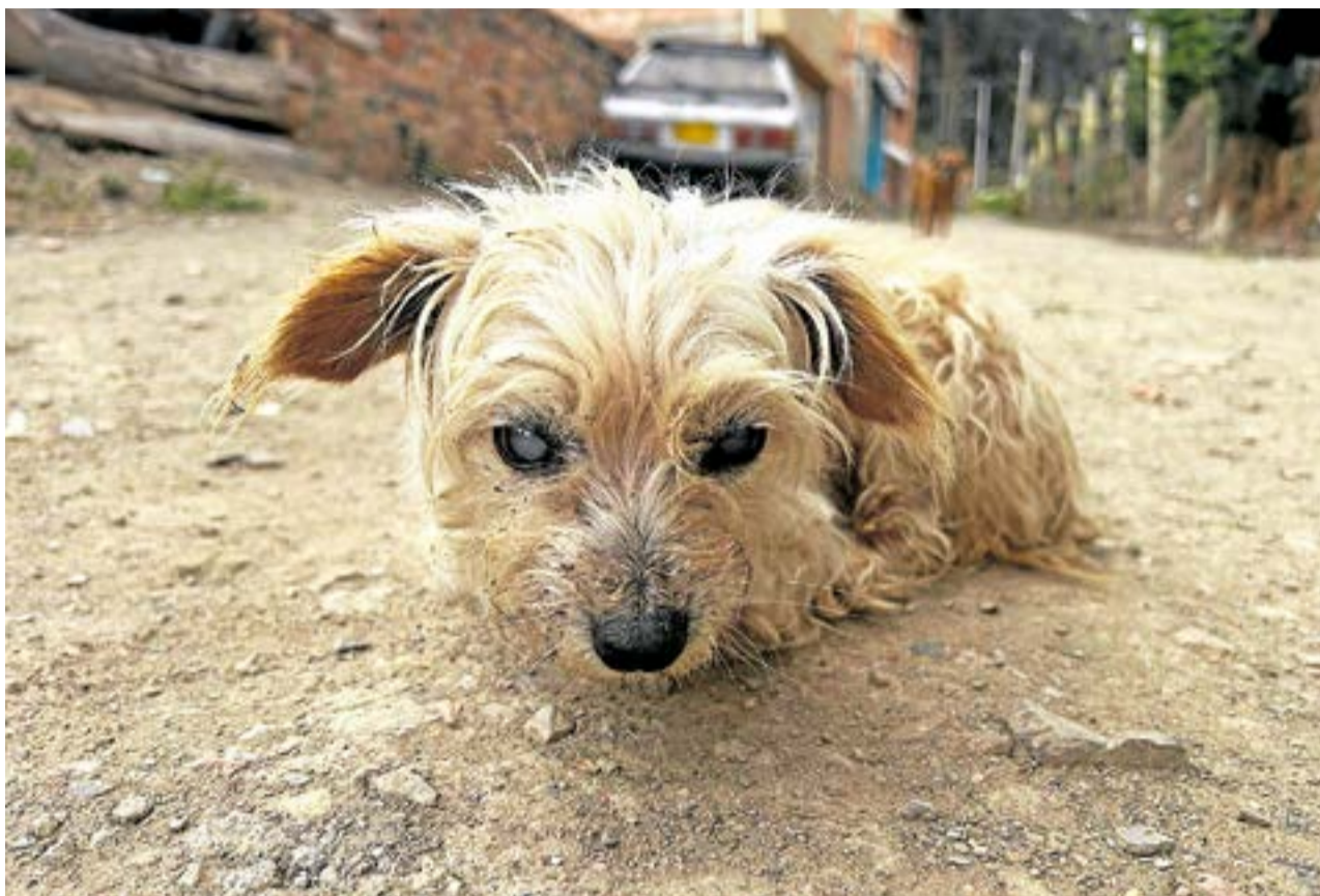
La perrita ciega fue abandonada en el barrio Calderitas; era incapaz de caminar debido al dolor en sus patas; se encontraba sola y en mal estado.

Las zonas críticas identificadas en Ubaté como lugares de abandono son la plaza de mercado, el Parque Ricaurte, la salida a Carmen de Carupa y la Perrera. Estos lugares se han convertido en escenarios donde algunos ciudadanos dejan costales repletos de animales.