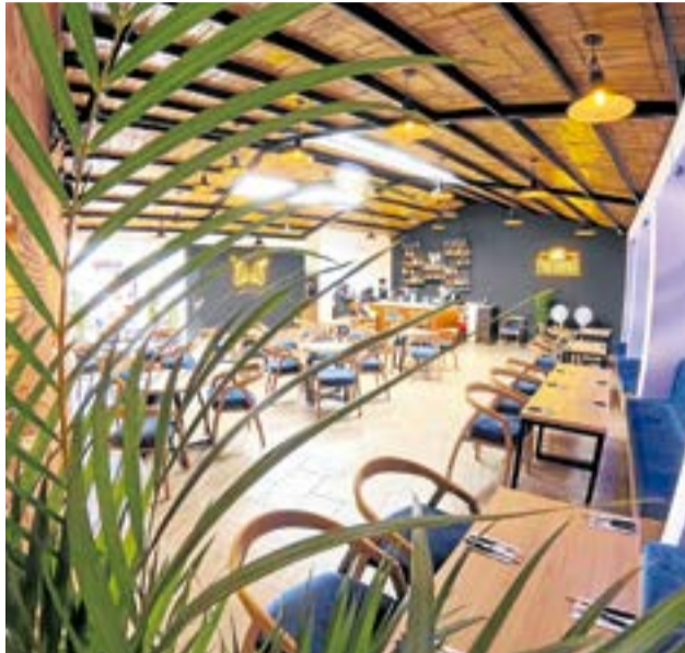
La oferta incluye la Picada Wings, ideal para grupos de 4 o 6 personas, que mezcla alitas, trozos de costillas, chorizo ahumado, papa criolla, mazorca y carne.

Este gastrobar ha sido pensado para ofrecer una experiencia que combina lo mejor de la comida rápida y la parrilla, en un ambiente acogedor y familiar.