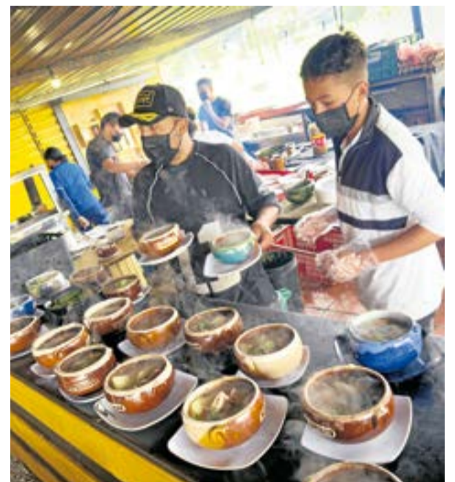
Estos puntos, ubicados en los kilómetros 5 y 3 de la vía a Chiquinquirá, ofrecen a propios como a turistas una experiencia culinaria basada en la cocina típica colombiana. Una década de trabajo gastronómico en la región.

Los restaurantes han recibido turistas de todas partes del mundo, incluyendo visitantes de Asia y celebridades locales como los integrantes de Los Doctores de la Carranga, el Dr Krapula y el actor Fabián Ríos. "Es un orgullo para nosotros aten-