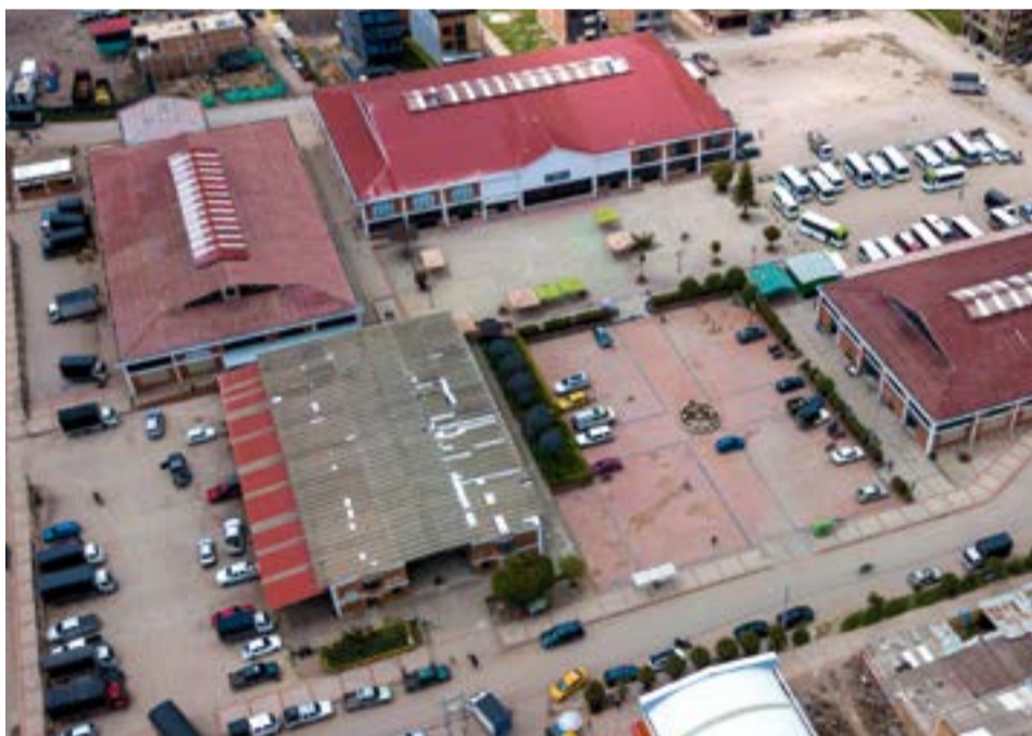
El Centro Comercial Plaza de Mercado de Ubaté alberga en todas sus bodegas a una serie de pequeños comercios. A. Particular:

“Estos comercios no solo ofrecen productos de calidad, sino que cada uno tiene detrás una historia de esfuerzo y dedicación que merece ser conocida. Invito a todos a que se acerquen, los visiten y encuentren lo que necesitan en este espacio que es para todos (...).”