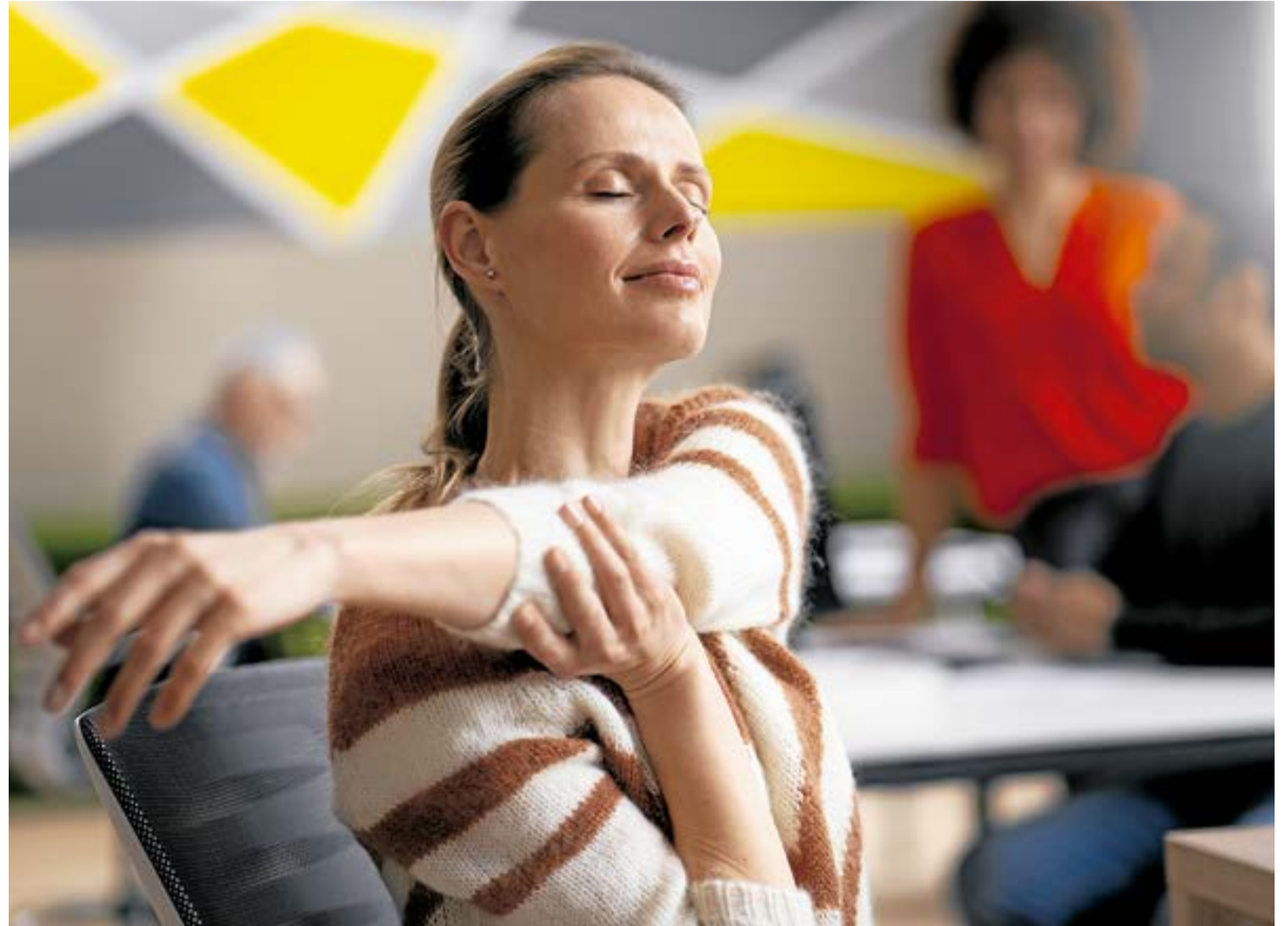
Recuerde que durante la pausa activa la respiración debe ser lo más profunda, lenta y rítmica posible. Realice ejercicios de movilización en la articulación antes del estiramiento.

Las pausas activas son breves descansos durante la jornada laboral que sirven para recuperar energía, mejorar el desempeño y efi-