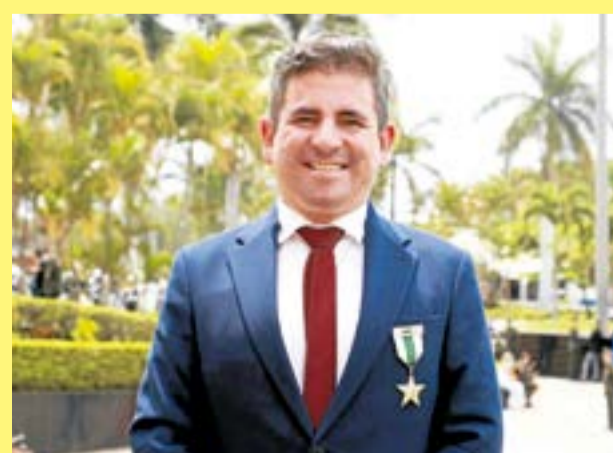
El exmandatario no se ha pronunciado hasta el cierre de esta edición.

Finalmente, la Procuraduría General de la Nación adujo que con su supuesta actuación el exalcalde contravino el principio de responsabilidad que estaba obligado a cumplir por su rol, con lo que materializó una falta disciplinaria calificada provisionalmente como gravísima a título de dolo.