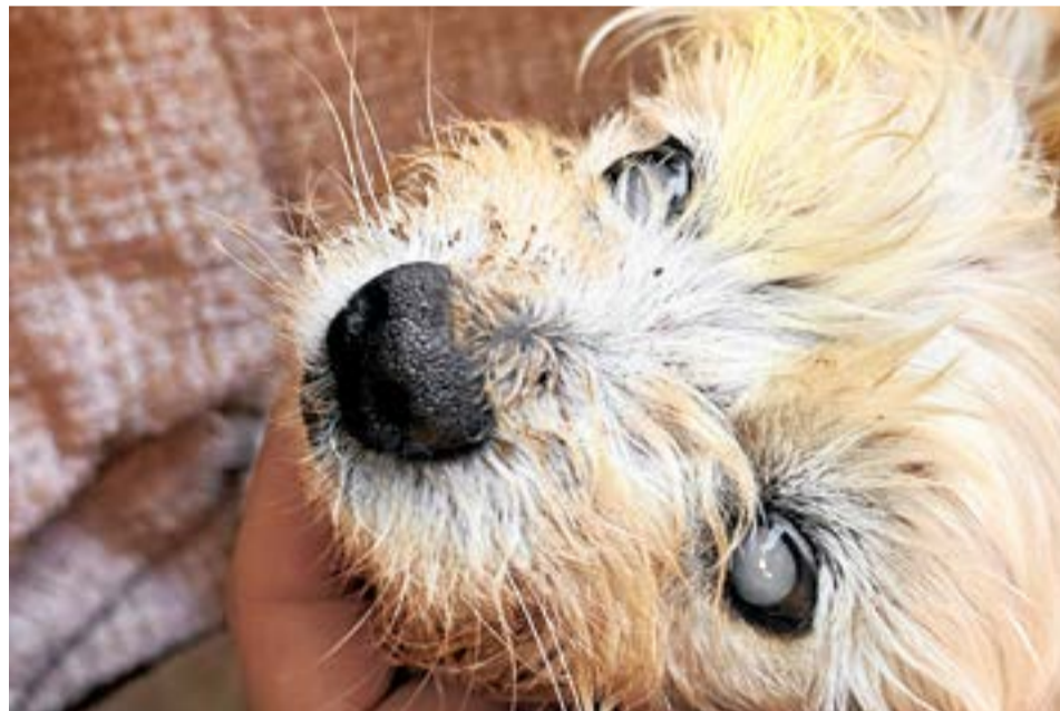
Este nuevo abandono de perros en Ubaté, es otro reflejo de una problemática persistente en el municipio.