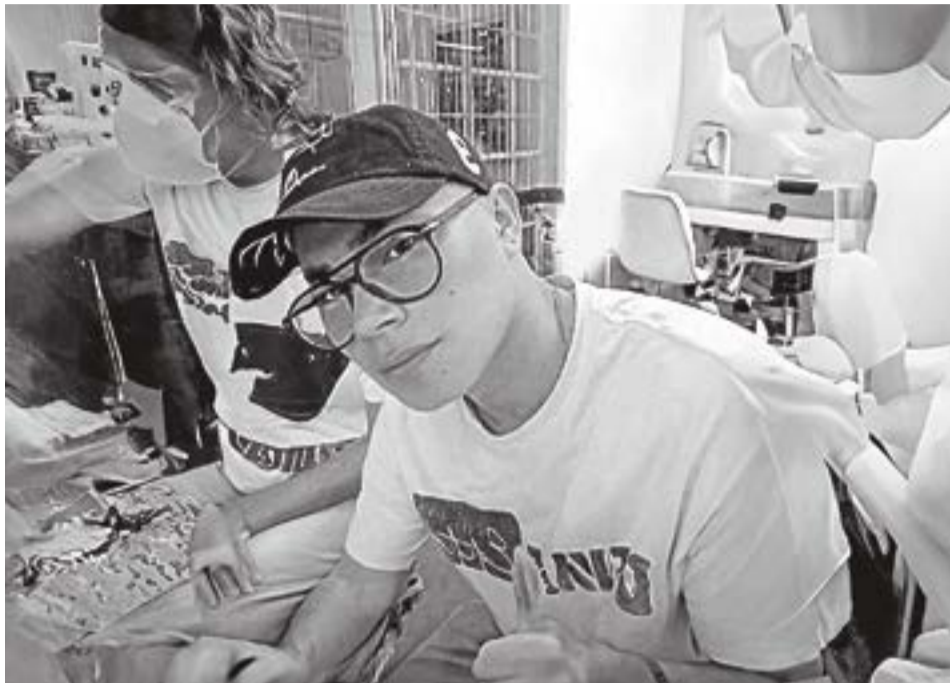
Las personas interesadas en ayudar pueden hacer sus donaciones a través de Nequi al número 320-2681632.