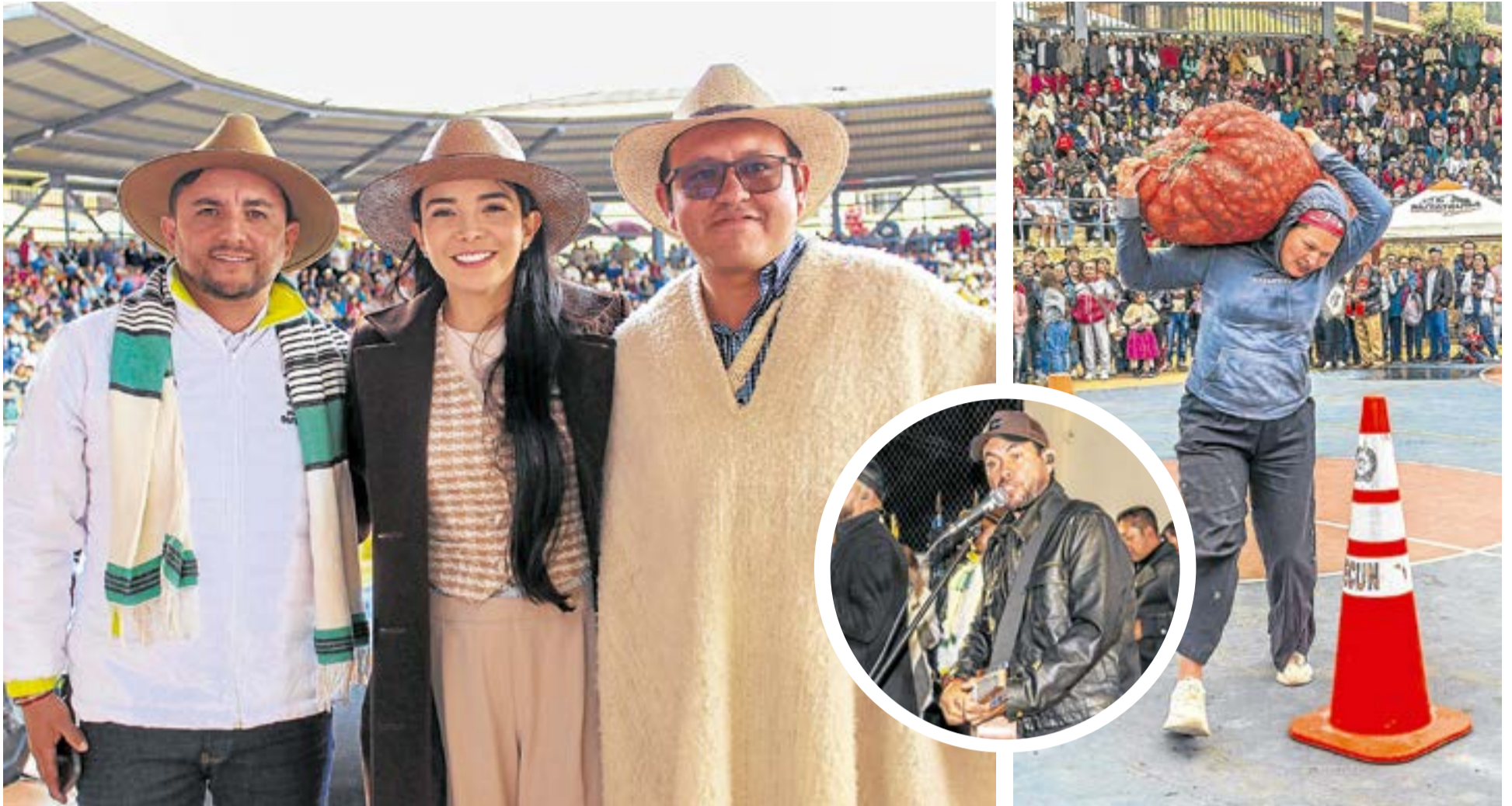
El alcalde Jhonatan Ojeda destacó la importancia de esta festividad, señalando el papel fundamental de las Juntas de Acción Comunal en la organización del evento. «Hace muchos años no veía al pueblo tan unido, y eso para mí es muy grato».