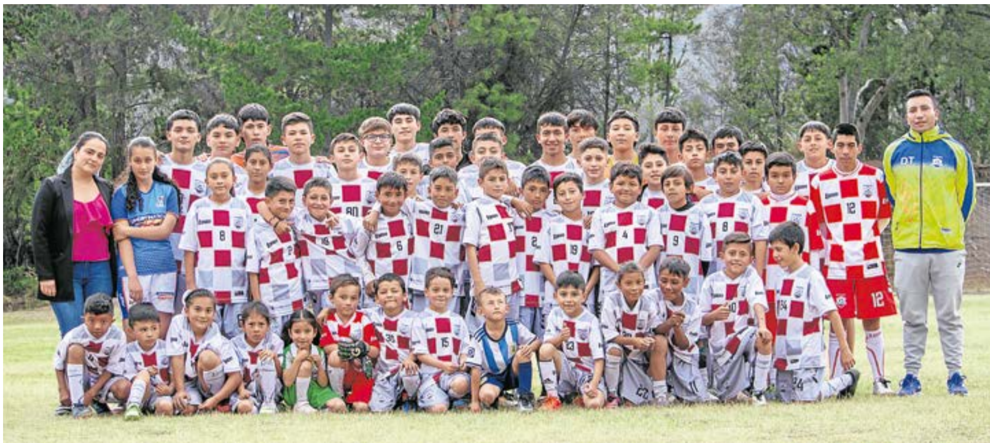
Los entrenamientos se realizan los martes y jueves de 2:00 a 6:00 p.m. y los sábados de 8:00 a 12:00 p.m. Cada sesión se trabaja con un enfoque específico desde el desarrollo de habilidades motrices hasta la táctica y la técnica en categorías más avanzadas. La Villa-