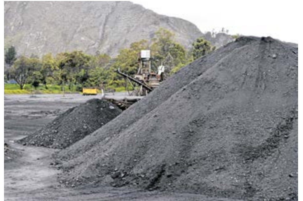
A la fecha, Israel representa el 1% de las exportaciones que hace Colombia al mundo, según las cifras del Ministerio de Comercio.

Por otro lado, entre los productos más exportados están el carbón, el café sin tostar, las flores, las piezas para aviones y helicópteros,