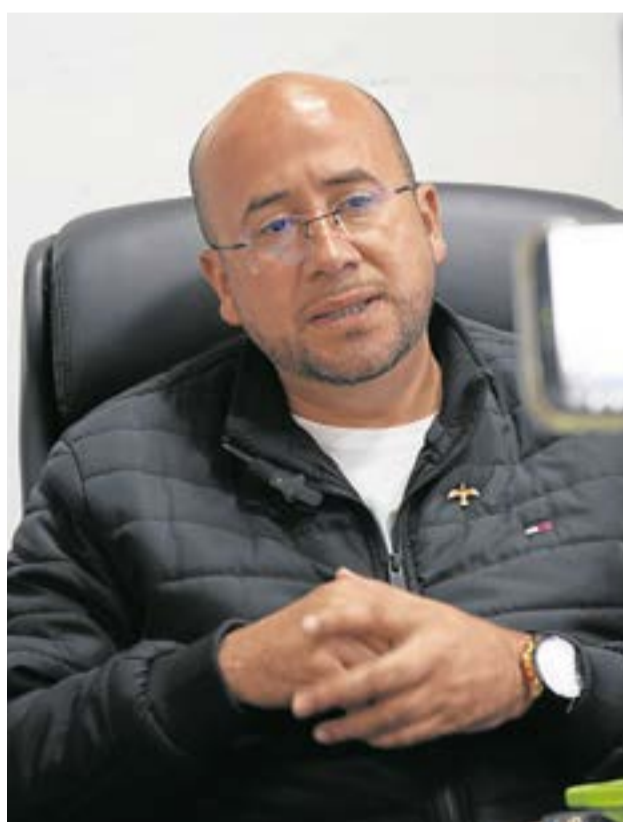
El alcalde de Ubaté Richard Bernal explicó la importancia de esta convocatoria. La Villa.

cumplan con los requisitos pueden llevar la documentación a la oficina del despacho de la Alcaldía, ubicada en la Casa del Ayuntamiento. El plazo para la entrega de documentos va desde el 21 de julio hasta el 10 de septiembre de 2024.