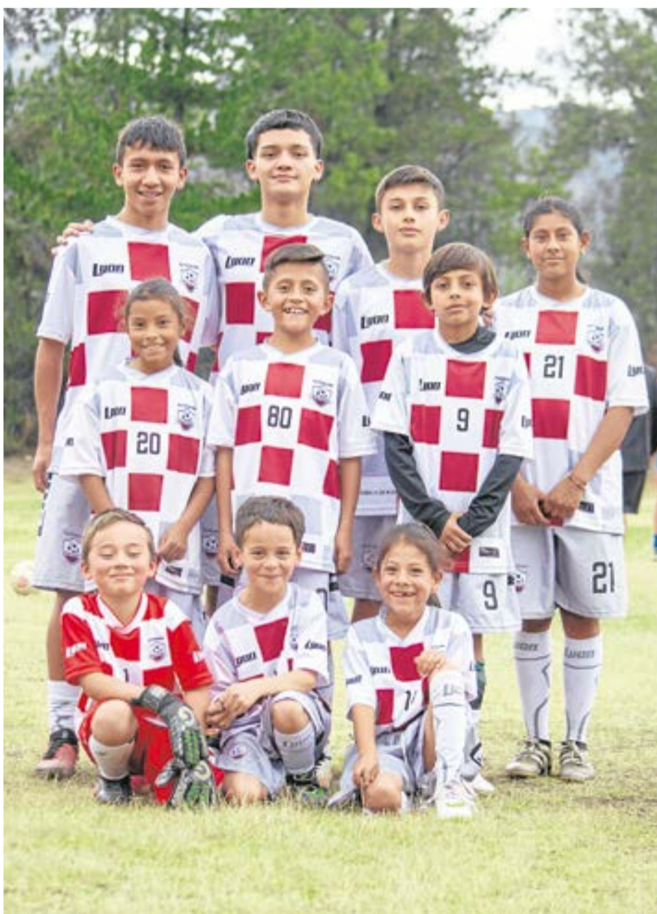
Además del fútbol, Sutatausa ofrece una amplia gama de actividades deportivas gracias a las 12 escuelas de formación. La Villa-

La formación en la Escuela de Fútbol de Sutatausa no solo se centra en el aspecto deportivo. Los niños y jóvenes reciben una educación integral que incluye valores, trabajo en equipo, y el desarrollo de habilidades interpersonales.