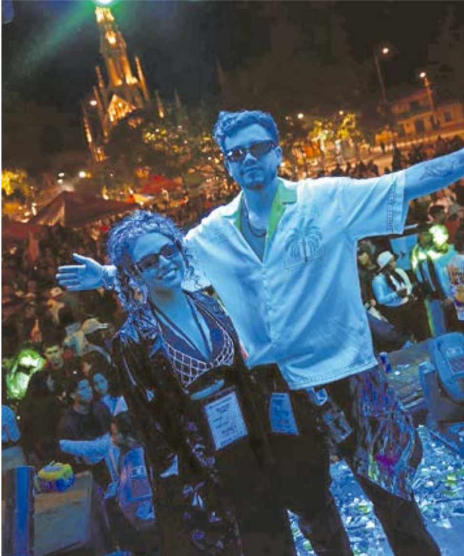
La entrada tiene un precio en preventa de 10.000 pesos hasta el 30 de agosto y puede adquirirse de manera virtual. A. Particular-

dispuesto para asegurar una experiencia de primer nivel. El evento se llevará a cabo en el Parque Principal de Ubaté, un espacio que será transformado para ofrecer un ambiente ideal donde la música y las luces se fusionarán para crear una atmósfera inolvidable.