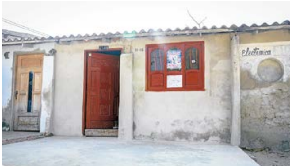
La convocatoria está abierta para todos los propietarios de viviendas urbanas y rurales que cumplan con los requisitos. La Villa.

Requisitos: coordenadas exactas de la vivienda, fotocopia de la cédula de ciudadanía, certificado de libertad y tradición con una antigüedad no mayor a 30 días, ficha del Sisbén actualizada, perteneciente a los niveles del A1 al C1, con una vigencia no mayor a 30 días, ser propietario de la vivienda.