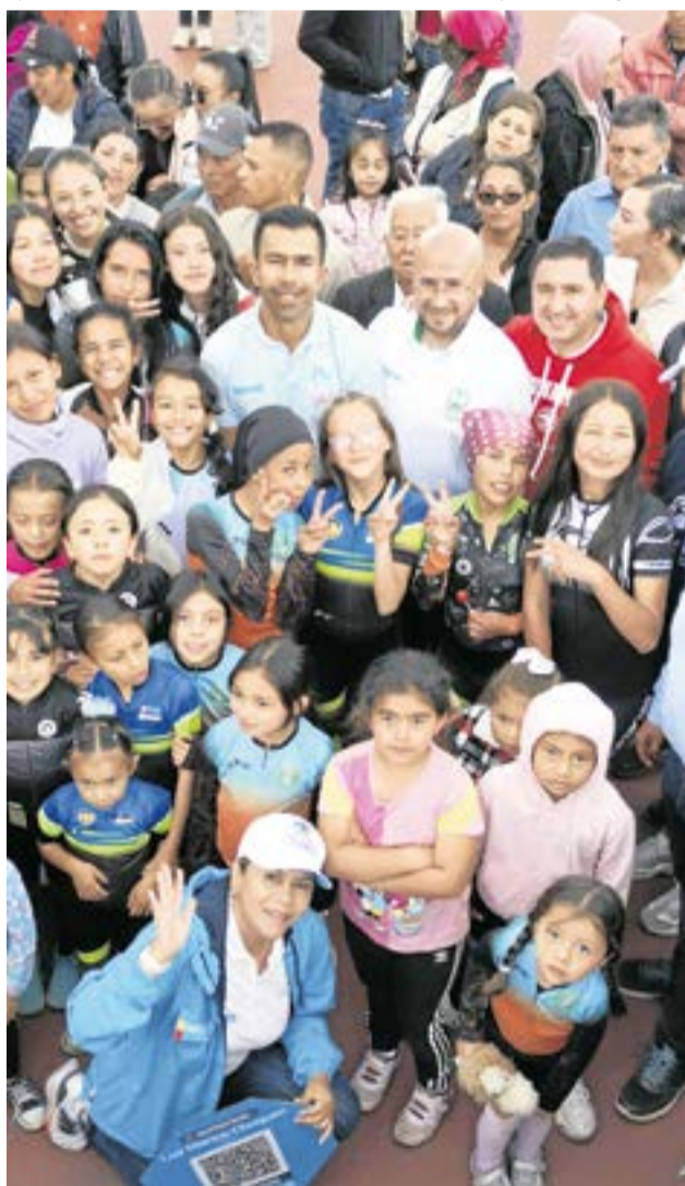
Segunda etapa del patinódromo y un nuevo hospital, algunos de sus compromisos.

La segunda parada fue en la calle 5, donde el gobernador anunció la pavimentación de varias vías, incluyendo la carrera 3, la perimetral de la Plaza de Mercado, la calle 5 y la vía al Mega colegio. Para estos