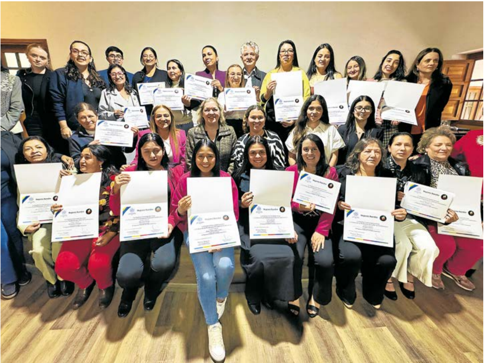
Esta iniciativa, impulsada por la Universidad Javeriana en colaboración con Fedecundi, la Fundación Milpa y Coquecol, marcó el cierre de dos años de formación intensiva. El programa no solo se enfocó en aspectos técnicos, sino que también de habilidades psicosociales.