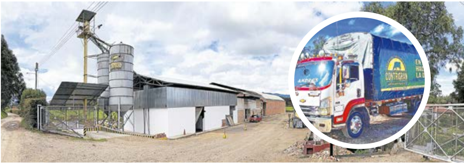
Contrigran es una empresa de origen ubatense dedicada a la importación, exportación, producción y comercialización de alimentos balanceados (concentrados) para ganadería, porcicultura, avicultura y mascotas.