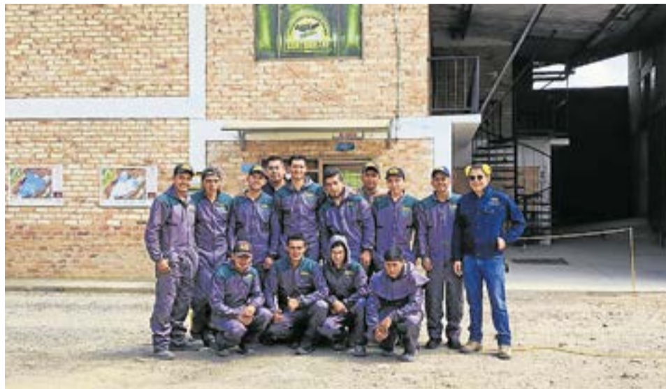
Imagen de los trabajadores del primer turno de producción.

Brinda servicios técnicos especializados para visitas a las fincas, respaldados por la experticia nutricional de la marca Premex y un equipo altamente capacitado en nutrición animal.