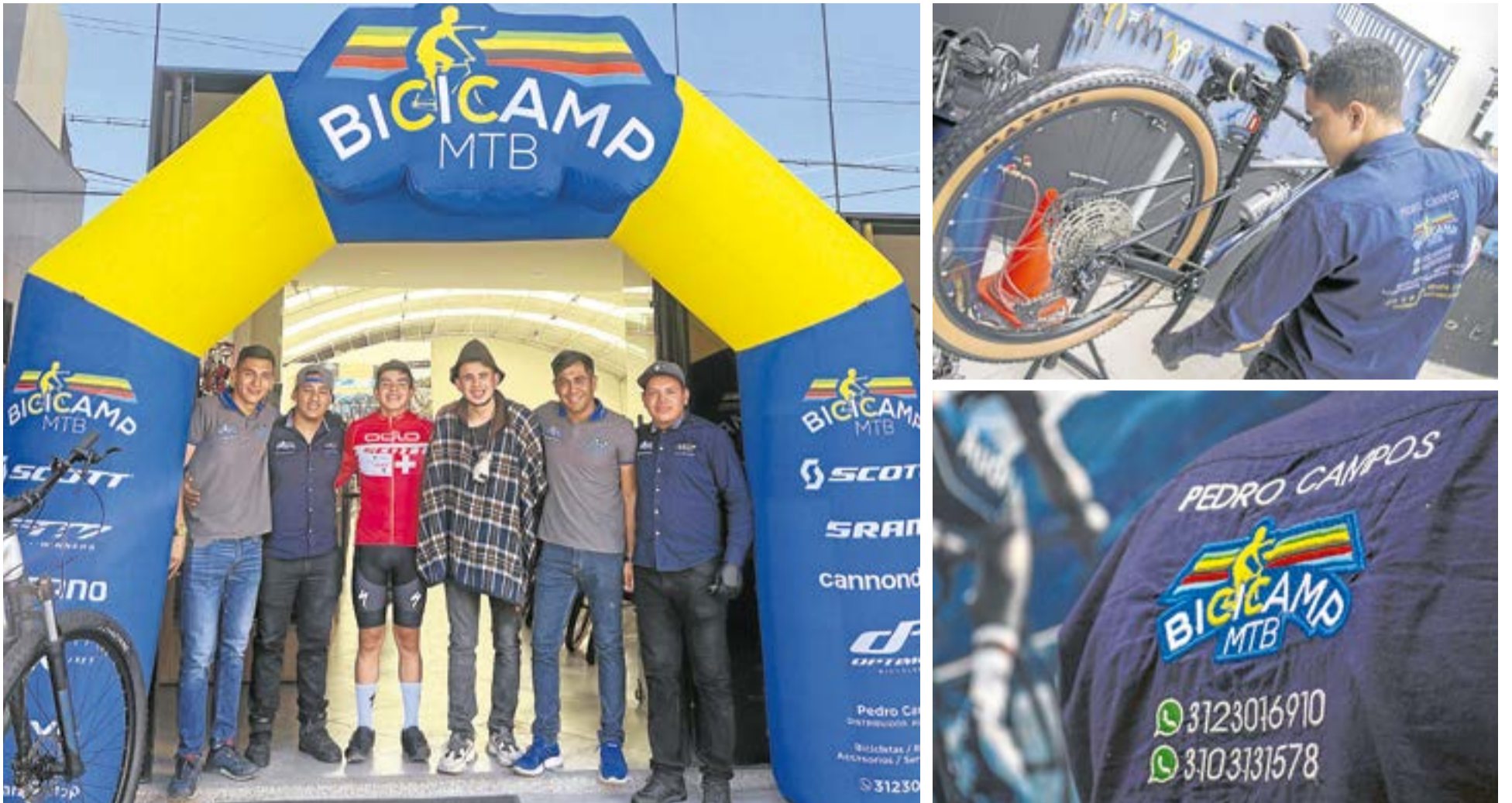
Además, el establecimiento brinda servicios técnicos especializados que van desde ajustes básicos hasta reparaciones complejas para todo tipo de bicicletas. Se encuentran ubicados en la carrera 5 No 4-57 en Ubaté, Cundinamarca.