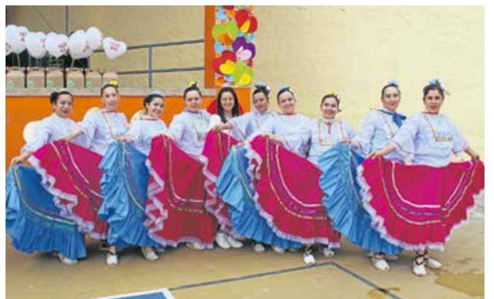
El evento culminó con la presentación del artista de «Yo me llamo Juan Gabriel».

El evento culminó con la presentación del artista de "Yo me llamo Juan Gabriel", quien se encargó de cerrar la jornada con broche de oro, deleitando a las madres asistentes en todo el espectáculo.