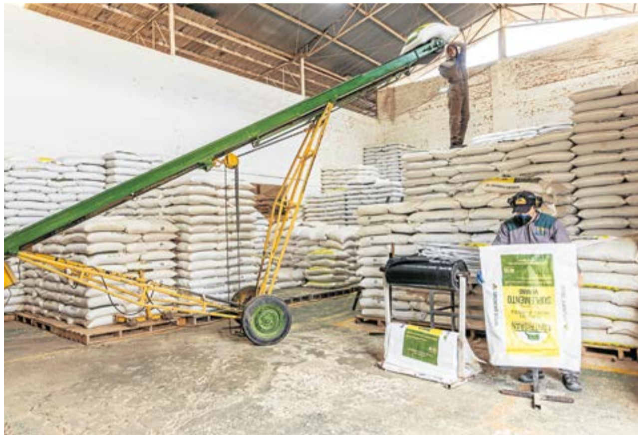
Contrigran fue impulsada por la necesidad de proporcionar al sector lechero productos específicos que cumplieran con los exigentes requerimientos nutricionales. A. Particular

Sobre su origen, señalan que la empresa Contrigran fue impulsada por la necesidad de proporcionar al sector lechero productos específicos que cumplan con los requerimientos nutricionales de varias especies