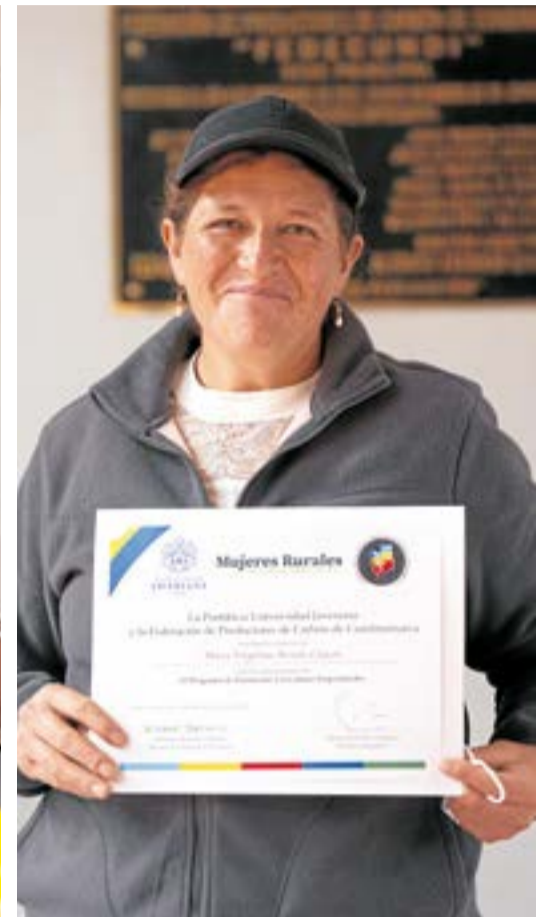
El programa no solo se enfocó en aspectos técnicos, sino que también abordó el fortalecimiento de habilidades psicosociales y gerenciales, permitiendo a las mujeres creer en sus capacidades.