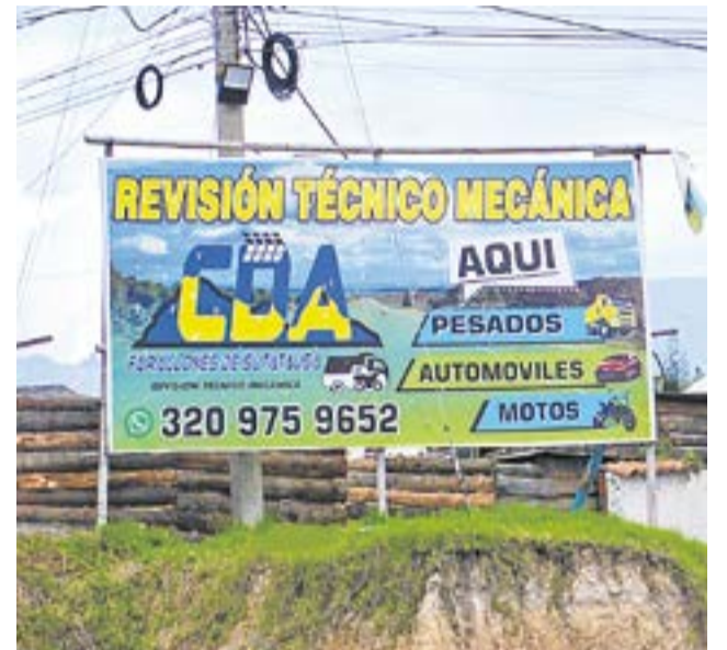
Ubicado en el kilómetro 3 de la vía nacional Sutatausa - Ubaté, el CDA abrió sus puertas para ofrecer el servicio de revisiones tecnomecánicas y de emisiones de gases a vehículos livianos, motocicletas 4 tiempos y vehículos pesados públicos y particulares. La Villa-