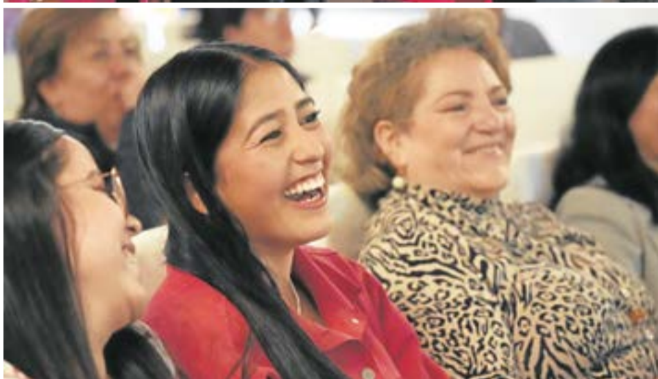
El programa, no solo empoderó a las mujeres, sino que también sembró las semillas para un futuro de mayor diversificación.

La experiencia fue súper, porque aprendimos mucho, incluso de manera virtual cuando no podía asistir en persona".