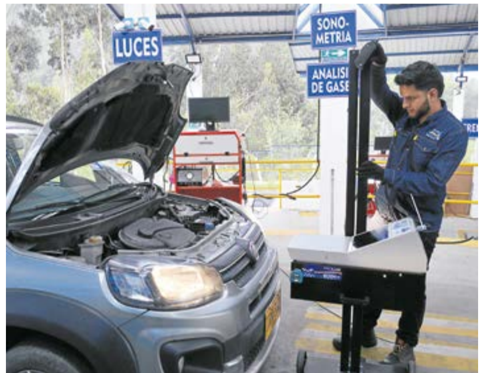
El CDA se dedica a realizar revisiones tecnomecánicas y de emisiones de gases contaminantes a todo tipo de vehículos. La Villa-

Sobre los servicios, el CDA se dedica a realizar revisiones técnico mecánicas y de emisiones de gases contaminantes a vehículos livianos, motocicletas 4 tiempos y vehículos pesados públicos y particulares.