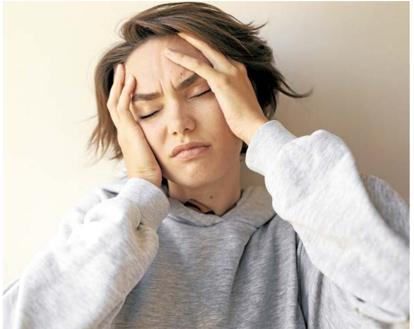
Para varios profesionales, no es necesario tener un diagnóstico grave para pedir ayuda. "Muchas veces no sabemos identificar qué nos sucede, pero sentimos que algo no va bien".

Es por ello que se advierte que los profesionales de la psicología ayudan a todo tipo de personas a trabajar cualquier problema de la salud mental y aseguran