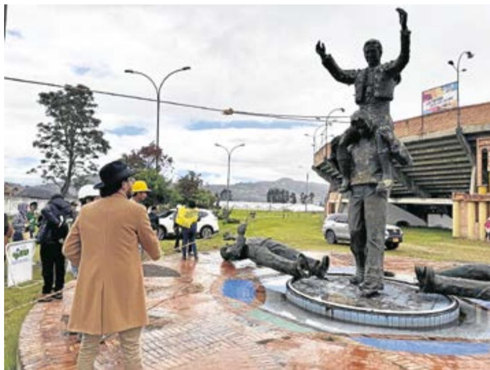
Hernández mencionó que la idea es transformar todas las plazas de toros del país para fomentar economías rurales y populares.

Como acto simbólico se hizo el retiro del monumento del torero Rincón, con el mensaje de llevar este homenaje a un centro de conservación de la memoria histórica de la tauromaquia en Colombia.