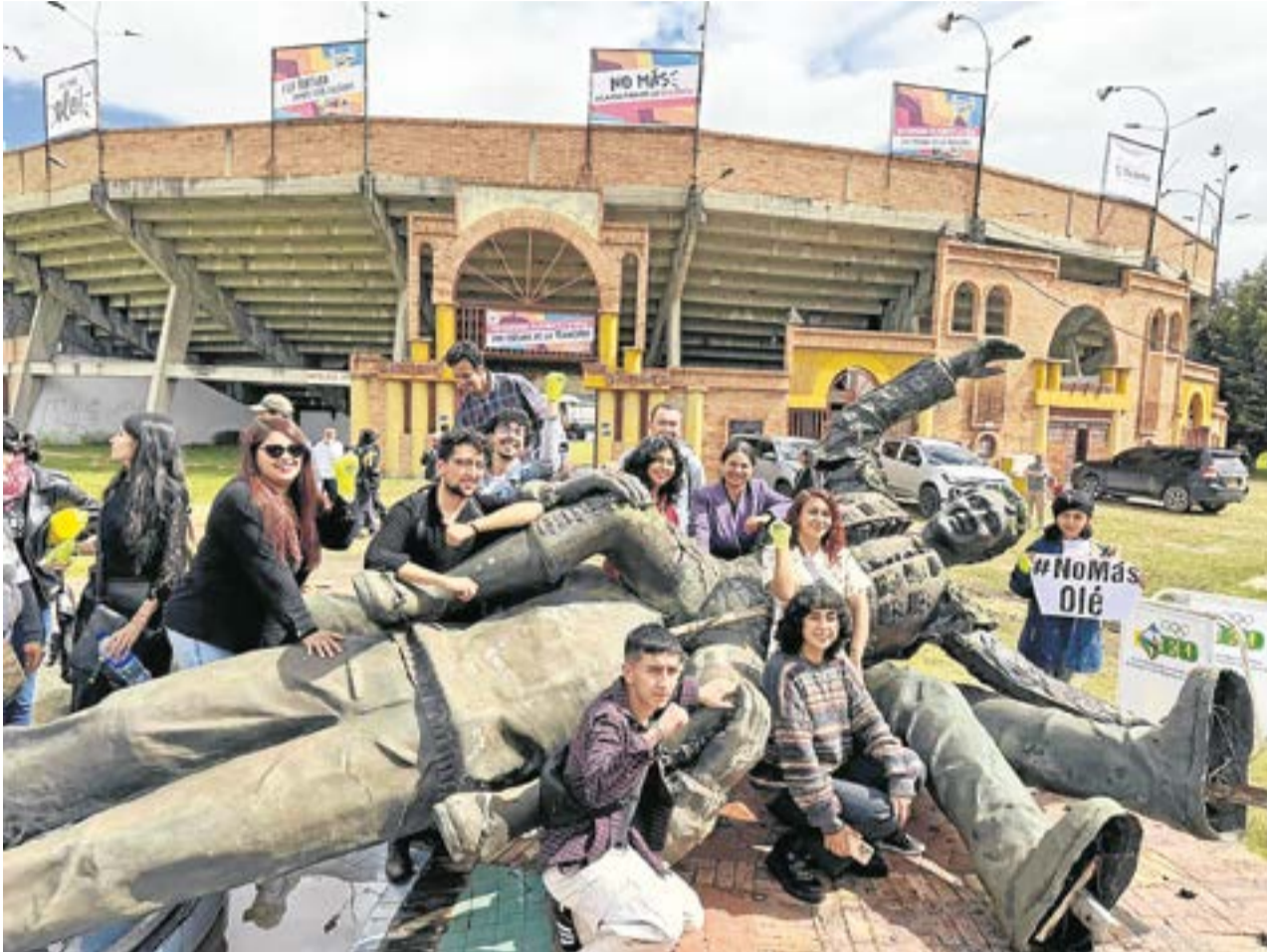
La medida de reconvertir plazas de toros busca promover espacios más inclusivos y sustentables, alejándose de prácticas vistas como crueles hacia los animales. A. Particular-