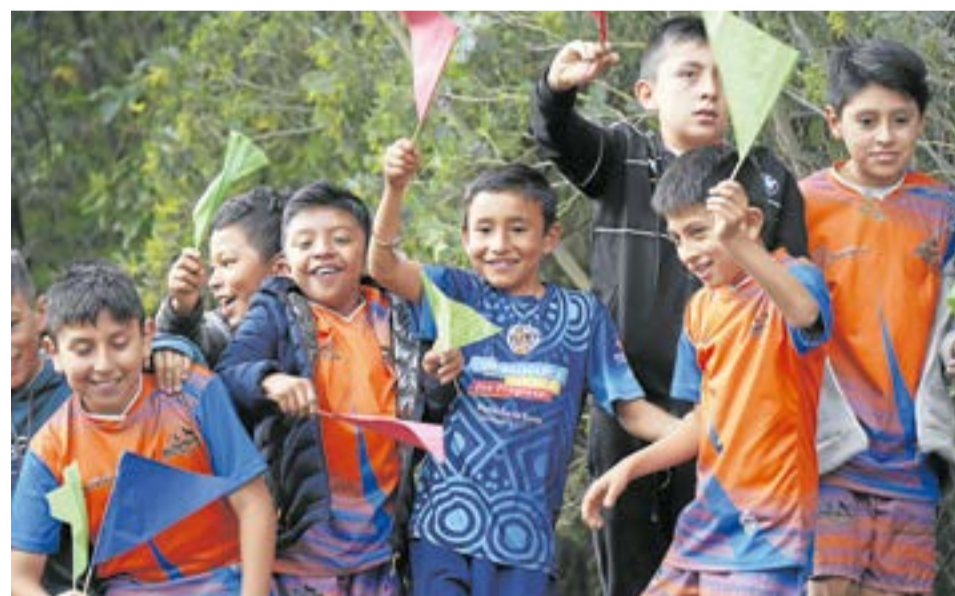
El gobernador de Cundinamarca, Jorge Emilio Rey Ángel, fue recibido por la comunidad en medio de entusiasmo.

Además del nuevo colegio, el gobernador anunció otros compromisos importantes para el municipio: desarrollo de un plan maestro de alcantarillado para Sutatausa, la entrega de una ambulancia 4x4 que pueda acceder a todo el territorio,