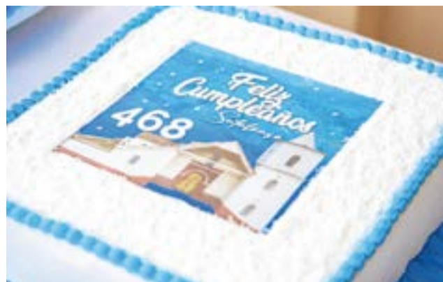
El Desfile Conmemorativo por los 468 años de fundación de Sutatausa fue un evento lleno de historia, color y orgullo cívico. Desde tempranas horas, las calles se vistieron de fiesta para recibir a los participantes y a la comunidad que se congregó. La Villa-