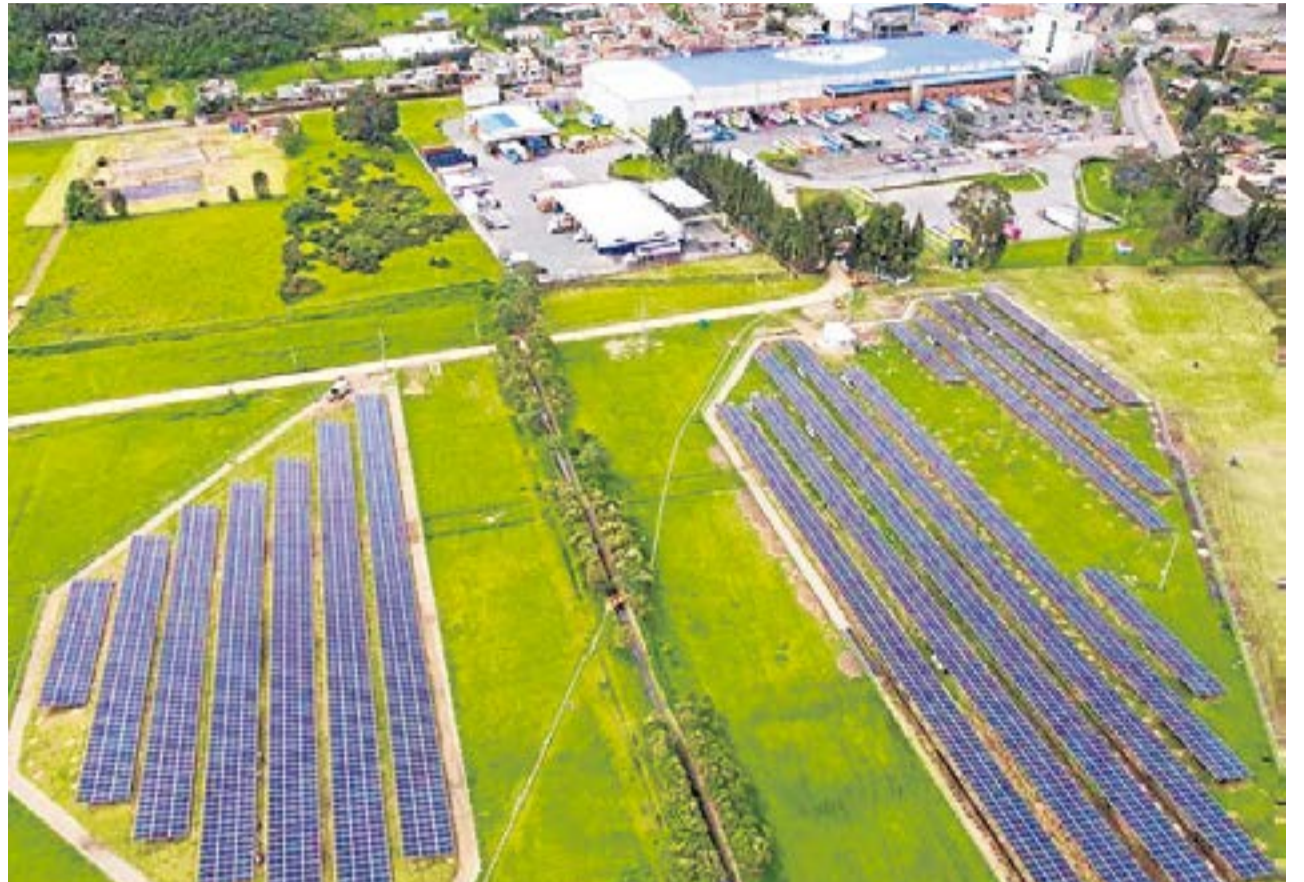
Como parte de sus metas por seguir apostándole a la transición energética, la compañía prevé expandir su generación de electricidad a partir de energía solar. Suministrada-

De acuerdo con la compañía, la granja solar tiene una capacidad de producción de 2,5 megavatios pico (MVp), suficiente para alimentar más de 190.000 bombillos comunes.