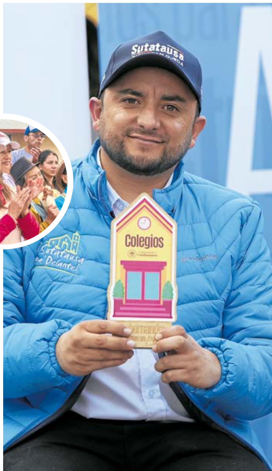
El Gobernador de Cundinamarca, Jorge Rey, llegó al municipio de Sutatausa en el marco de su gira "Me comprometo a", La Villa-

Jorge Rey recorrió diferentes puntos acompañado del alcalde, Jhonatan Ojeda, iniciando en el predio donde se ejecutará la construcción de la institución educativa de Sutatausa.