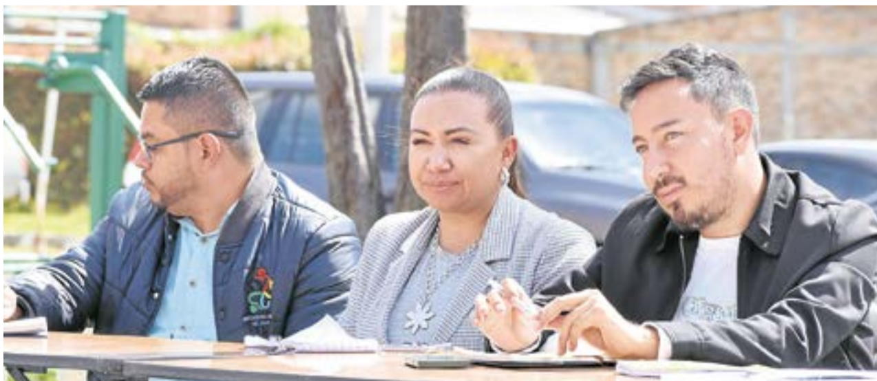
Una de las medidas más inmediatas adoptadas tras la reunión fue la implementación de un toque de queda para los menores de edad, desde el 23 de enero al 23 de abril.

garantizar una presencia constante y efectiva.