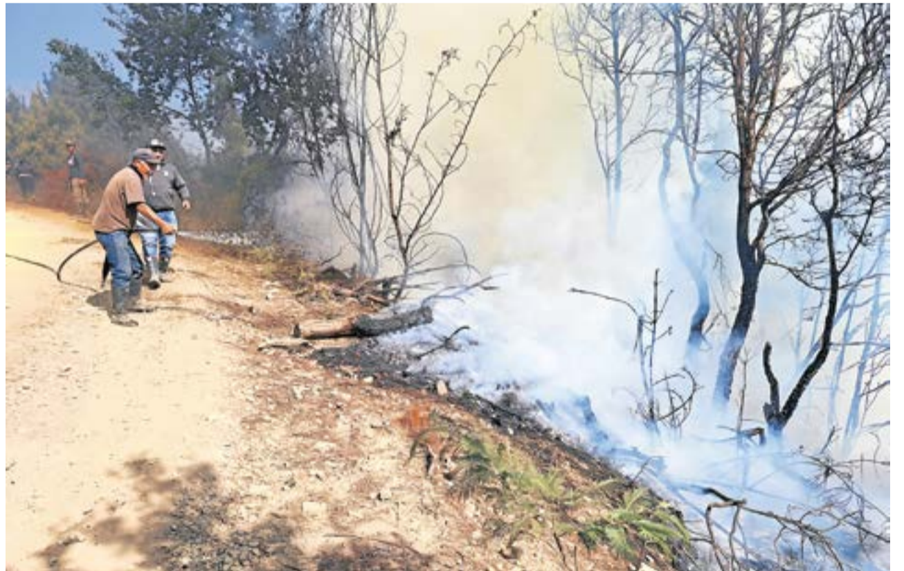
La gravedad de la situación ha llevado al gobernador de Cundinamarca declarar la calamidad pública. Mientras que el Gobierno Nacional declaró una situación de desastre natural

La situación por desabastecimiento de agua en Cucunubá los llevó a tomar medidas como la alerta amarilla para hacer frente a la escasez del vital líquido. Mientras tanto, en Fúquene no paran los incendios forestales.