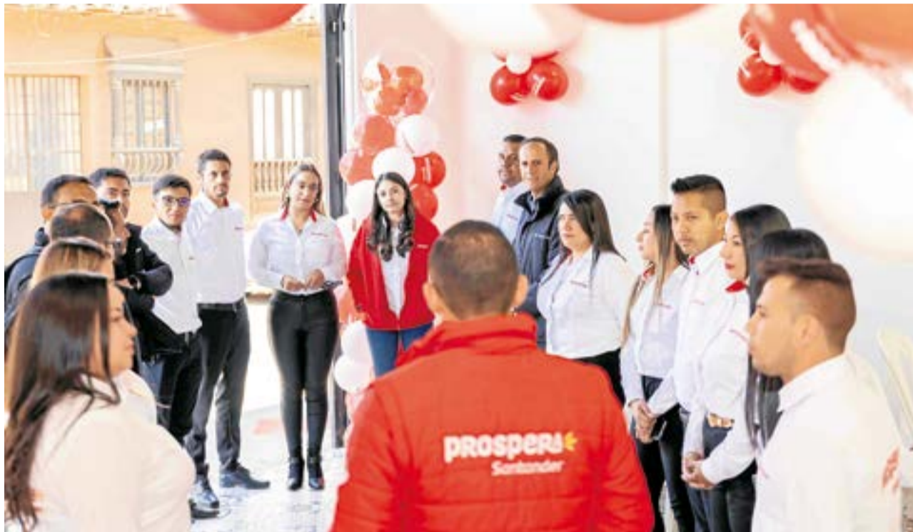
El pasado 19 de enero se llevó a cabo en Ubaté, la inauguración del nuevo punto de encuentro de Prospera, una solución financiera creada por el Banco Santander Colombia.

Con el lanzamiento de Prospera en Ubaté, Banco Santander se suma a la oferta de microcréditos para los emprendedores de la región.