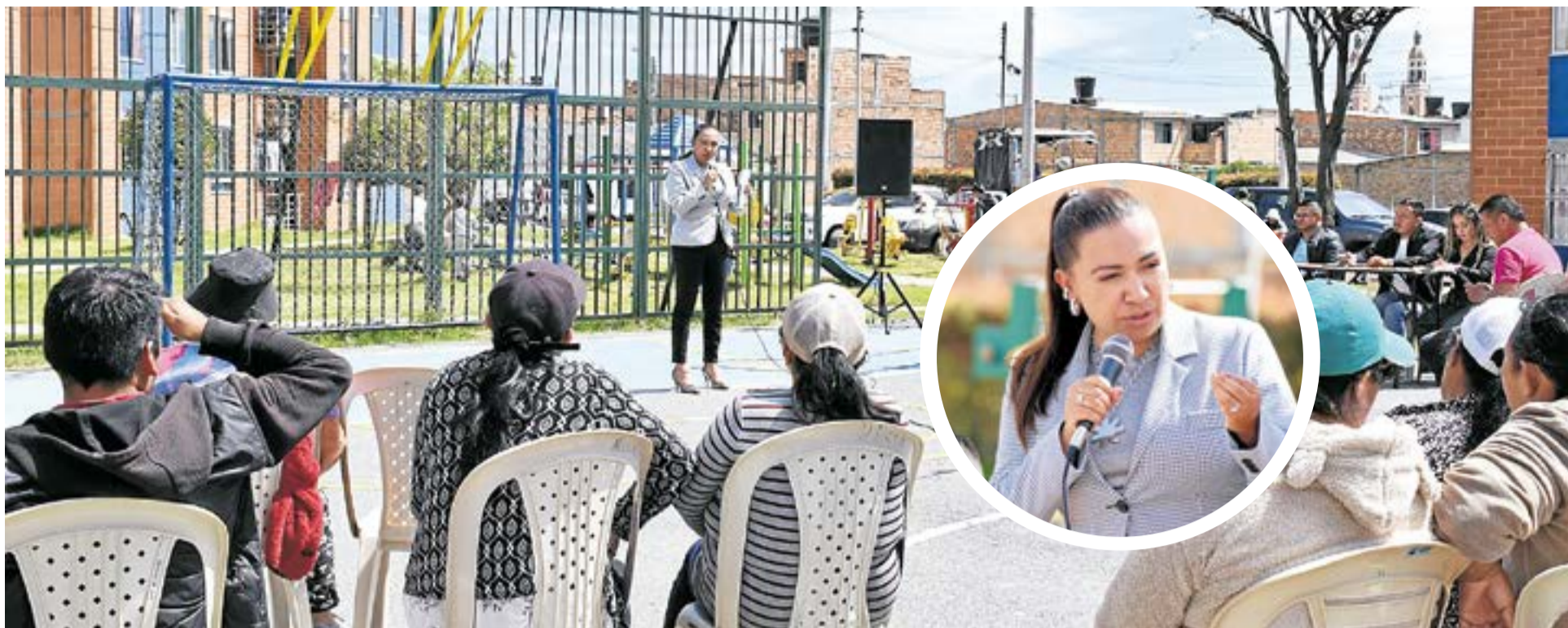
Como respuesta a estas voces ciudadanas, se anunciaron compromisos concretos, entre los cuales se destacó la instalación de un Centro de Atención Inmediata (CAI) de la Policía en la zona, el refuerzo de los frentes de seguridad.