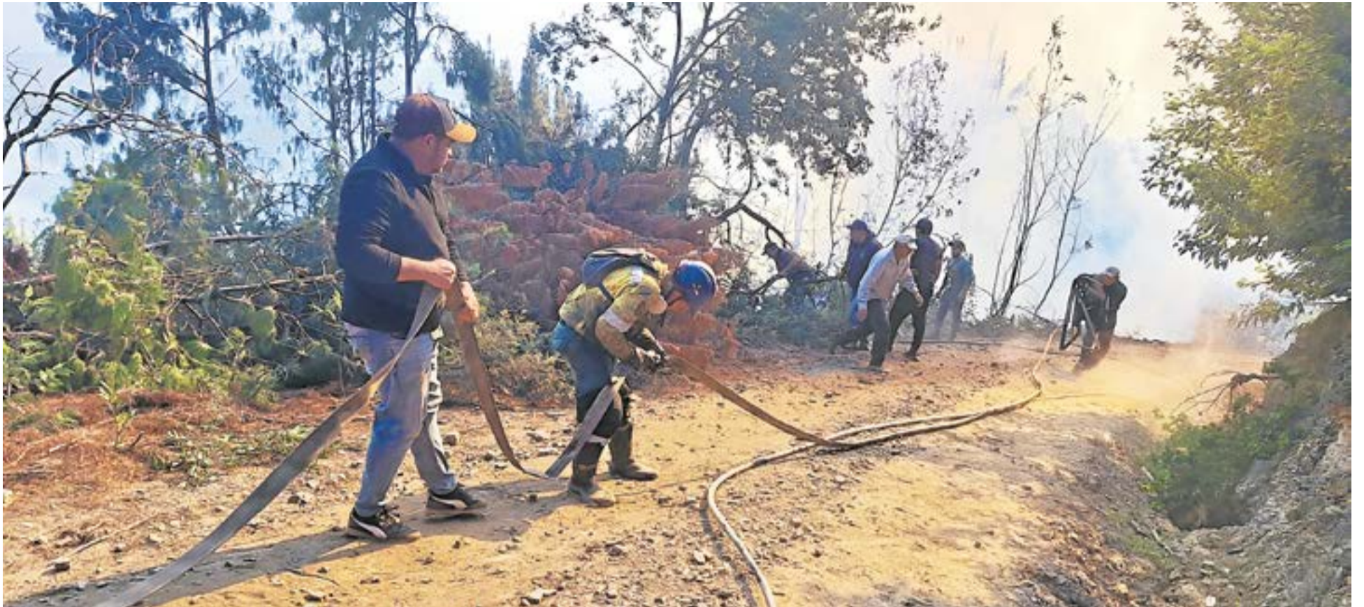
En Fúquene la emergencia alcanza niveles críticos, con una semana de alerta continua por los incendios forestales, especialmente en la vereda Chinzaque del sector El Soche. Tanto la comunidad como las autoridades locales enfrentan desafíos significativos. A. Particular.