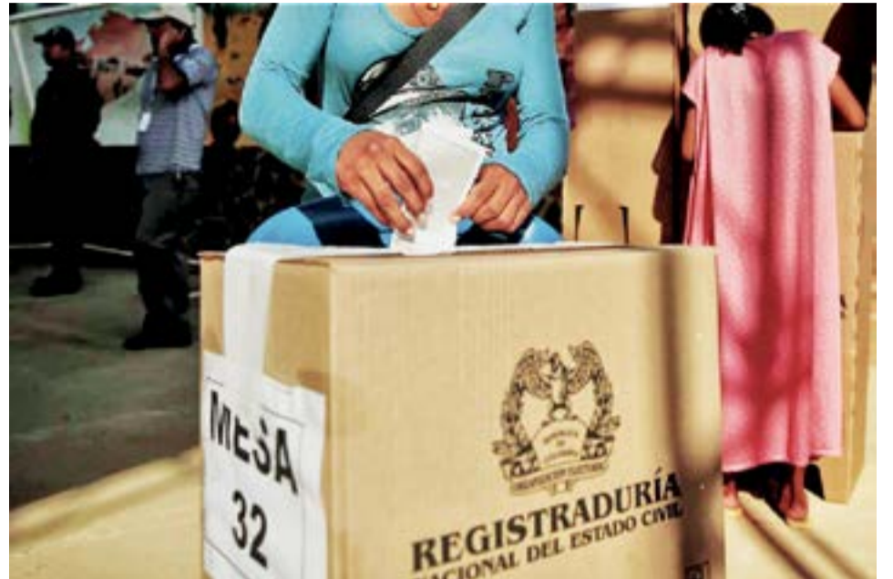
En la contienda electoral en Colombia se escogerán 32 gobernadores, 418 diputados, 1.102 alcaldes, y 12.072 concejales. A.Part.

El Gobierno nacional expidió un decreto en el que se establecen las normas vigentes para la jornada electoral. Este indica que queda prohibida la compra y venta de bebidas embriagantes desde las 6:00 p.m. del sábado 28 de octubre y hasta las 6:00 a.m. del lunes 30 de octubre.