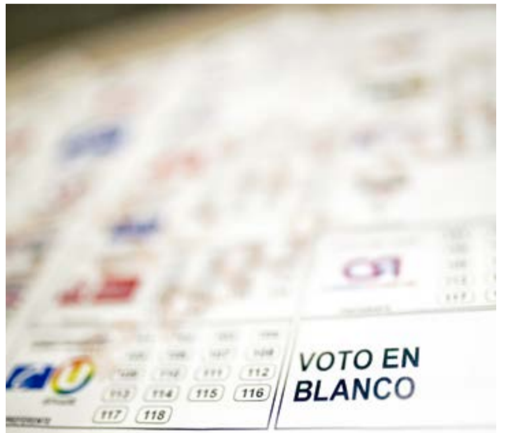
El voto en blanco fue la opción más votada, con 1.910 votos, seguido por el candidato Andrés Peña, el cual obtuvo 538 votos.

Partido Liberal Colombiano: 2 curules: Edwar Gó-