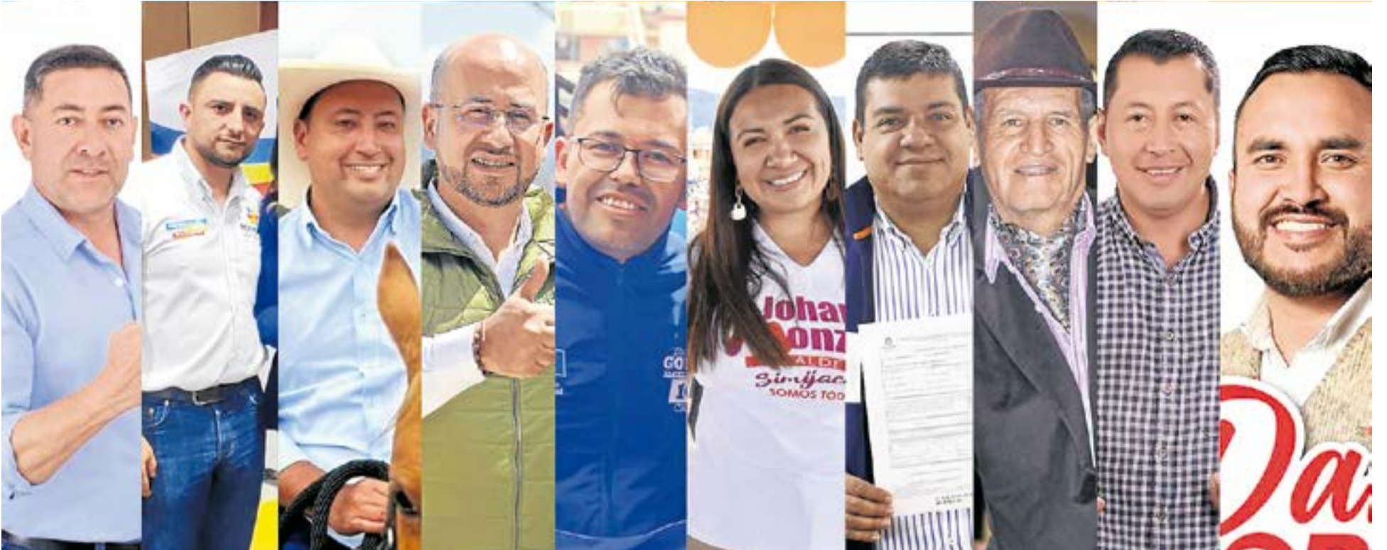
El domingo 29 de octubre se llevaron a cabo las elecciones regionales para el periodo 2024 - 2027 y los electores del valle de Ubaté ya eligieron a sus representantes. Los nuevos mandatarios empezarán sus funciones desde el 1 de enero de 2024.