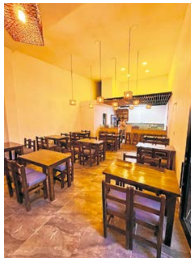
La diversidad de opciones en el menú de Ikigai refleja el compromiso de sus propietarios. Desde los amantes del sushi hasta aquellos que prefieren la calidez de un plato al wok, Ikigai se ha consolidado como el destino culinario por excelencia en Ubaté. La Villa