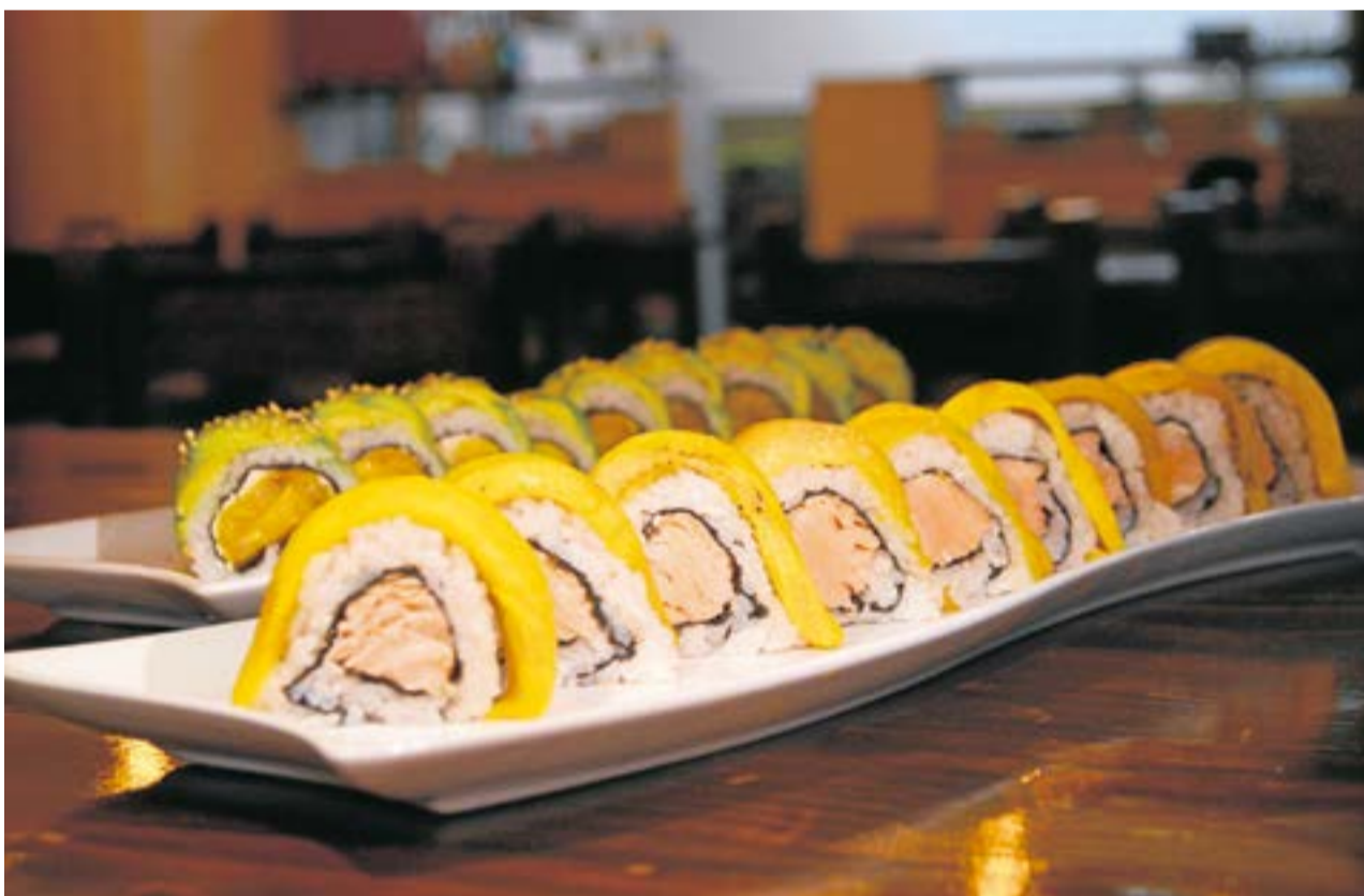
Los propietarios invitan a todos a vivir la experiencia Ikigai en su nuevo punto de encuentro. Este restaurante ofrece una experiencia culinaria única. La Villa

El nuevo punto de Ikigai, ubicado en la Cra 7 No 7 - 45 Local 10, no solo es un lugar para deleitar el paladar con exquisitos platillos, sino que también ofrece un ambiente acogedor y moderno.