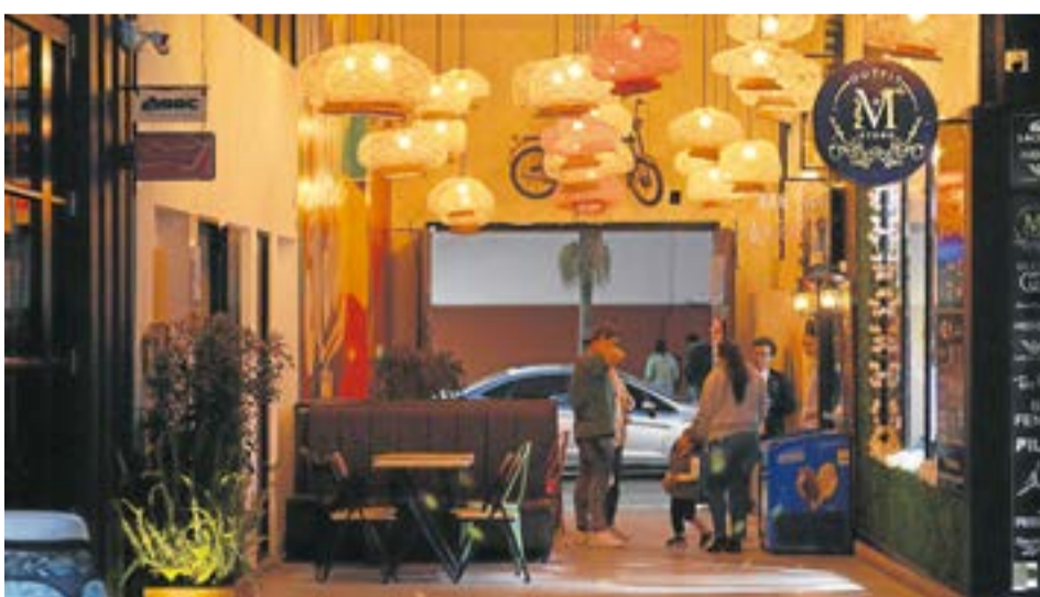
El nuevo punto de Ikigai queda ubicado en la Cra 7 No 7 - 45 Local 10, Plazoleta Santa María en Ubaté, Cundinamarca. La Villa