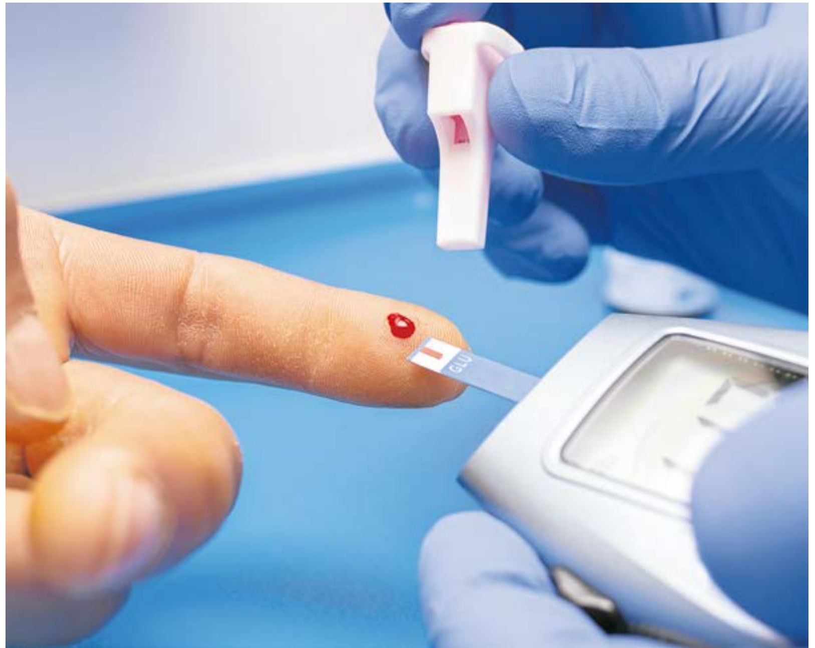
La diabetes es una enfermedad crónica que se origina porque el páncreas no sintetiza la cantidad de insulina que el cuerpo necesita, la elabora de una calidad inferior o no es capaz de utilizarla con eficacia.

"En la actualidad la diabetes es una de las principales causas de fallecimiento en personas entre los 30 y los 70 años, y favorece la aparición de infartos del corazón, trombosis cerebral, amputaciones de las extremidades inferiores y deterioro de la función del riñón, hasta el punto en que las personas pueden necesitar diálisis para con-