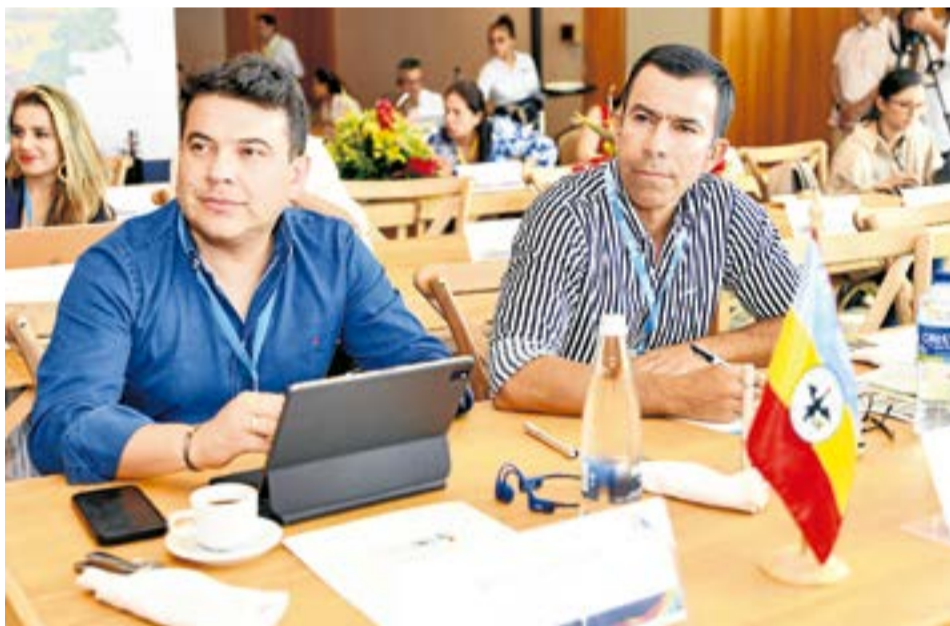
El departamento de Cundinamarca eligió a Jorge Rey como gobernador con un total de 722.842 votos. Le recibirá a Nicolás García.

Tras un proceso electoral que mantuvo a la comunidad expectante, la provincia de Ubaté eligió a sus 10 nuevos alcaldes que asumirán funciones a partir del próximo 1 de enero de 2024.