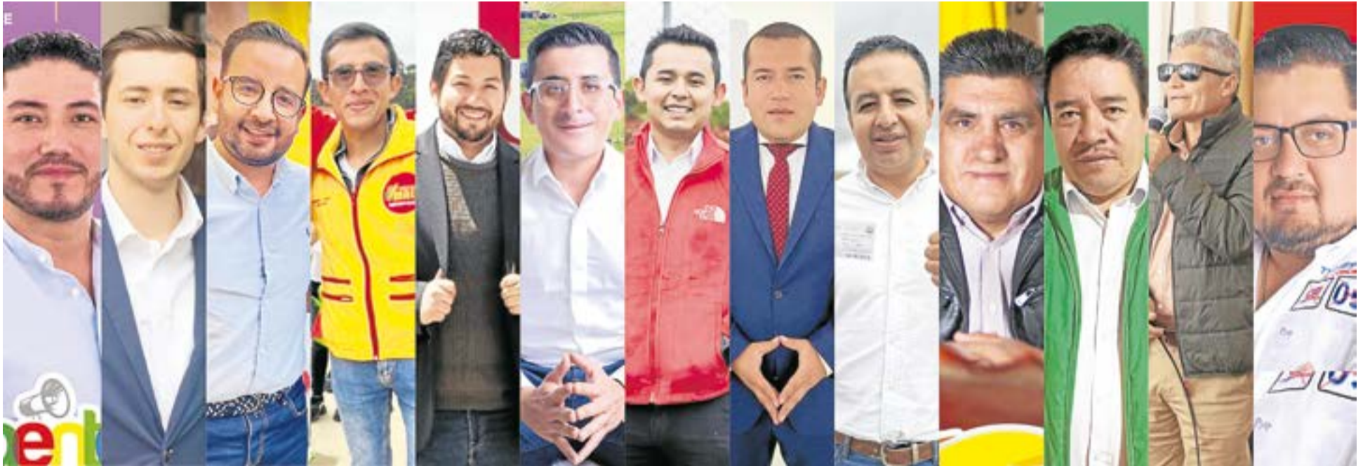
Luego de las elecciones regionales del pasado 29 de octubre, la Registraduría Nacional realizó entrega del acta de declaratoria de elección de los 13 concejales del municipio de Ubaté, Cundinamarca, para el periodo 2024 - 2027.