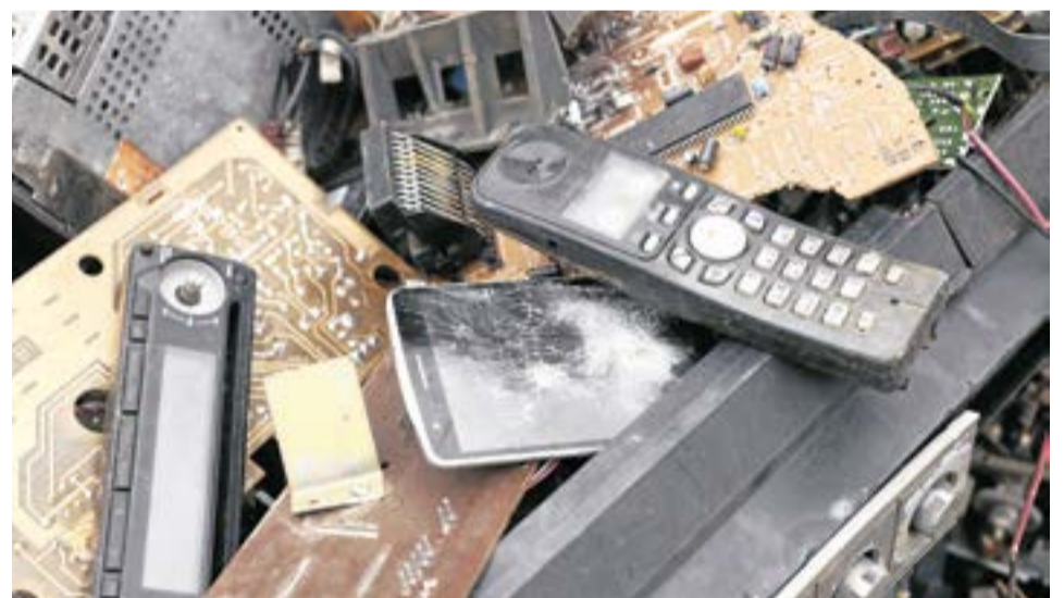
Recuerde que existen dos puntos de recolección de Emservilla en la Casa del Ayuntamiento. Se pueden llevar, además, medicamentos.

"Todos estos residuos se entregan a gestores autorizados para su tratamiento o aprovechamiento y también se ha articulado a través de las jornadas de reciclación