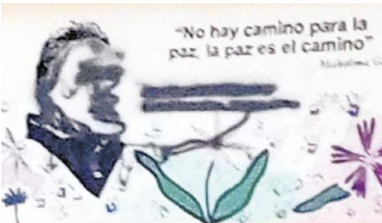
Una vez más el municipio de Sutatausa, Cundinamarca, es escenario de hechos que son materia de investigación.