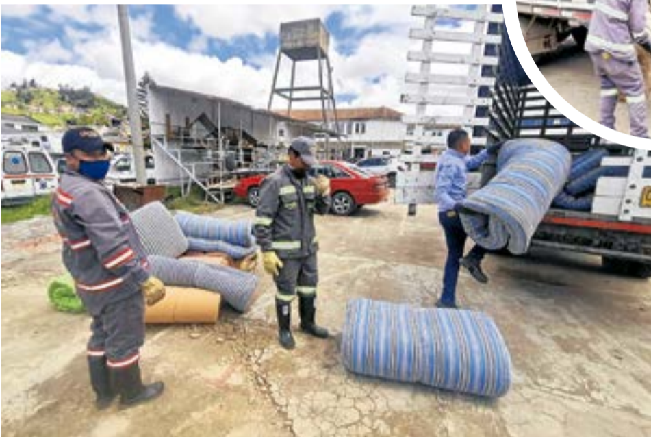
Se busca promover prácticas ambientales responsables y concientizar sobre la importancia de desechar de manera adecuada. A.Part.

Se busca concientizar sobre la importancia de desechar de manera adecuada los productos que ya han cumplido su vida útil.