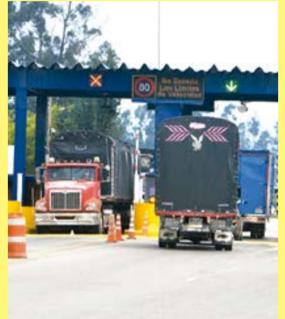
En 2023 no subió el precio de los peajes por decisión del gobierno Petro.

Es un hecho que el precio de los peajes en Colombia subirá para el 2024. Incluso, desde hace dos semanas el Ministerio de Transporte publicó un proyecto de decreto que establece las instrucciones para incrementar los valores de cara al año que viene.