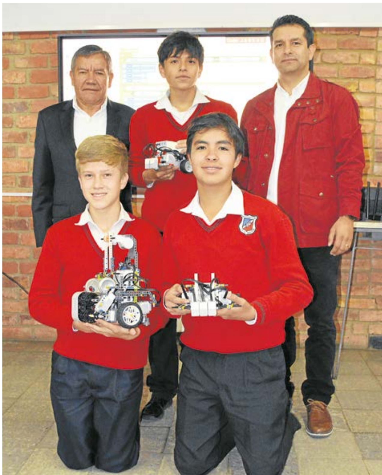
La competencia se desarrollará del 3 al 5 de noviembre en la Universidad Politécnica de Bucarest, Rumania, y cuatro estudiantes, un docente y el rector, viajarán el 31 de octubre.

Con todos los prototipos diseñados, la creatividad fluyendo en cada circuito y pieza mecánica, el equipo