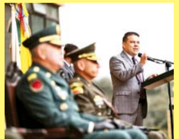
Hospital de Chiquinquirá.