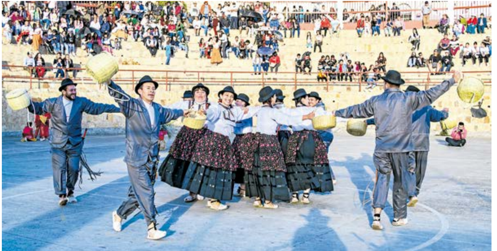
Este evento cultural se remonta a su primera edición en el año 2008.

En esta ocasión, se contará con la participación de agrupaciones provenientes de lugares como Restrepo, Meta; Soatá, Boyacá; Bogotá, La Mesa, Soacha, Villapinzón, Cogua, Chocontá, Ubaté y otros municipios de Cundinamarca que están aún por confirmar. Serán más de 400 artistas en escena que le pondrán color con las expresiones del folclor, las tradiciones populares y otros lenguajes dancísticos que propician el encuentro y la apropiación de la danza