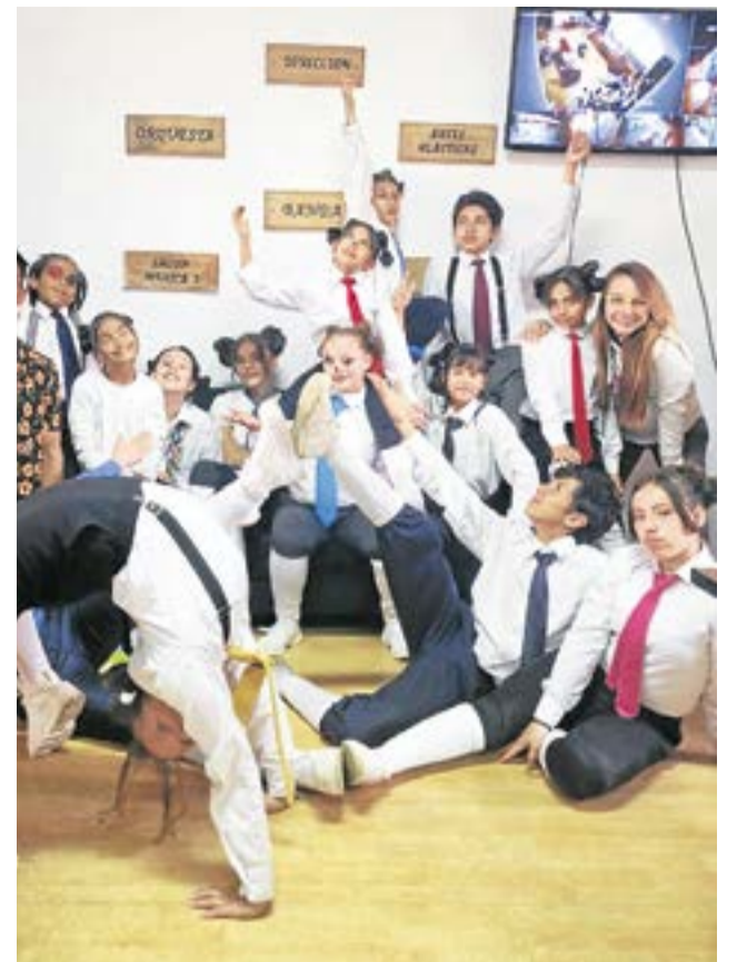
El Centro Cultural Antonio Nariño también pone especial énfasis en la educación de la primera infancia. La creación de una ludoteca con enfoque ancestral enriquece la experiencia de los niños, acercándolos a las tradiciones campesinas y sus valores culturales. La Villa.