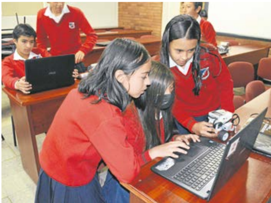
Estos alumnos se reúnen en las tardes para avanzar con los proyectos con los que participan en las competencias nacionales. La Villa-

Estos talentosos jóvenes cuentan ya con todos los prototipos diseñados, pero aún les hace falta el dinero para comprar los tickets, por lo que piden el apoyo de la comunidad.