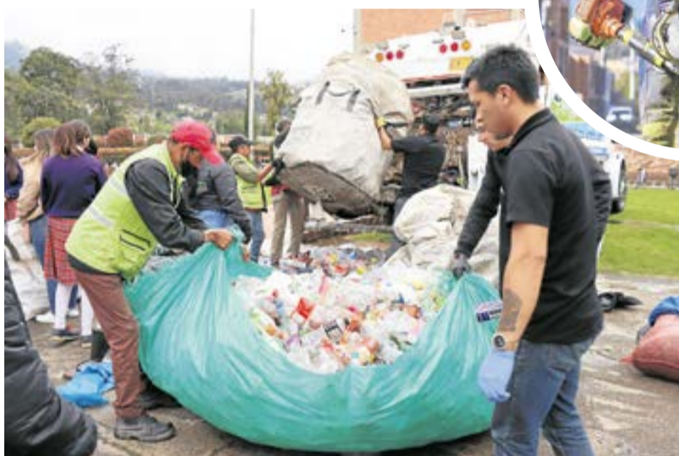
Emservilla fue catalogada como la mejor prestadora en el departamento de Cundinamarca.