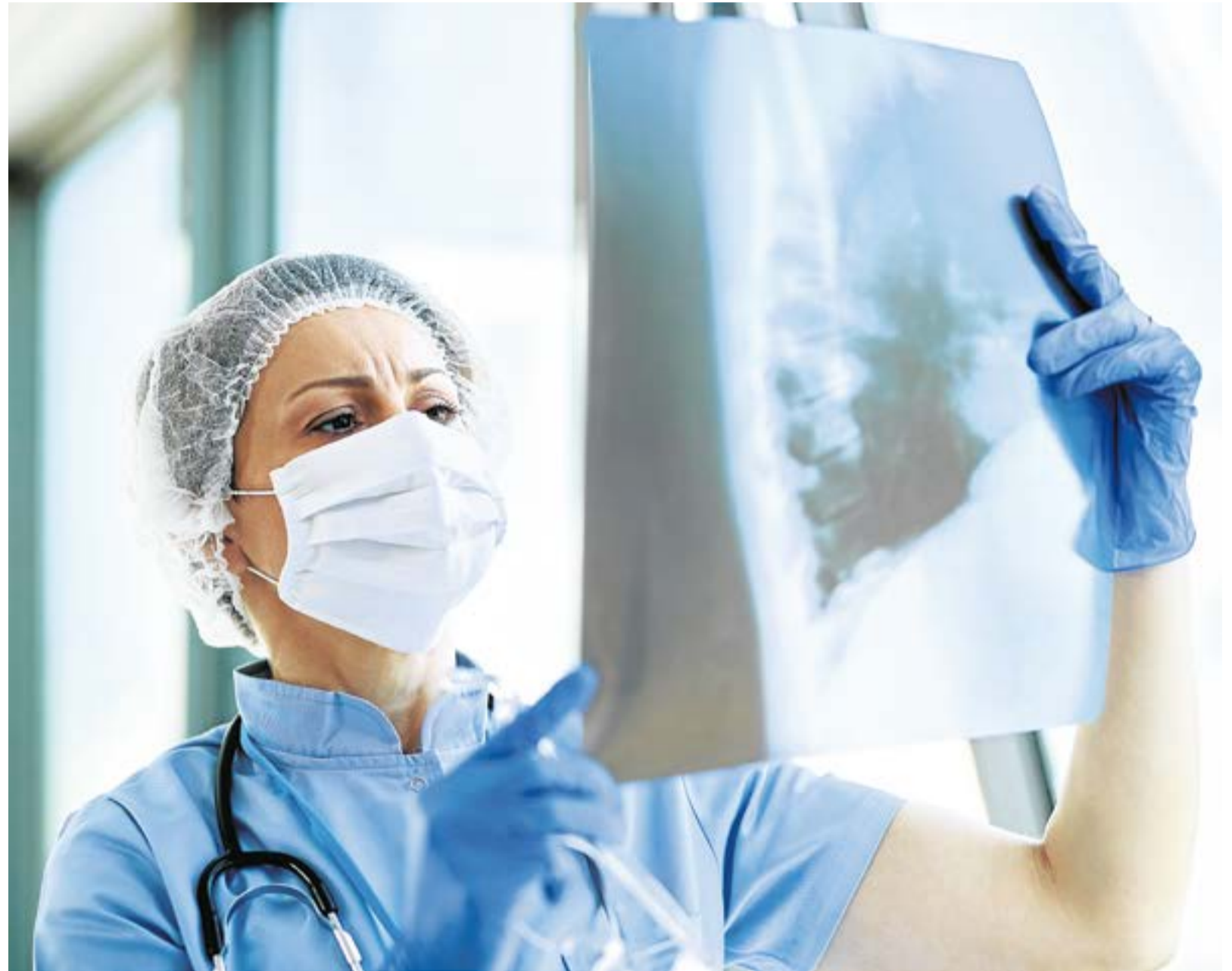
Cuando un enfermo de tuberculosis pulmonar tose, estornuda o escupe, expulsa bacilos tuberculosos al aire, y basta con que una persona inhale unos pocos de estos bacilos para quedar infectada.

La tuberculosis también puede afectar otras partes