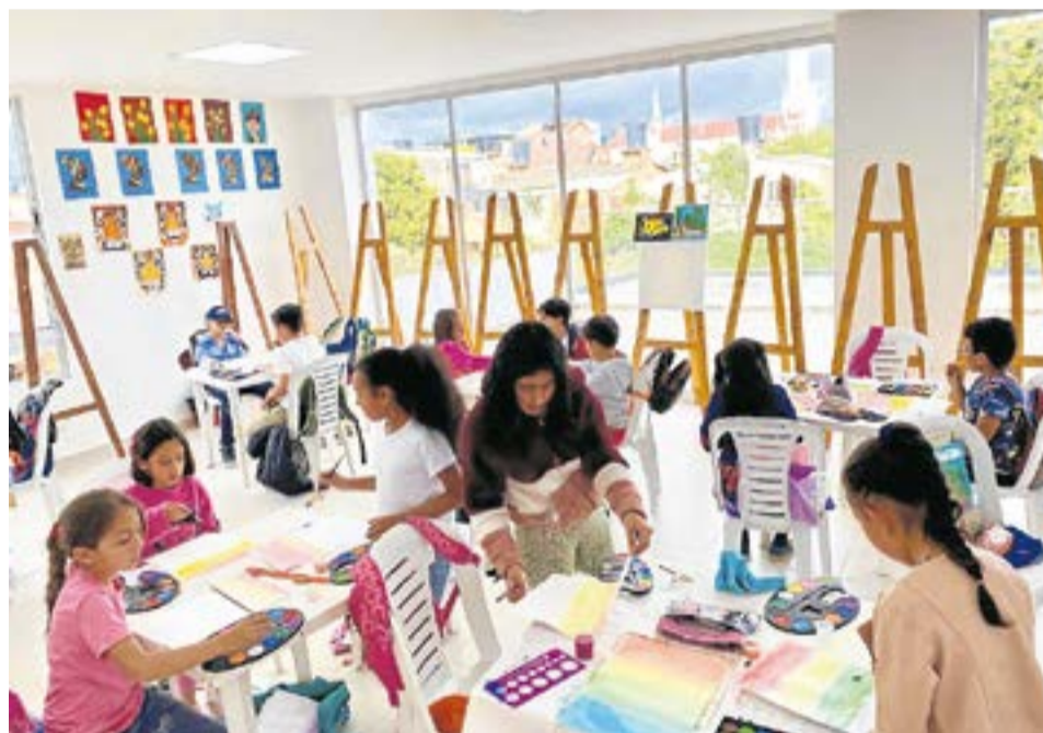
Su influencia cultural y económica en Ubaté se convierte en un ejemplo de compromiso y visión para otras regiones. A. Particular:

Además de las disciplinas artísticas tradicionales, el Centro se ha aventurado con valentía en áreas únicas como el yoga y las artes circenses, que han encontrado gran acogida entre los participantes.