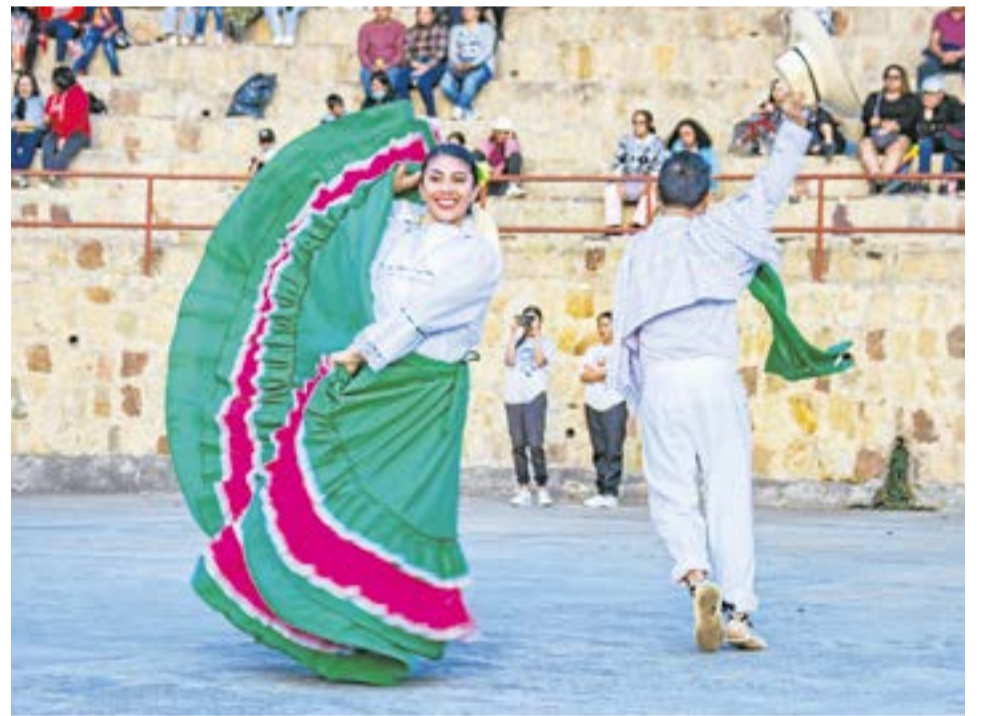
Sutatausa se llenará de ritmo, color y alegría en un evento que trasciende las fronteras geográficas.

vida a promover diversas manifestaciones artísticas como la danza, la poesía, el canto y las coplas. Su legado perdura en la esencia misma del festival y en la pasión que los participantes ponen en cada presentación.