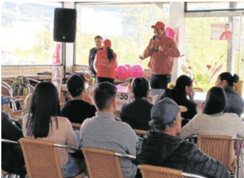
El candidato, avalado por el Partido Liberal, mencionó que se encuentra socializando su propuesta de gobierno.

“Para solucionar el problema de acueducto y servicios básicos hay que conservar los nacimientos hídricos y reservorios naturales en la parte alta o páramo, además de diseñar y construir sistemas independientes de agua para viviendas y riego”.