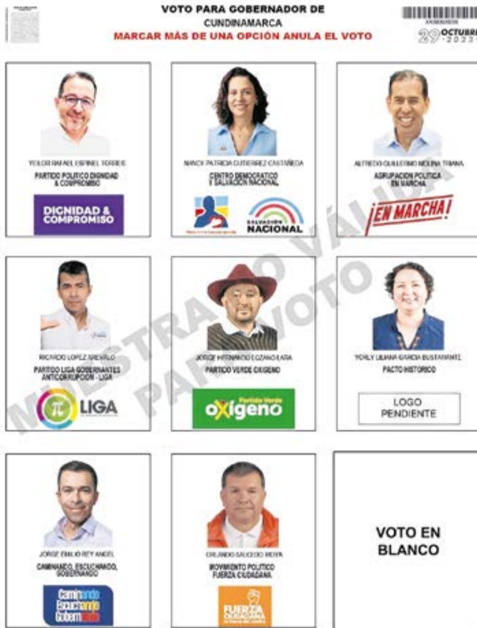
El próximo 29 de octubre se conocerán los resultados de quién será el próximo gobernador de Cundinamarca.