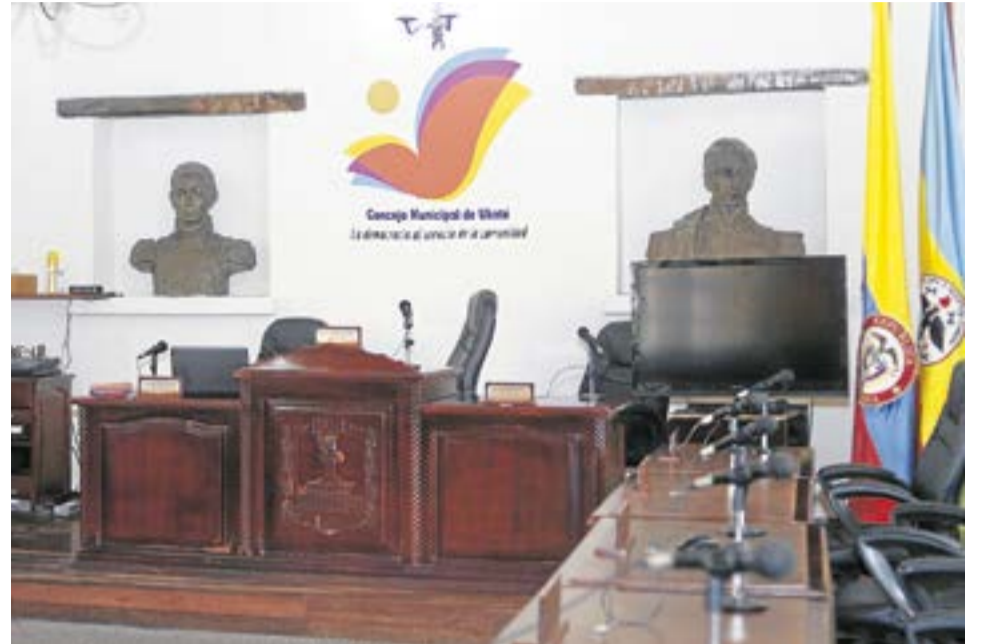
Algo clave de los concejos municipales en Colombia es que pueden ejercer control político al ejecutivo, es decir, al alcalde. A. Partr.

A su vez, en la guía "los Concejos Municipales: actores claves en la gestión del desarrollo de los municipios", documento elaborado por el Departamento Nacional de Planeación, La Escuela de Administración Pública (Esap) y la Usaid, las principales funciones de los concejos municipales son: