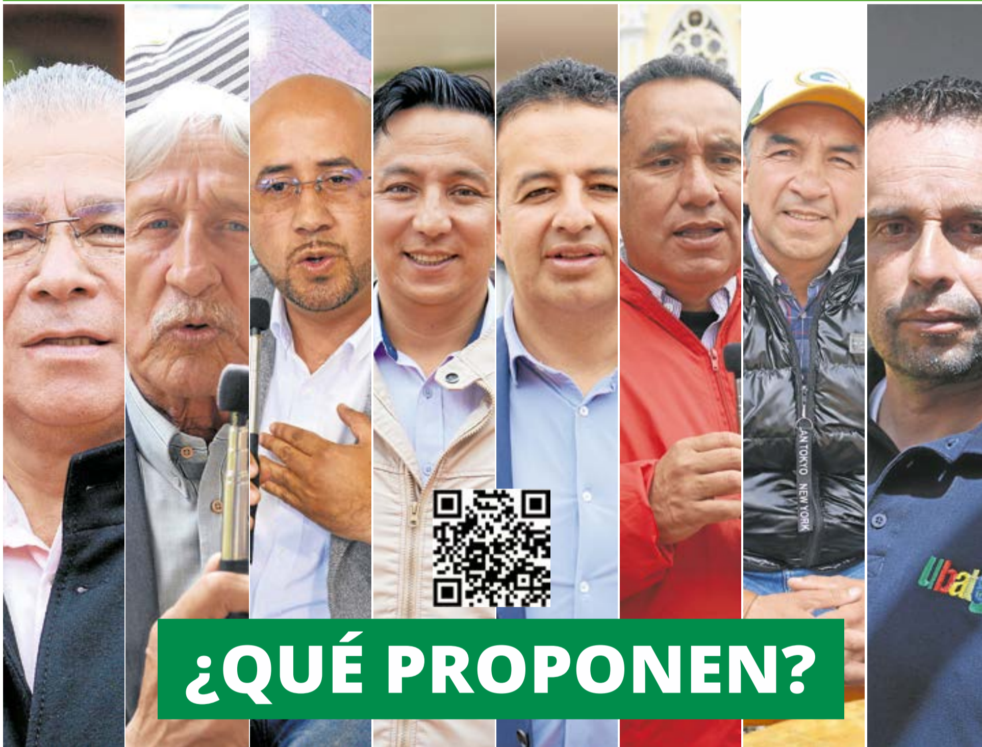
En el tarjetón aparecerá la foto de los ocho candidatos que buscan quedarse con la administración municipal de Ubaté, cada uno con sus respectivos partidos y movimientos políticos. También está la casilla del voto en blanco.