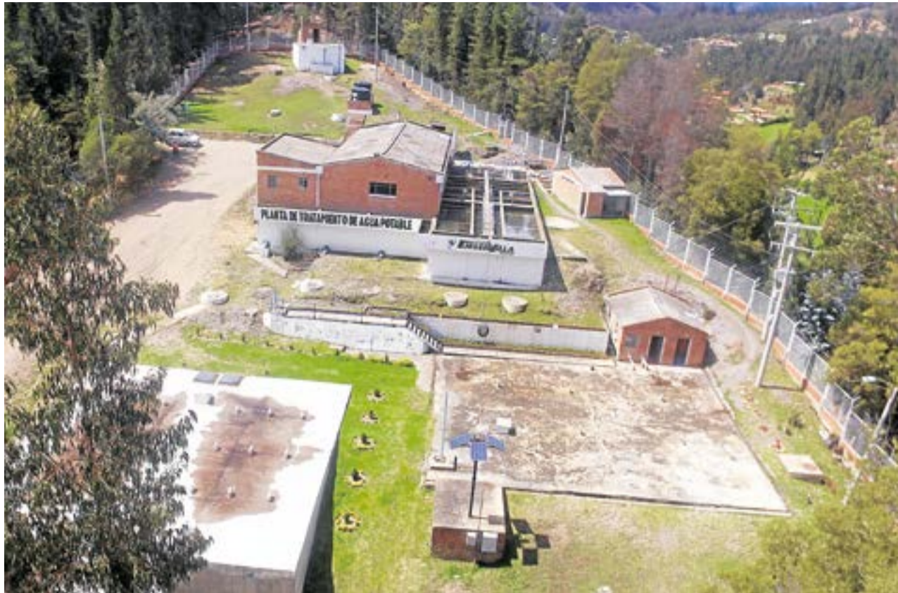
Tras su captación, el agua es dirigida cinco kilómetros vía tubería hasta la PTAP, ubicada en el barrio San José (Ubaté), en donde inicia otro proceso.

De la Canaleta Parshall pasa a otro punto en donde empieza el proceso de coagulación, el cual consiste en aplicar un químico que ayuda a que las impurezas del agua se aglutinen y 'la mugre' quede retenida. "El químico se aplica de acuerdo al caudal que esté entran-