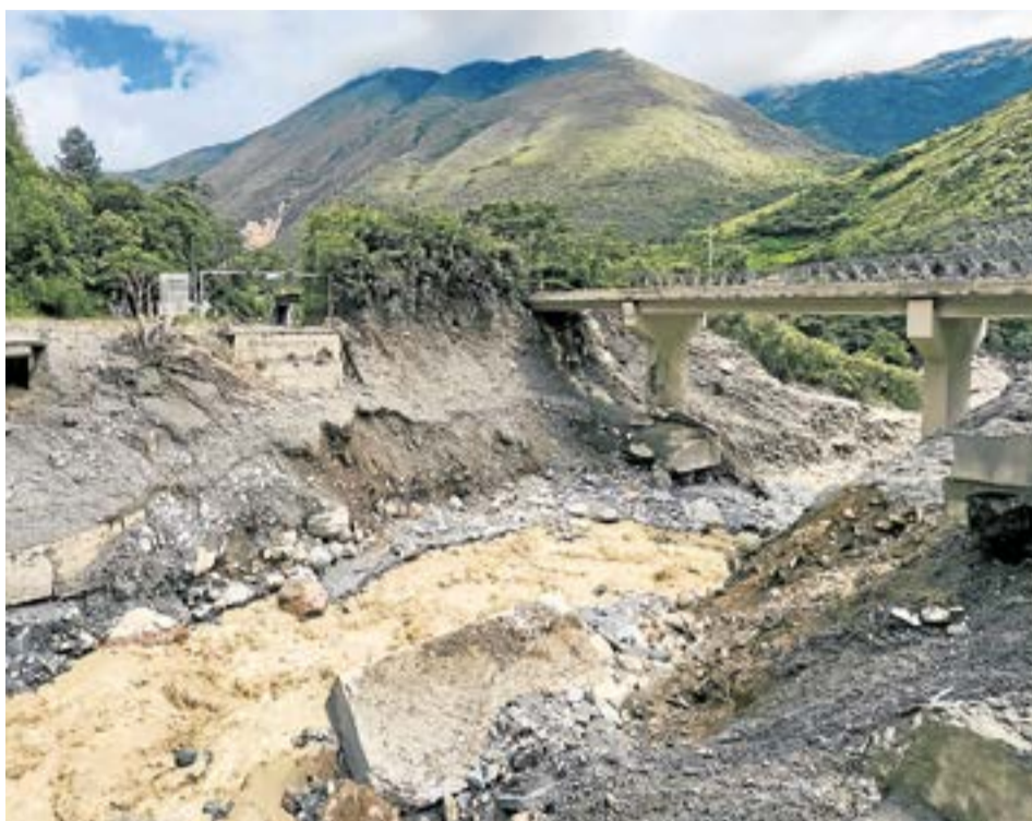
El paso que se habilitará por la zona afectada será a un carril, con el fin de permitir el flujo permanente de vehículos. A. Particular:

Desde Quetame, y tras instalar un Puesto de Mando Unificado, el presidente Gustavo Petro anunció una serie de medidas para enfrentar esta emergencia que ha cobrado la vida de 26 personas.