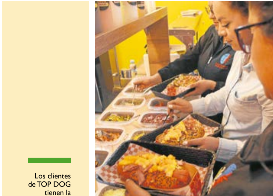
El factor diferencial es su amplia variedad de toppings innovadores.