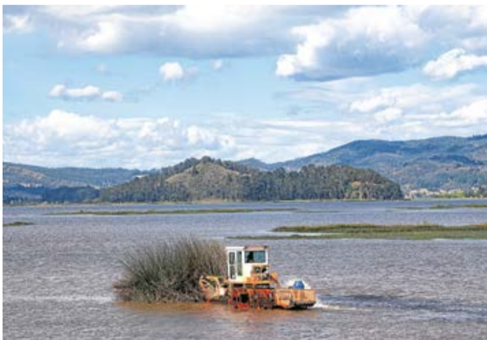
Como parte de la recuperación, hoy la CAR inspecciona los vertimientos para contrarrestarlos, así como la pesca ilegal. A. Particular:

A la fecha, son alrededor de siete mil kilómetros de ocho fuentes hídricas, que incluyen los ríos Suárez y Lenguaque, en los que se han realizado limpieza y mantenimiento para permitir el libre flujo del caudal.