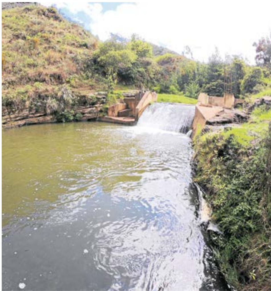
Emservilla indicó que la calidad del agua se monitorea con parámetros físicoquímicos y micro biológicos. Foto: Sector El Guacal.

El agua es captada por medio de una rejilla que lleva a una cámara y a unos ductos dirigidos a los desarenadores: el primer proceso de purificación.