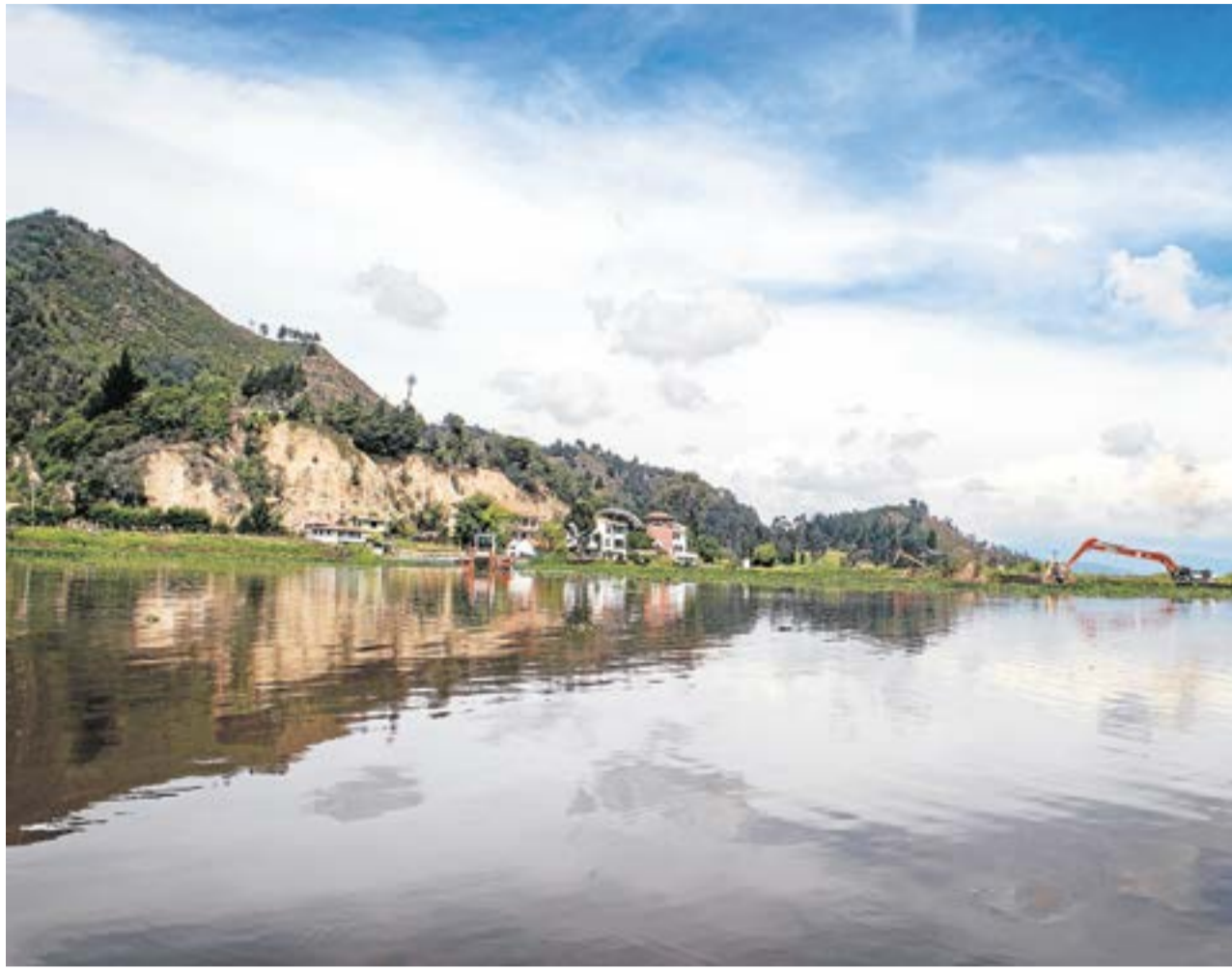
A la fecha son alrededor de siete mil kilómetros de ocho fuentes hídricas, que incluyen los ríos Suárez y Lenguaque, en los que se han realizado limpieza y mantenimiento.

Como parte de la recuperación, hoy la CAR inspecciona a través de video los vertimientos para contrarrestarlos, así como la