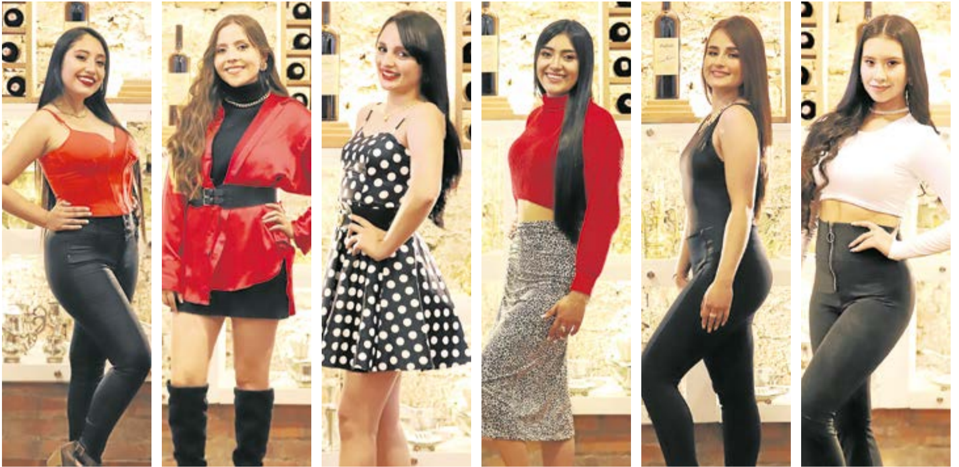
Ya se conocen las aspirantes al Reinado Provincial del Carbón y la Leche 2023, en el marco de la celebración de las ferias y fiestas en honor al Santo Cristo de Ubaté, que se desarrollarán del 22 de julio al 13 de agosto del presente año.