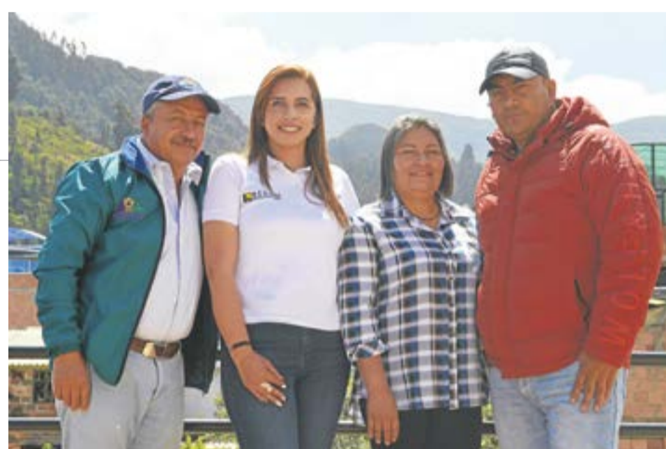
Para 1998, los hermanos asumieron roles más administrativos y de oficina, en una época difícil para el sector.

Emplean alrededor de 200 empleados, de los cuales 140 ellos llevan más de cinco años de antigüedad. Extraen un promedio mensual de 7.000 toneladas al mes, y manejan un carbón de bajo y medio volátil metalúrgico.