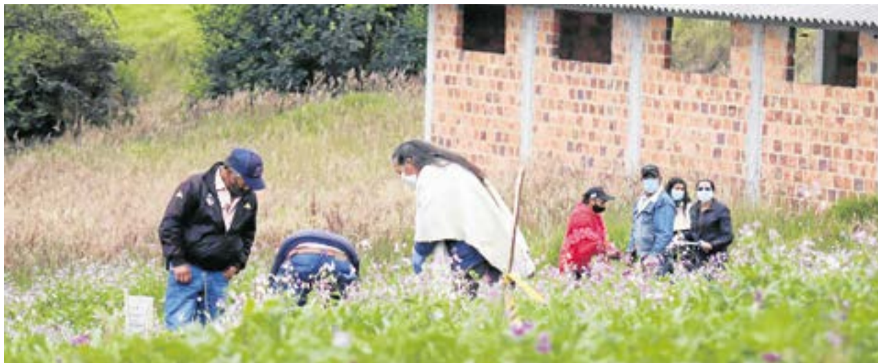
Las papas comerciales —sabanera, pastusa, R12 o criolla— son las que se encuentran en los mercados. Las nativas, como no se conocen, no se cultivan.

Los campesinos de la zona dicen, habían dejado de sembrarlas porque son poco rentables. Las papas comerciales —sabanera, pastusa, R12 o criolla— son las que se encuentran en los mercados. Las nativas, como no se