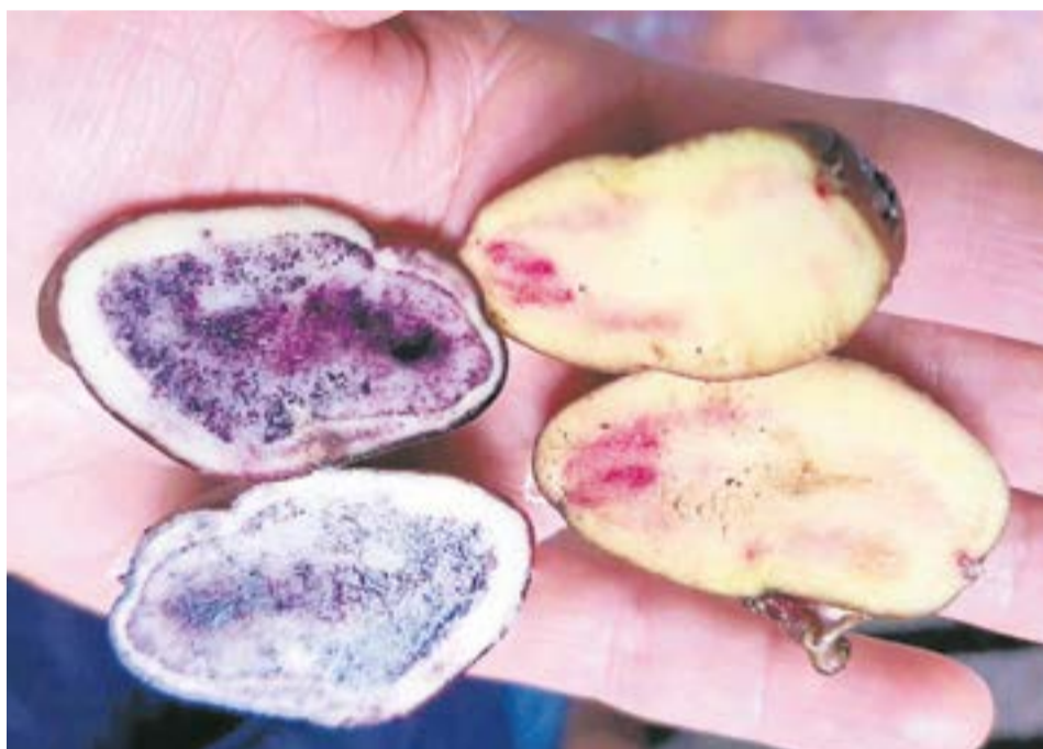
El mayor valor del proyecto está en que se han vuelto a conocer y a cultivar estas papas nativas.

El proyecto no se limita al rescate de las papas nativas, en los cultivos han combinado diferentes hortalizas y plantas aromáticas como lechuga, brócoli, espinaca, arveja, caléndula, menta, hierbabuena y ají.