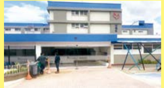
Hospital de Chiquinquirá.