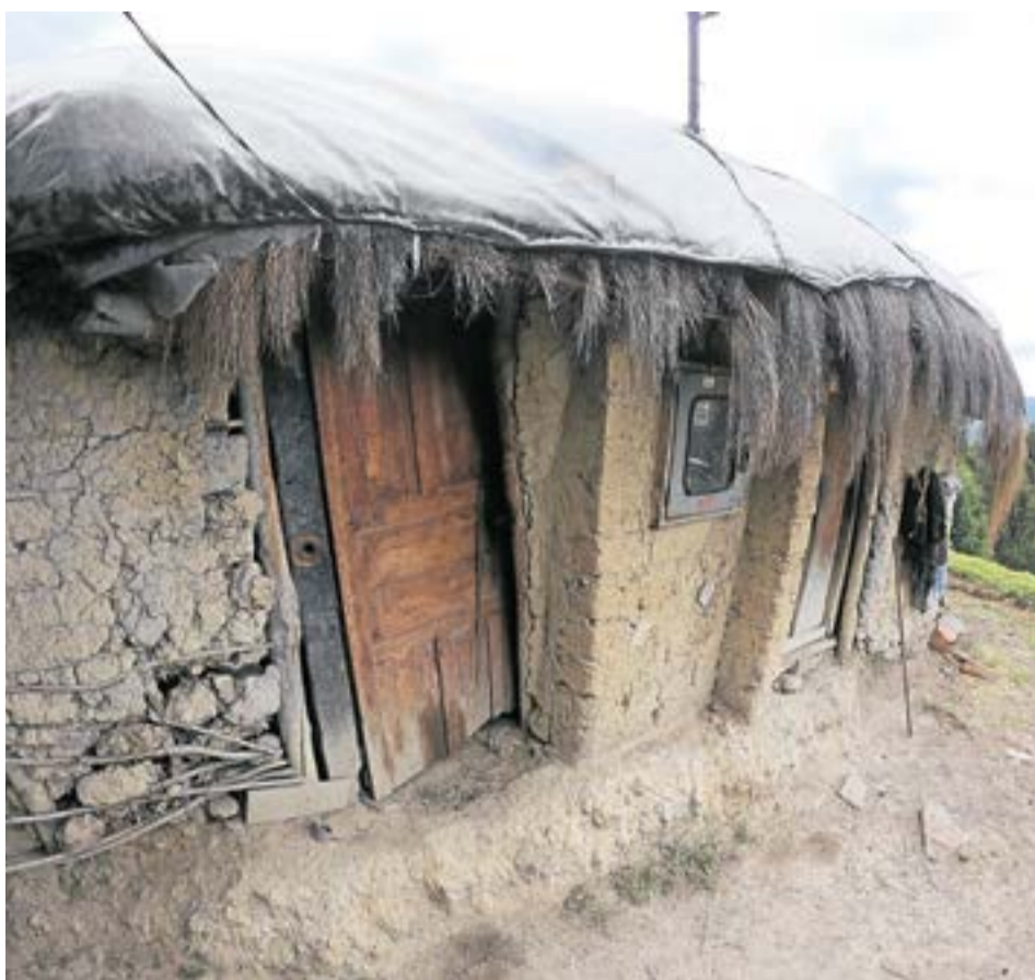
Juanito vive en El Campito, su casa ubicada en la vereda Hato Viejo, a unos 30 minutos del casco urbano de Sutatausa.

Su casa está construida de bahareque, paja, madera, y parte del techo está cubierto con hule, que le sirve para protegerse de los días lluviosos.