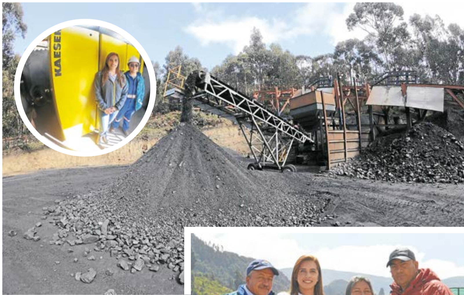
Extraen más de 7.000 toneladas al mes, carbón bajo y medio volátil metalúrgico. La Villa