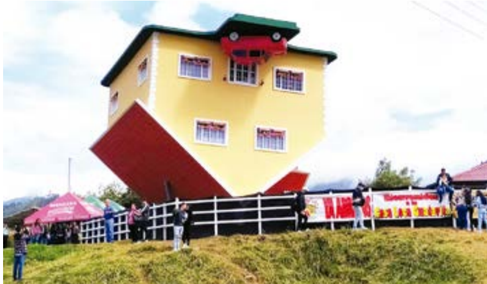
El Idecut destacó que los operadores y prestadores ya están encadenando las experiencias que ofrecen estos municipios. A.Part.

"Muy feliz de presentar esta estrategia que llevará a los colombianos a conocer Cundinamarca; un escenario en el que se han unido prestadores turísticos para promocionar estos territo-