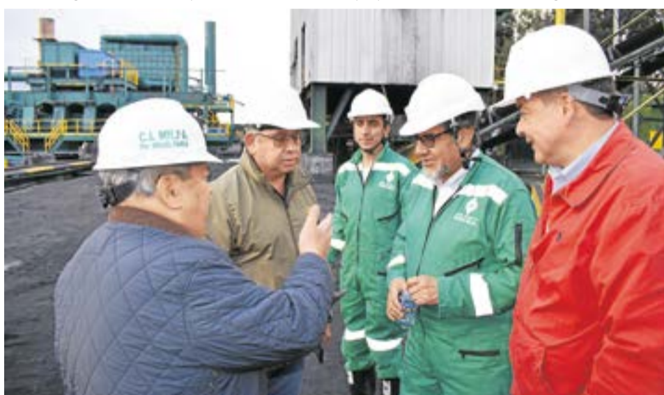
El presidente de la ANM, junto con el Ministerio de Minas, visitaron una de las minas de carbón en Guachetá.