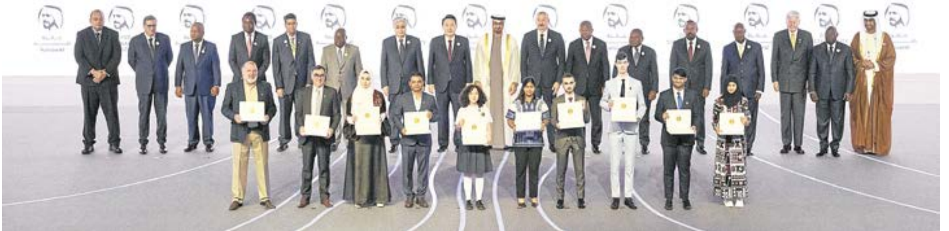
En su momento, el colegio celebró ser uno de los tres finalistas del continente americano con el "Programa de Calidad del Aire Comunitario" para abordar las crisis de contaminación del aire y mejorar "la salud de 200.000 personas que viven en la región". A.Particular.