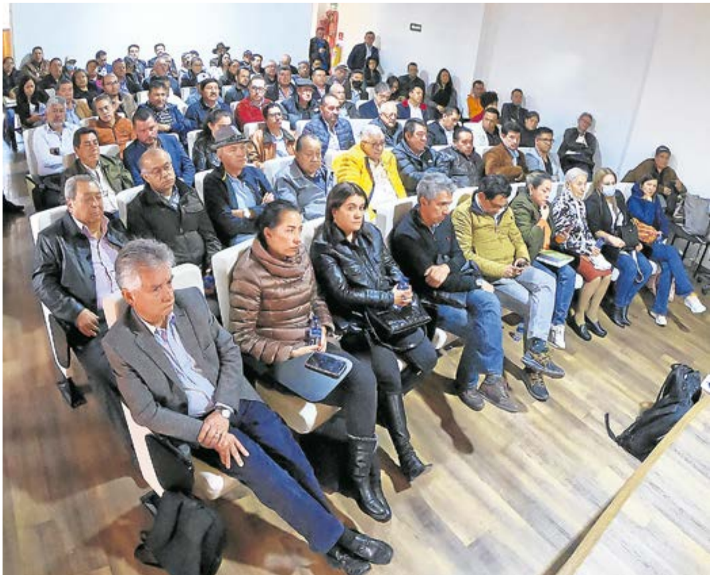
El presidente de la ANM indicó que el carbón coque es fundamental como insumo para la producción del acero y que impacta directamente a dos programas de gobierno. La Villa-

Se desarrolló conversatorio en el auditorio de la Casa sede de la Federación de Productores de Carbón de Cundinamarca (Fedecundi), en Ubaté, en el que la ANM amplió sus acciones de trabajo y escuchó a los diferentes empresarios.