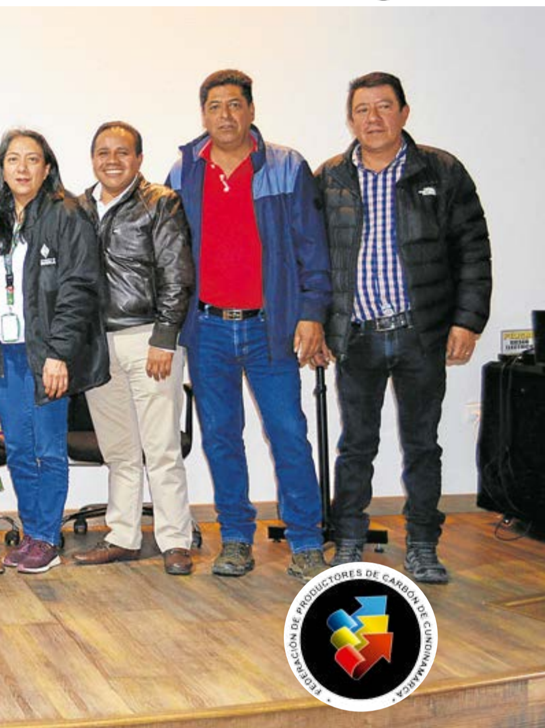
Respecto a la reforma del Código Minero, la visión en política de formalización minera y el panorama actual de cara al nuevo gobierno. La Villa.