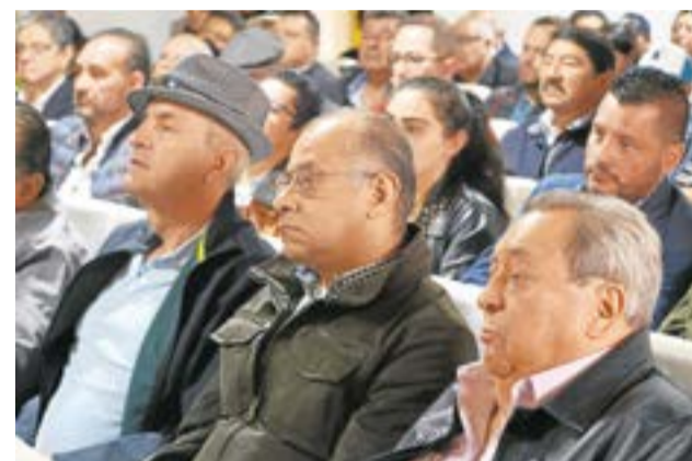
La ANM indicó que en el año 2022 se revisaron el 50% de los títulos mineros. La Villa.

Resaltó la importancia de cumplir con las normas establecidas para poder operar los títulos mineros "El Gobierno dio un mensaje claro, el que no cumpla con sus obligaciones contractuales se evaluarán posibilidades para que lo haga, y si no lo hace en los términos