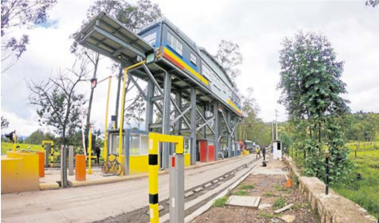
En marzo de 2023 se completan dos años desde que iniciaron los cobros de peaje La Balsa.