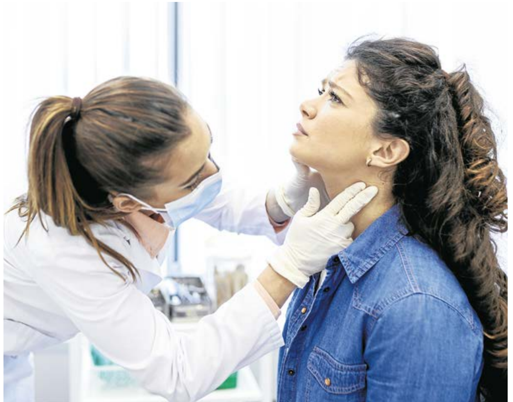
Si el dolor de garganta es síntoma de una afección que no sea una infección viral o bacteriana, probablemente se considerarán otros tratamientos, dependiendo del diagnóstico.

La amigdalitis suele estar causada por un virus en alrededor del 60% de las ocasiones y por bacterias en el 40% restante. Hay una gran variedad de virus y bacterias que pueden causar la infección, entre ellos el virus de Epstein-Barr (perteneciente a la familia herpesvirus), el